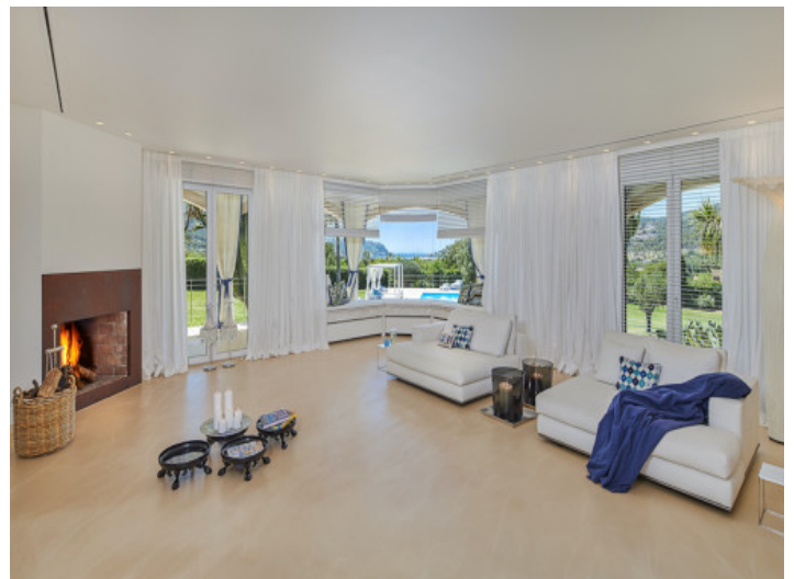
Offener Wohnbereich mit Kamin

Alle Angaben nach bestem Wissen. Irrtum und Zwischenverkauf vorbehalten. Dieses Exposé ist eine Vorinformation, als Rechtsgrundlage gilt allein der notariell abgeschlossene Kaufvertrag.