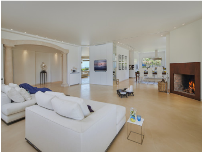
Offener Wohnbereich mit Kamin