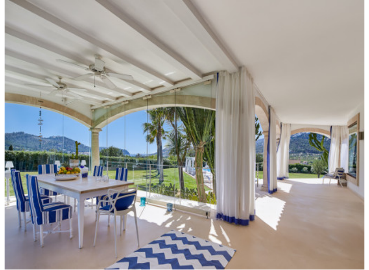
Überdachter Essbereich auf der Terrasse