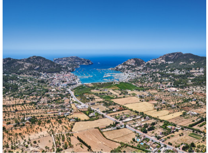
Das Anwesen aus der Vogelperspektive