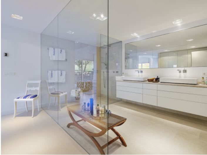
Badezimmer en Suite