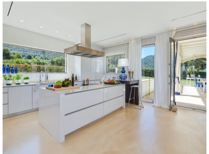
Moderne Küche mit Kochinsel