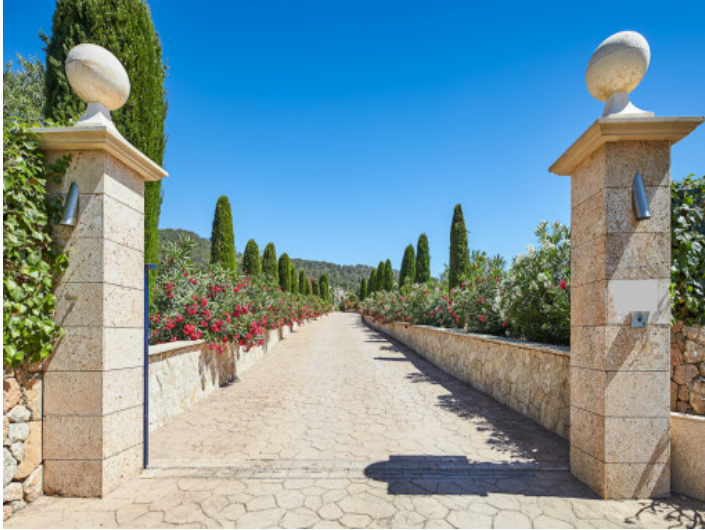
Lange Auffahrt des Anwesens