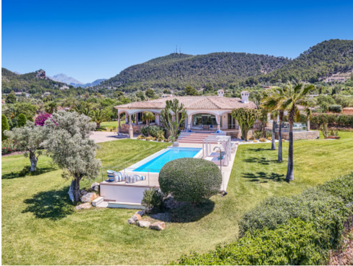
Außenansicht der Villa