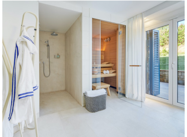
Schöner Spa Bereich mit Sauna