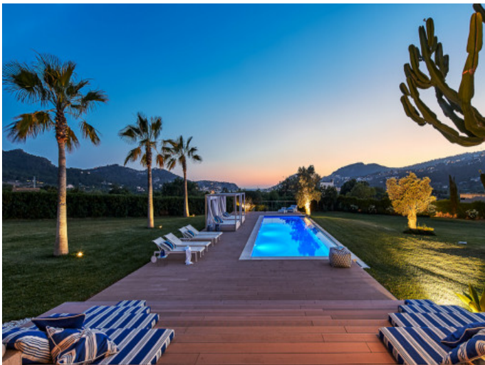
Pool bei Sonnenuntergang