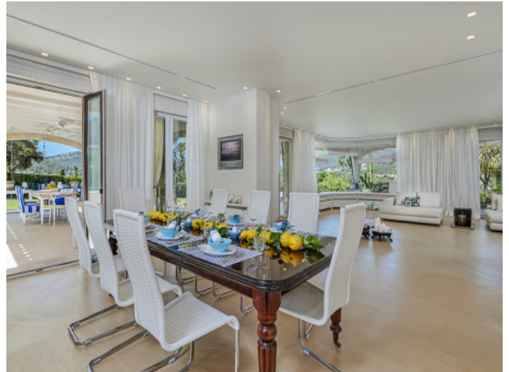
Offener Wohnbereich und Essbereich