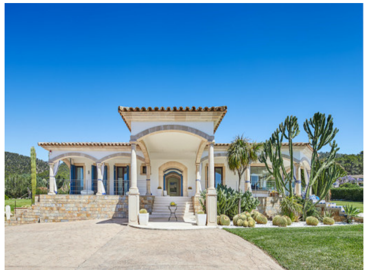
Außenansicht der Villa

Alle Angaben nach bestem Wissen. Irrtum und Zwischenverkauf vorbehalten. Dieses Exposé ist eine Vorinformation, als Rechtsgrundlage gilt allein der notariell abgeschlossene Kaufvertrag.