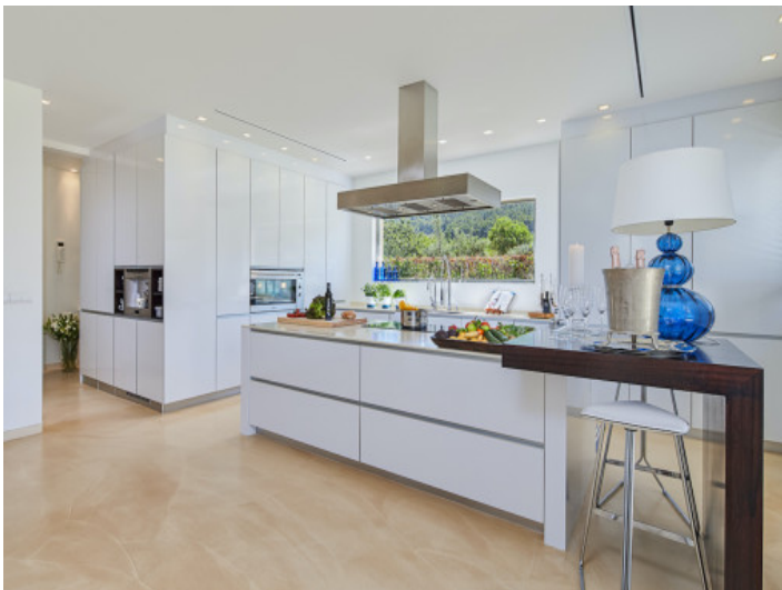
Moderne Küche mit Kochinsel