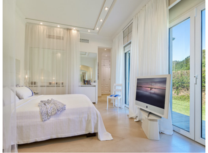
Weiteres großes Schlafzimmer