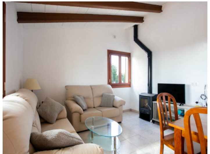
Wohnbereich mit Kamin