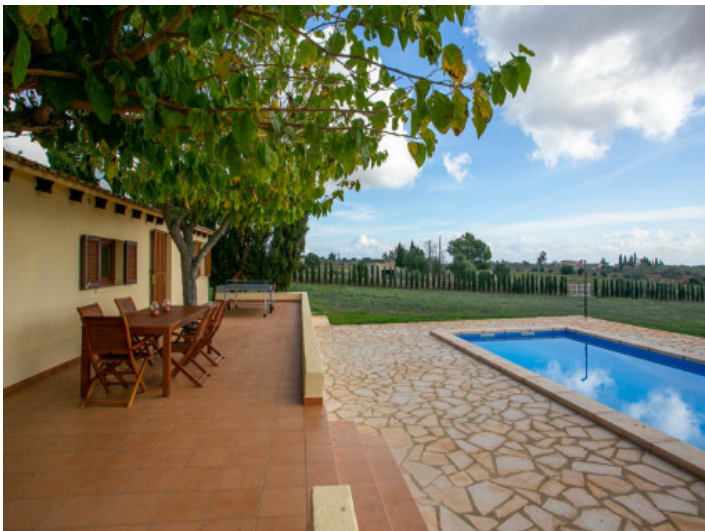
Terrasse und Pool