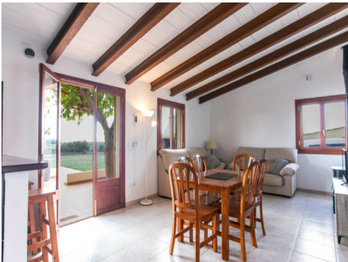
Heller Wohn- und Essbereich