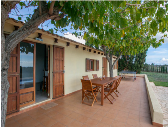
Essbereich auf der Terrasse