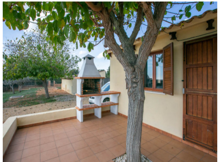
Grillbereich auf der Terrasse