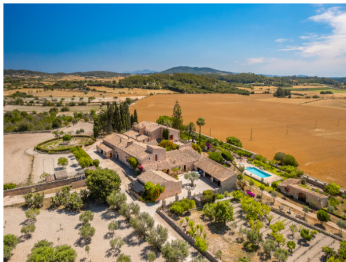
Blick des Anwesens von oben