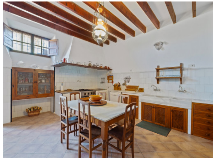
Rustikale Küche mit Essbereich