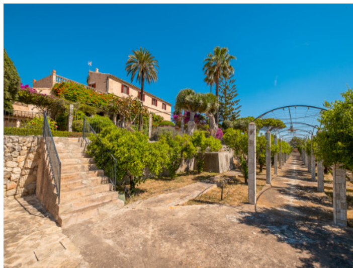
Außenansicht und Gartenbereich der Finca