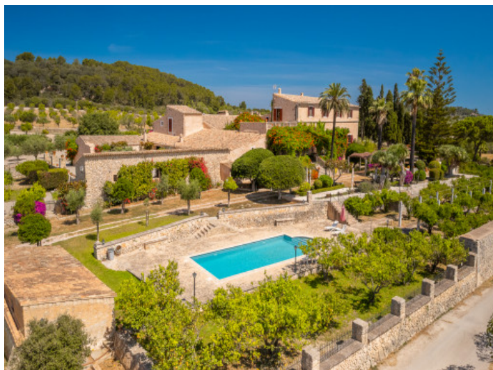
Schönes Finca Anwesen mit Pool in Montuiri