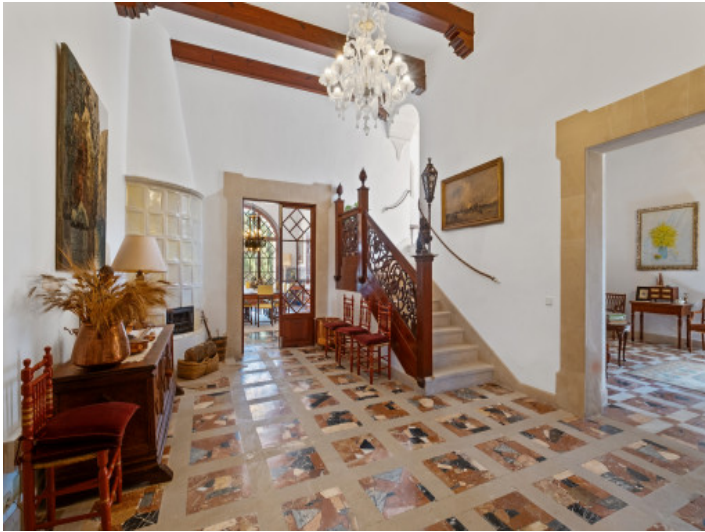
Flur und offener Wohnbereich