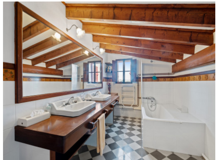
Weiteres Badezimmer mit Badewanne