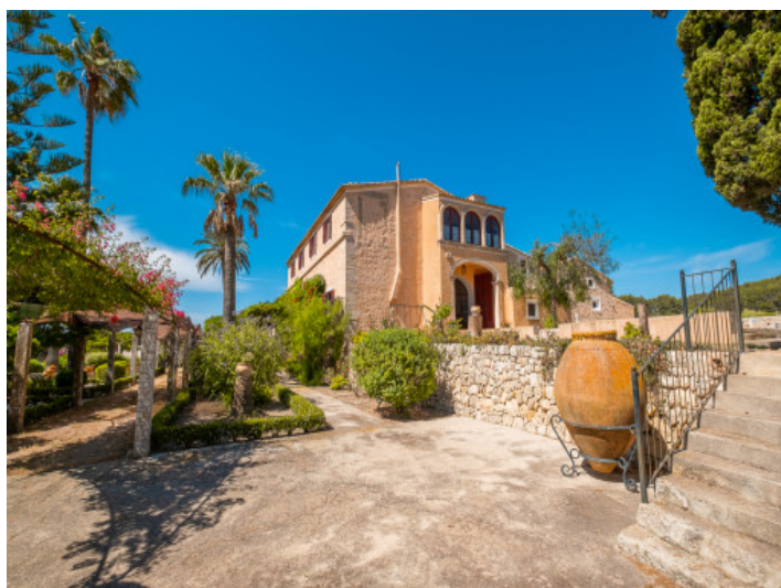
Außenansicht der Finca