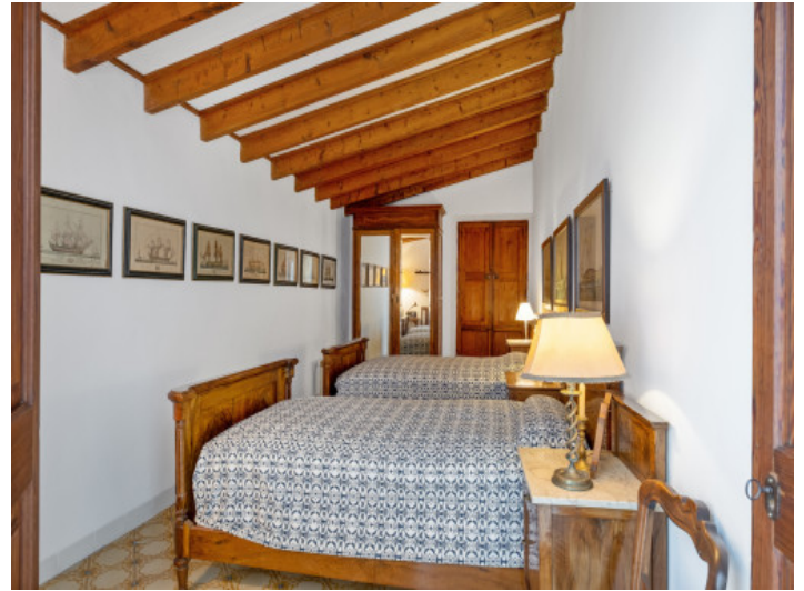
Eines von 11 Schlafzimmern