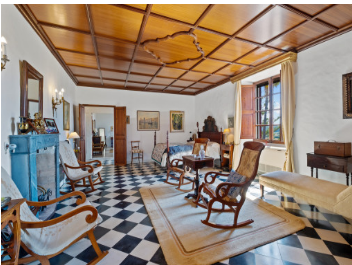
Noble Schlafzimmer Suite