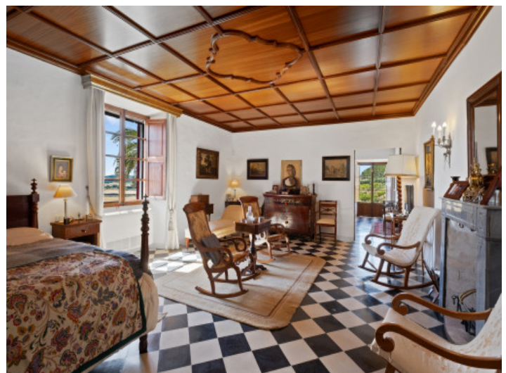
Noble Schlafzimmer Suite

Alle Angaben nach bestem Wissen. Irrtum und Zwischenverkauf vorbehalten. Dieses Exposé ist eine Vorinformation, als Rechtsgrundlage gilt allein der notariell abgeschlossene Kaufvertrag.