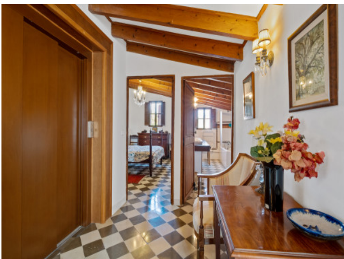
Flurbereich mit Blick zum Schlafzimmer