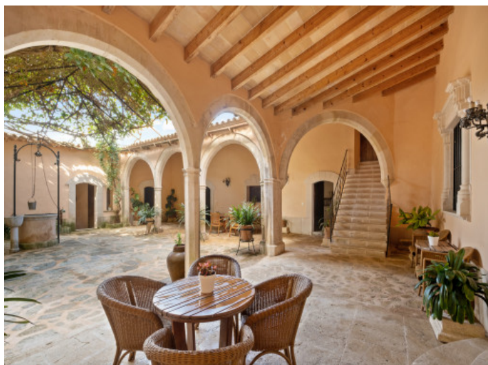
Gemütlicher, mediterraner Patio