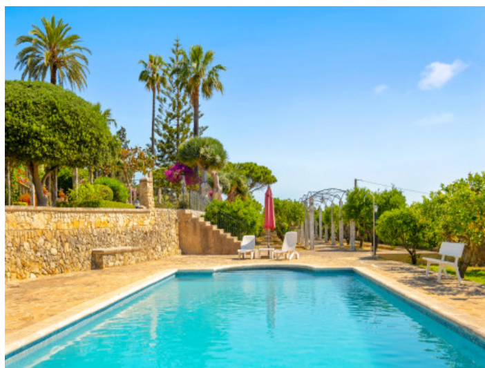
Schöner, großer Pool