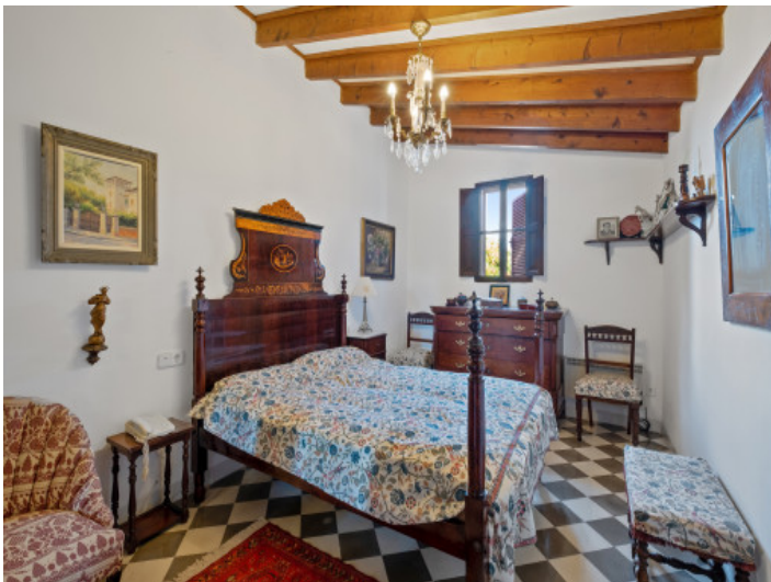
Eines von 11 Schlafzimmern