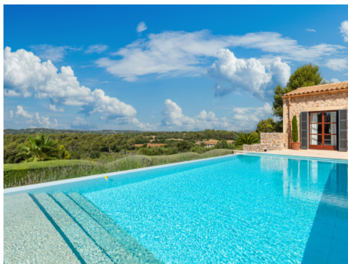
Infinitypool mit Weitblick