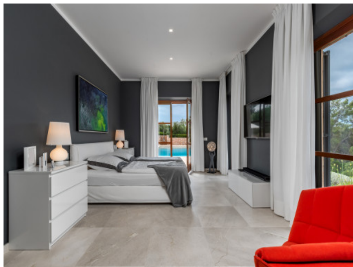
Eines von 5 Schlafzimmern