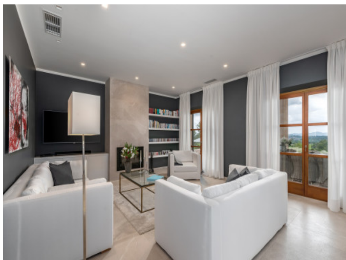
Wohnbereich mit Ausblick