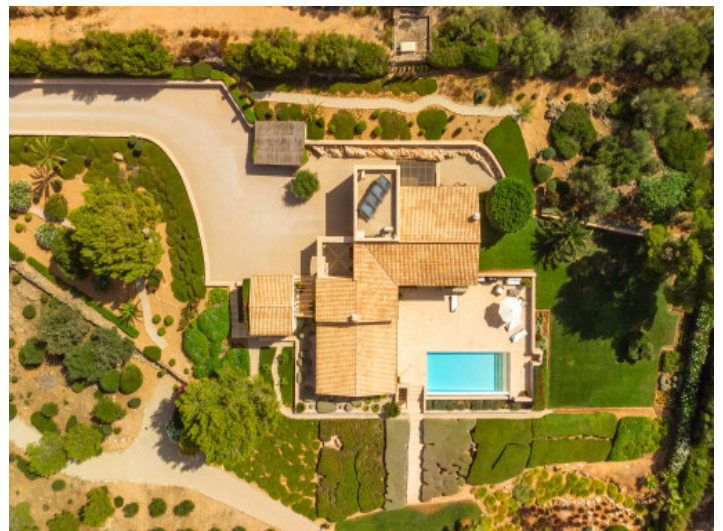
Blick aus der Vogelperspektive

Alle Angaben nach bestem Wissen. Irrtum und Zwischenverkauf vorbehalten. Dieses Exposé ist eine Vorinformation, als Rechtsgrundlage gilt allein der notariell abgeschlossene Kaufvertrag.