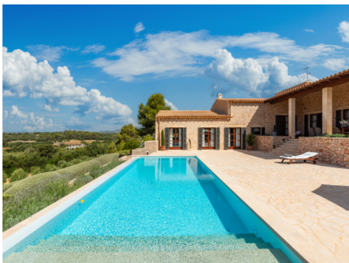
Großer fantastischer Poolbereich