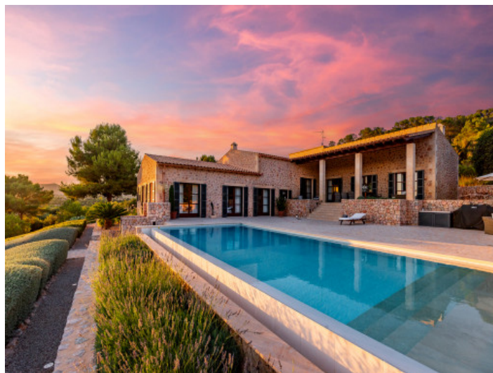
Finca und Pool bei Nacht