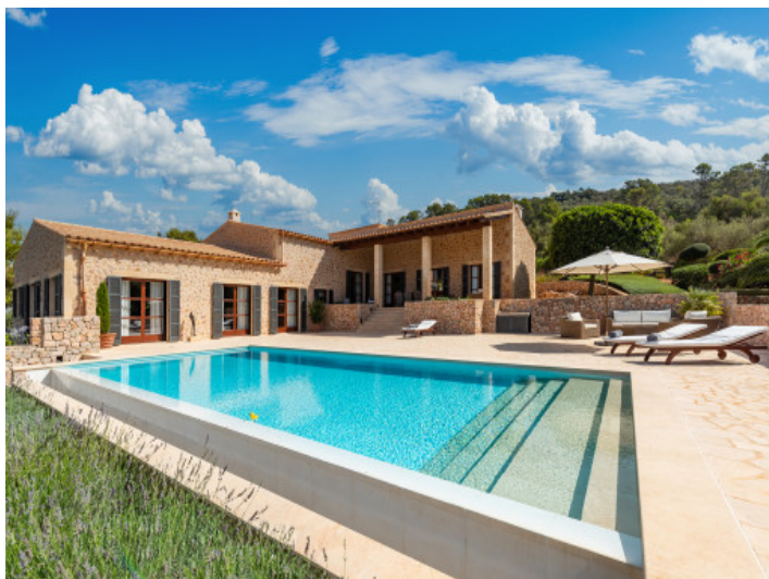
Finca mit traumhaften Poolbereich