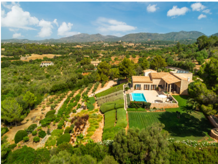
Finca und Umgebung