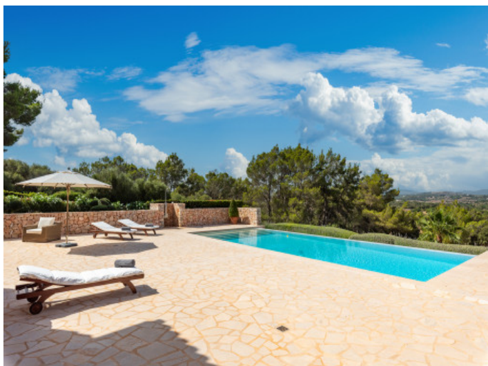
Schöner Poolbereich mit Landschaftsblick