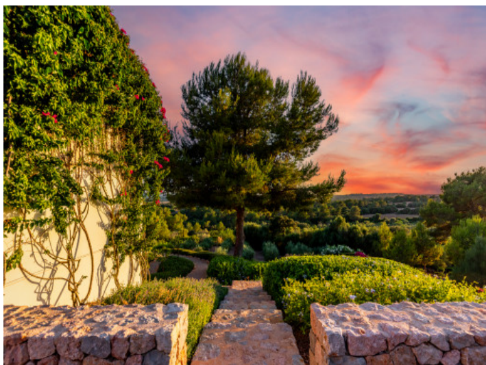
Garten am Abend