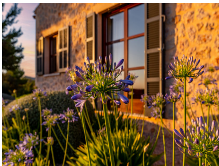
Garten am Abend