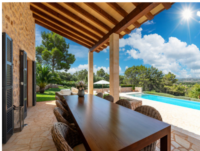
Essbereich mit Blick zum Pool

Alle Angaben nach bestem Wissen. Irrtum und Zwischenverkauf vorbehalten. Dieses Exposé ist eine Vorinformation, als Rechtsgrundlage gilt allein der notariell abgeschlossene Kaufvertrag.