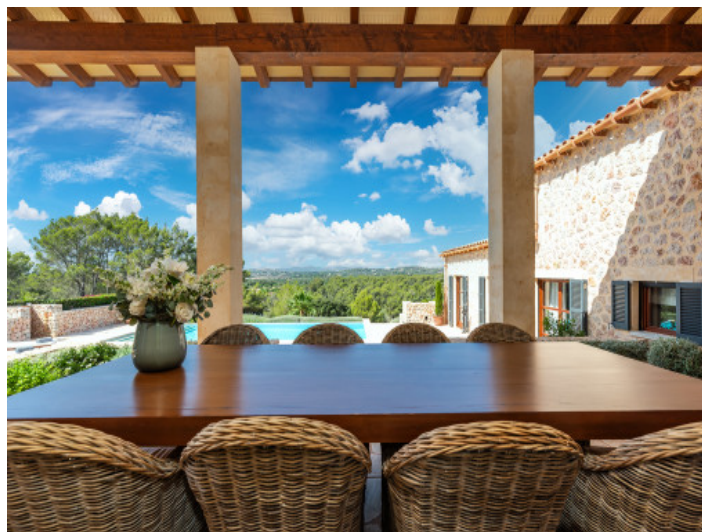
Essbereich im Freien mit Ausblick