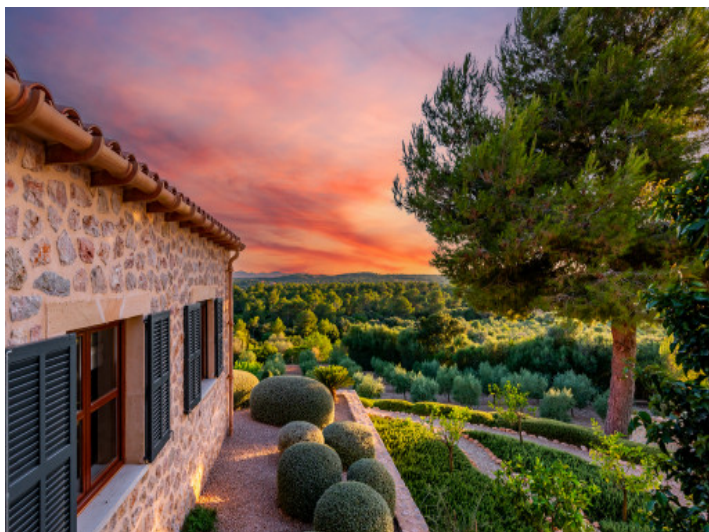
Garten am Abend