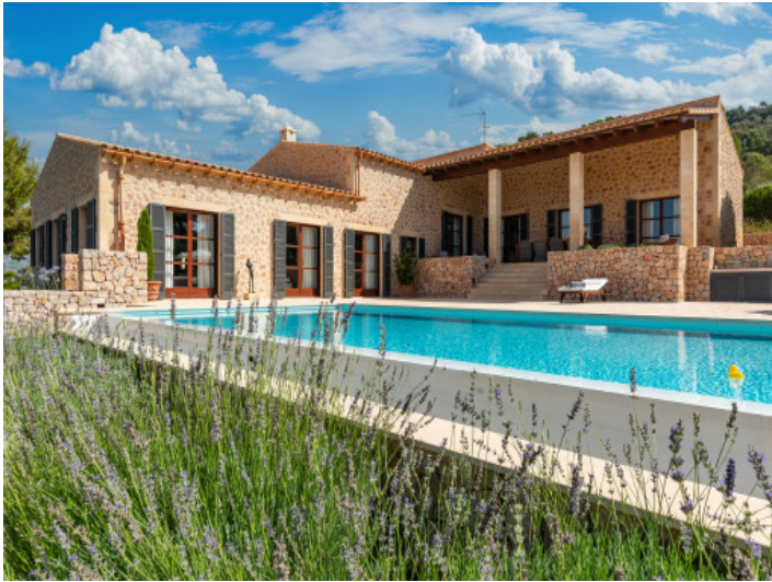
Finca und Pool