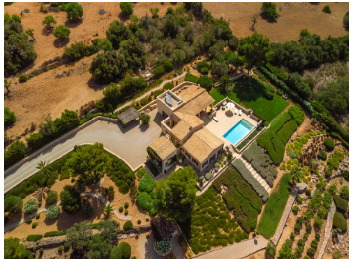
Blick von oben