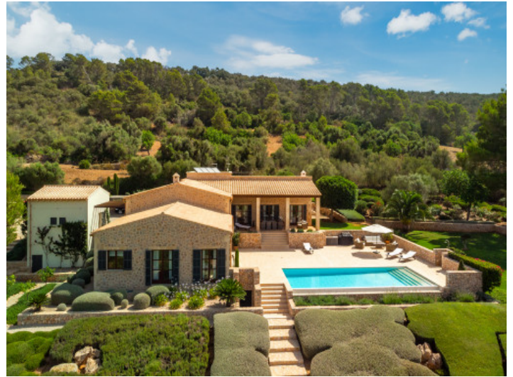
Blick von oben