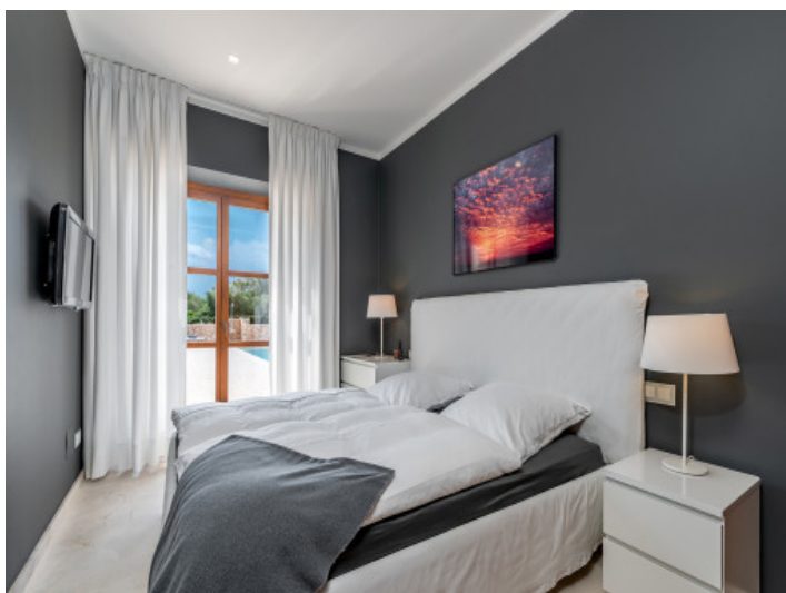
Eines von 5 Schlafzimmern