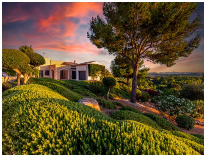
Garten am Abend