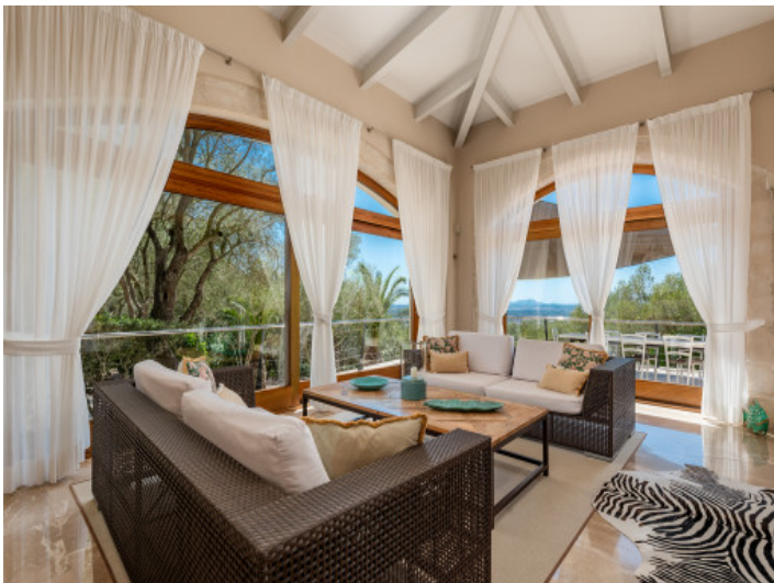
Zusätzlicher Wohnbereich mit Panoramafenstern