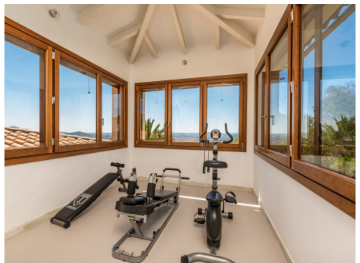
Fitnessraum mit Weitblick

Alle Angaben nach bestem Wissen. Irrtum und Zwischenverkauf vorbehalten. Dieses Exposé ist eine Vorinformation, als Rechtsgrundlage gilt allein der notariell abgeschlossene Kaufvertrag.