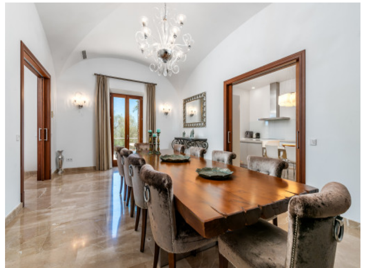
Geräumiger Essbereich mit hohen Decken