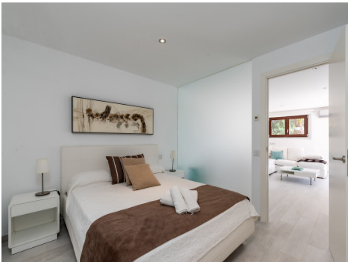
Modern gestaltetes Schlafzimmer