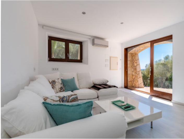
Wohnbereich mit Terrassenzugang