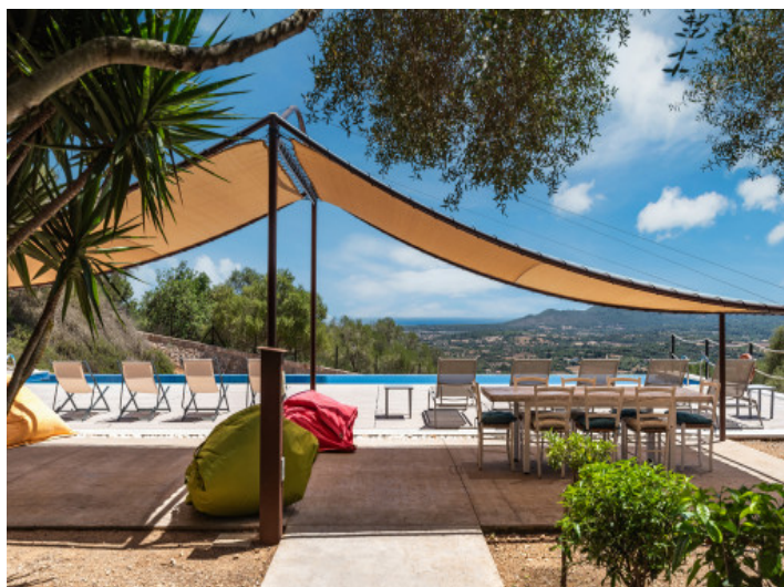
Entspannter Chill-out Poolbereich