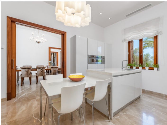
Komplett ausgestattete Küche