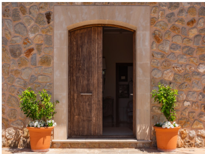
Eingang zur Finca