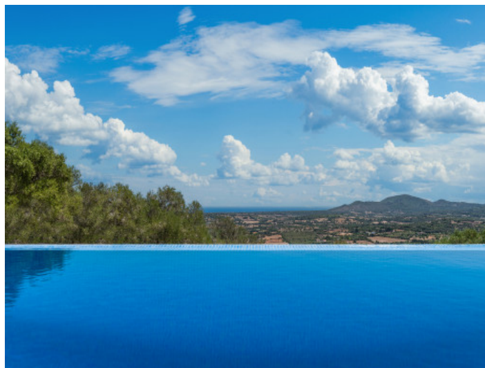
Infinitypool mit spektakulärer Aussicht