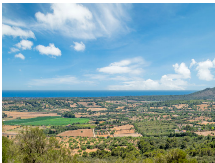
Weitblick bis zum Meer