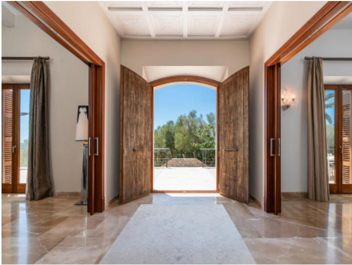
Schöne Eingangstür zur Finca