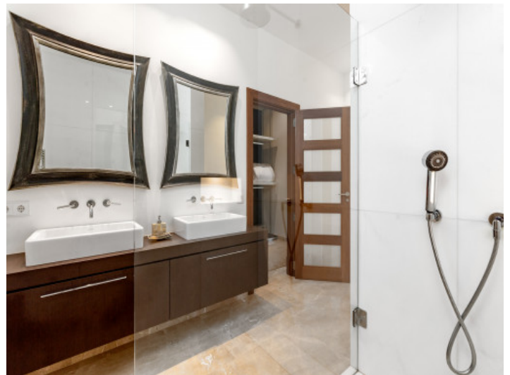
Badezimmer mit Doppelwaschbecken