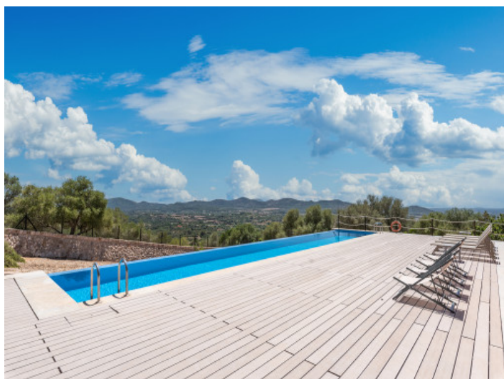
Poolbereich in beeindruckender Lage