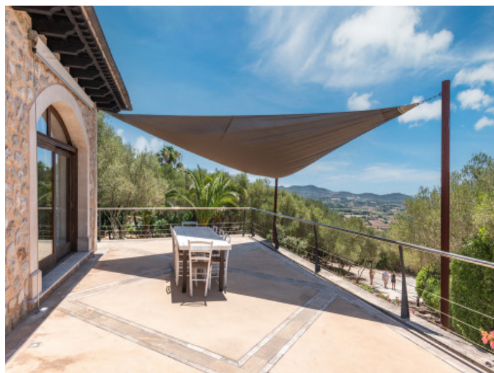
Terrasse mit Essbereich im Freien

Alle Angaben nach bestem Wissen. Irrtum und Zwischenverkauf vorbehalten. Dieses Exposé ist eine Vorinformation, als Rechtsgrundlage gilt allein der notariell abgeschlossene Kaufvertrag.