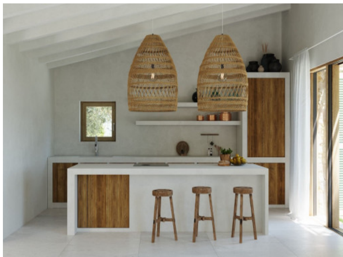
Küche mit Kochinsel