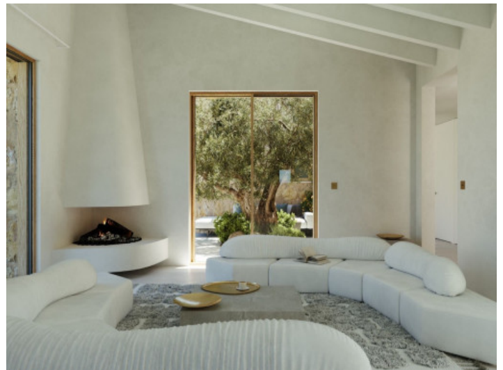
Geräumiger Wohnbereich mit Kamin