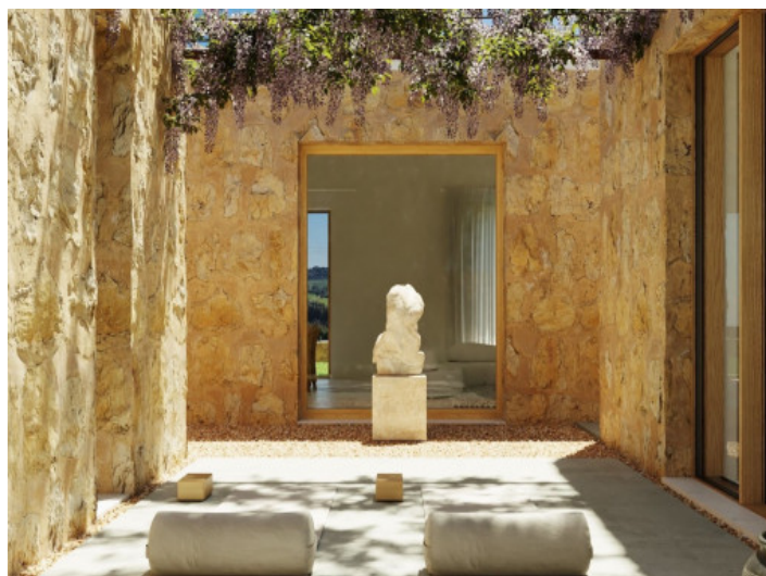
Patio mit viel Privatsphäre

Alle Angaben nach bestem Wissen. Irrtum und Zwischenverkauf vorbehalten. Dieses Exposé ist eine Vorinformation, als Rechtsgrundlage gilt allein der notariell abgeschlossene Kaufvertrag.