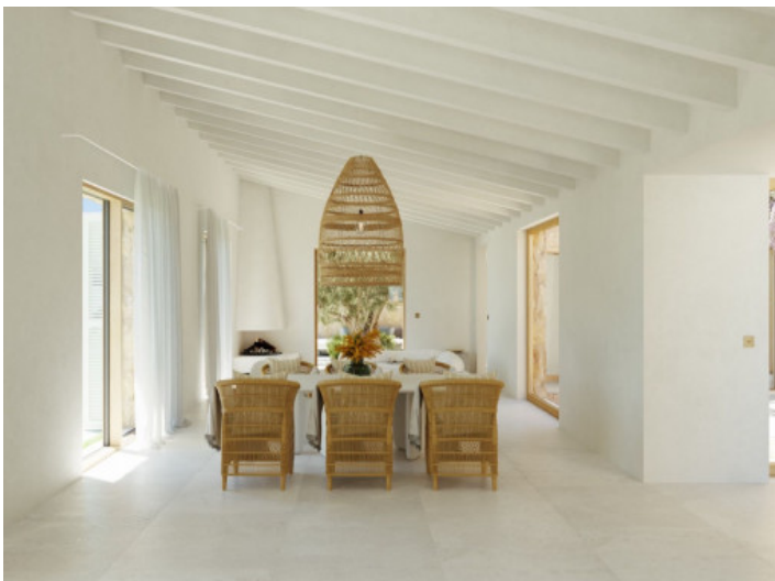
Essbereich mit sichtbaren Deckenbalken