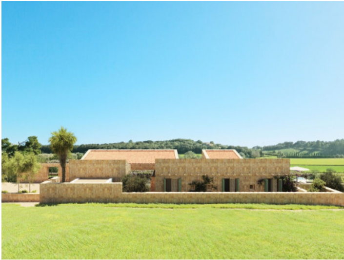
Finca mit Natursteinfassade