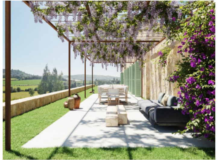
Wunderschöne weitläufige Terrasse