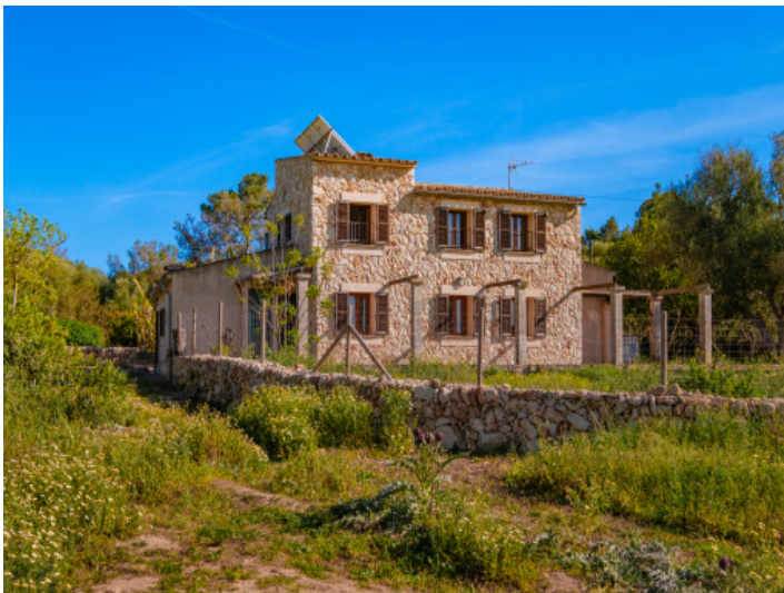
Ansicht auf die schöne Finca