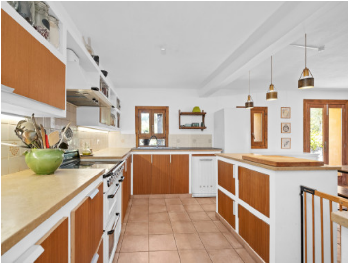
Küche im Landhausstil