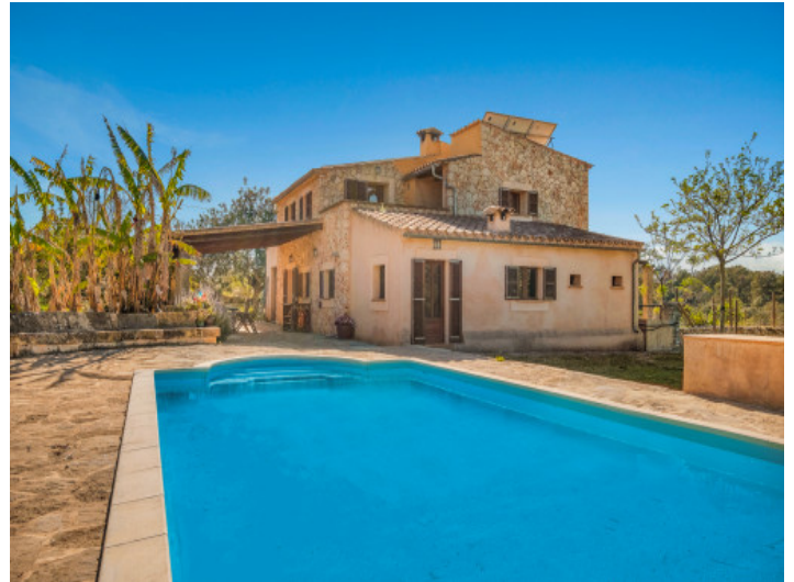
Gartenansicht auf das Haus