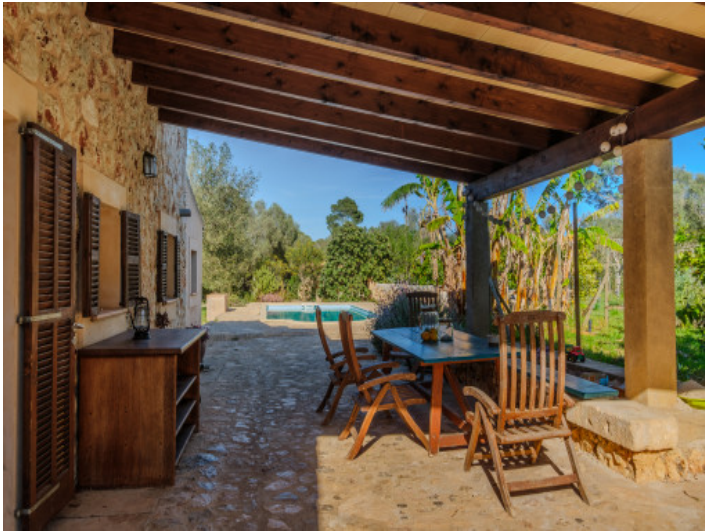
Große überdachte Terrasse