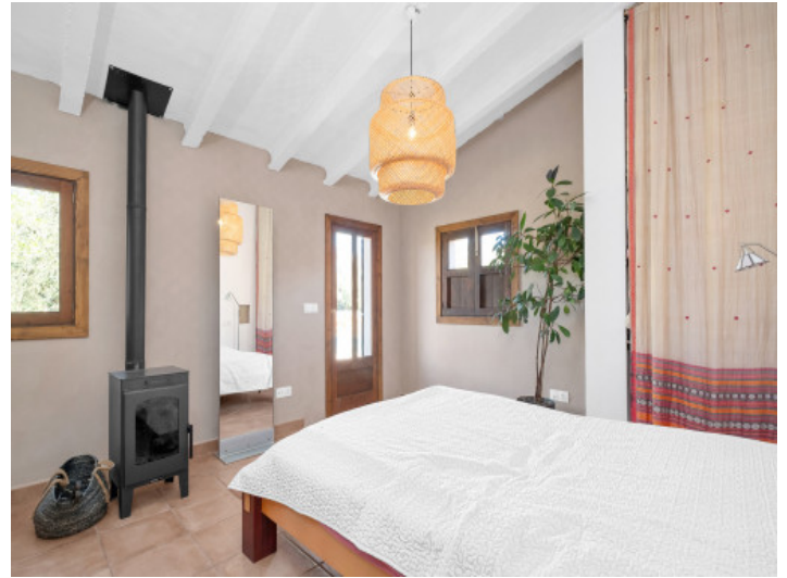
Schlafzimmer mit Holzofen