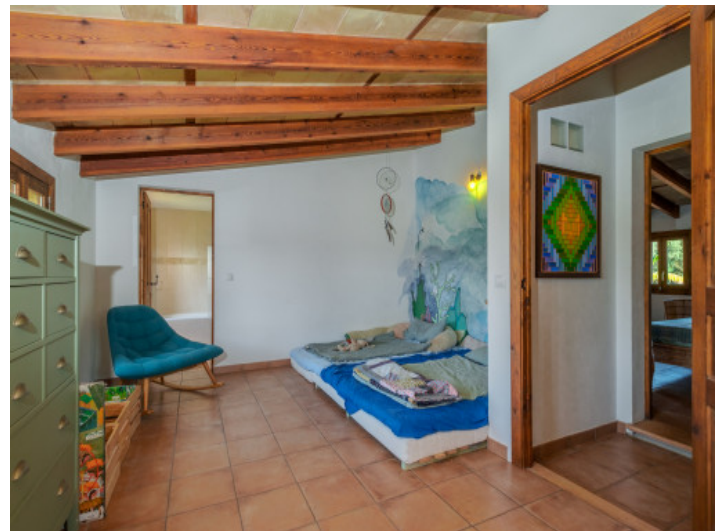
Schlafzimmer mit Bad en Suite