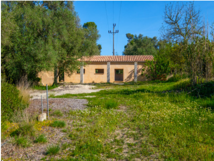
Ansicht auf das Nebengebäude