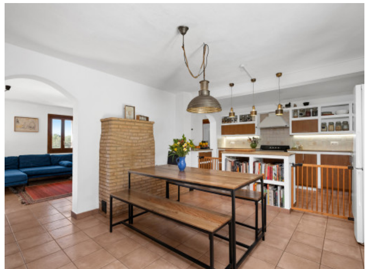
Essbereich bei der Küche

Alle Angaben nach bestem Wissen. Irrtum und Zwischenverkauf vorbehalten. Dieses Exposé ist eine Vorinformation, als Rechtsgrundlage gilt allein der notariell abgeschlossene Kaufvertrag.