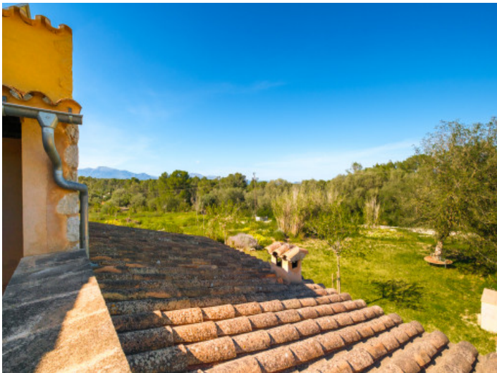
Ausicht von der 1. Etage