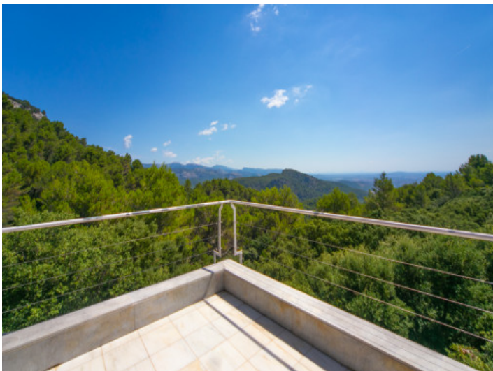
Herrliche Terrasse mit Bergblick