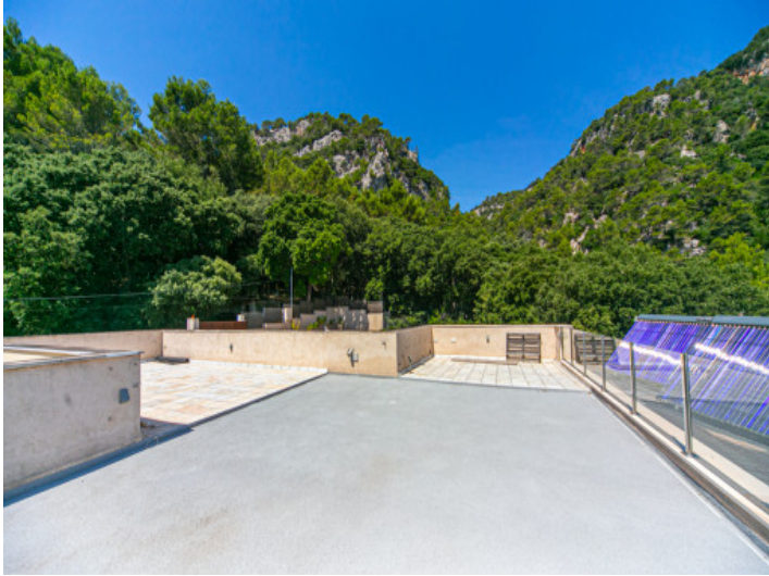
Terrasse mit Bergen im Hintergrund