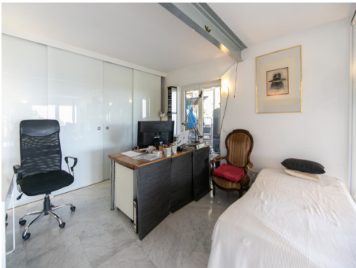
Schlafzimmer und Büro