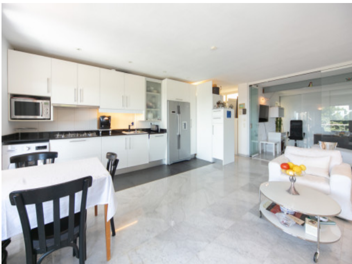
Offene gestalteter Wohn-/Essbereich mit Küche