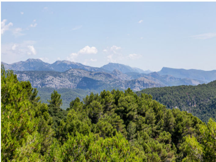
Fantastischer Blick über das Tramuntanagebirge