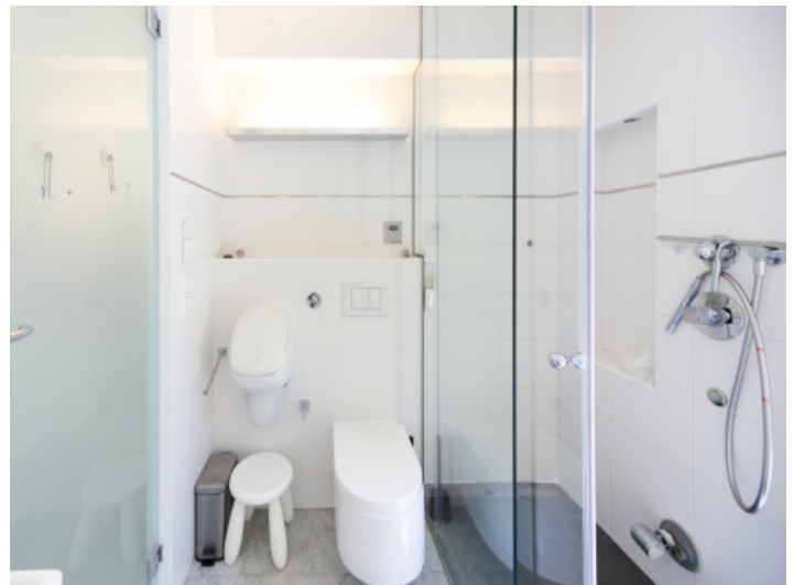
Eines von 2 Badezimmer