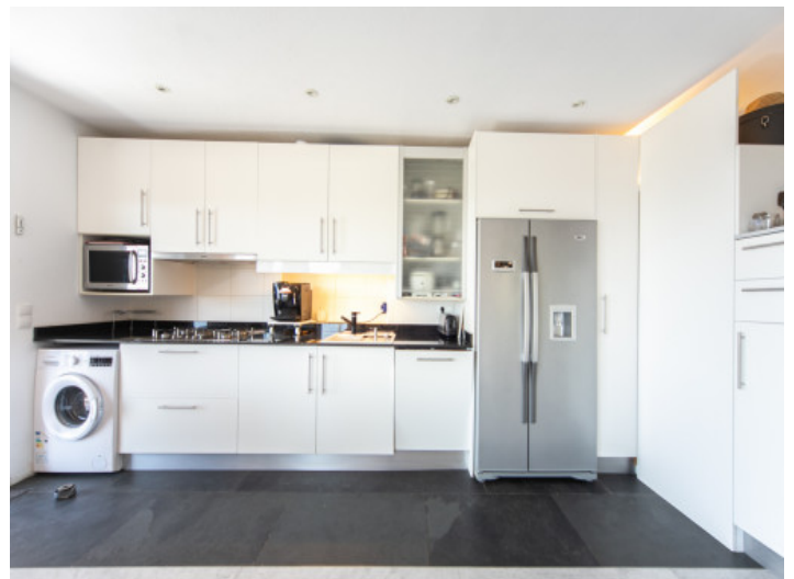
Moderne, voll ausgestattete Küche

Alle Angaben nach bestem Wissen. Irrtum und Zwischenverkauf vorbehalten. Dieses Exposé ist eine Vorinformation, als Rechtsgrundlage gilt allein der notariell abgeschlossene Kaufvertrag.