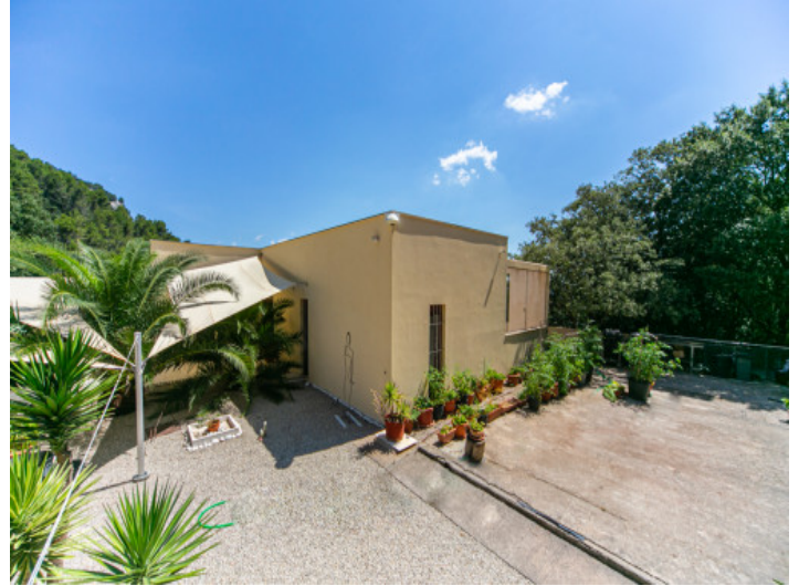
Außenansicht und Außenbereich