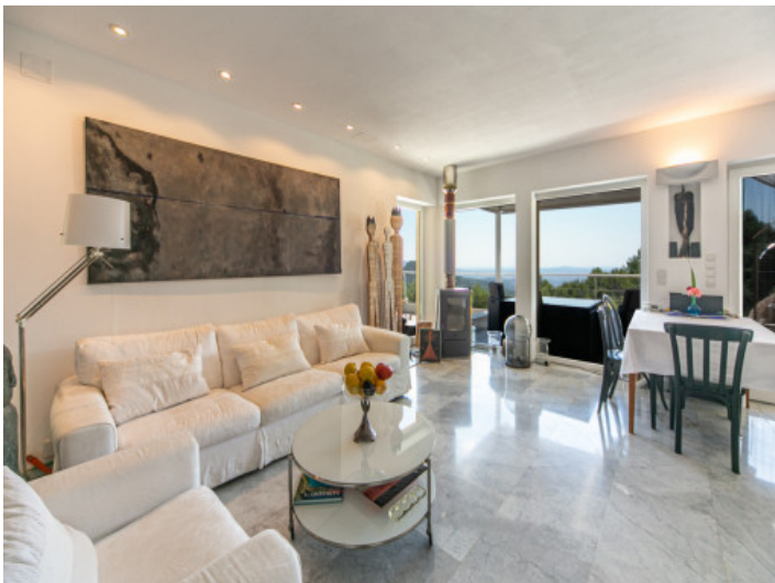
Wohn-und Essbereich mit Terrassenzugang