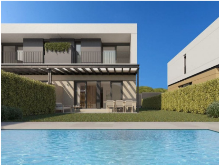
Blick vom Pool