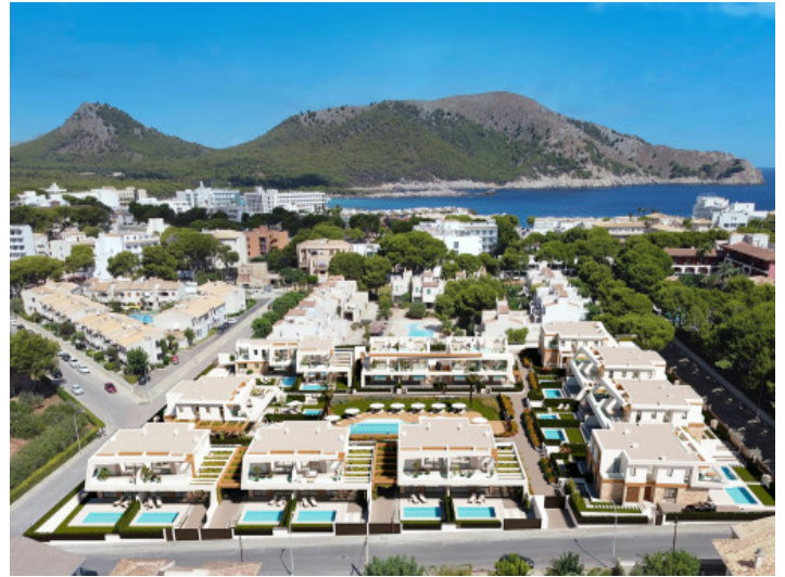
Umgebung der Wohnanlage

Alle Angaben nach bestem Wissen. Irrtum und Zwischenverkauf vorbehalten. Dieses Exposé ist eine Vorinformation, als Rechtsgrundlage gilt allein der notariell abgeschlossene Kaufvertrag.