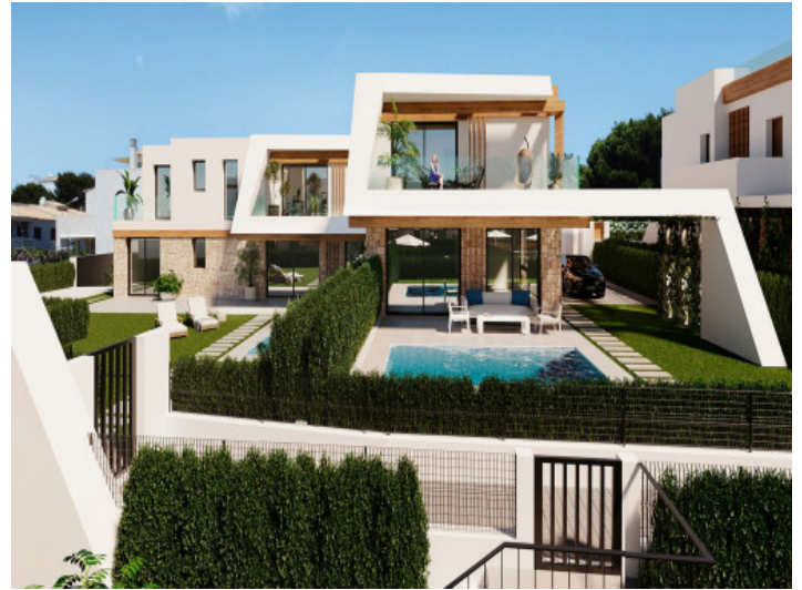
Villa mit Pool