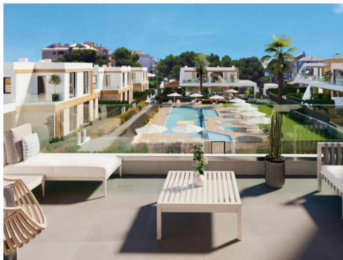
Balkon mit Chill-Out Bereich