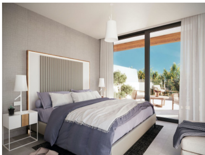
Weiteres Schlafzimmer mit Terrasse