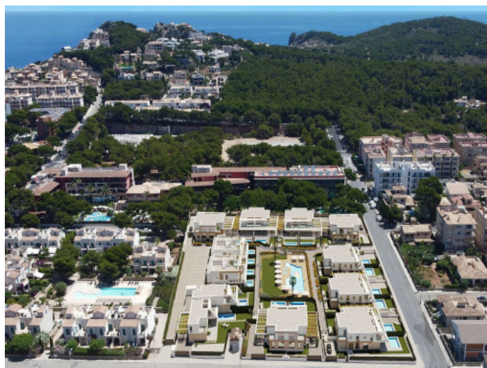
Umgebung der Wohnanlage

Alle Angaben nach bestem Wissen. Irrtum und Zwischenverkauf vorbehalten. Dieses Exposé ist eine Vorinformation, als Rechtsgrundlage gilt allein der notariell abgeschlossene Kaufvertrag.