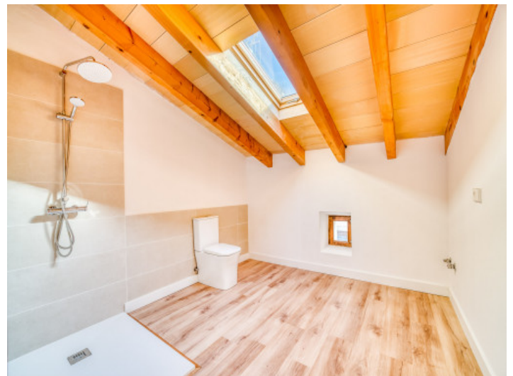
Badezimmer mit Dusche und Tageslicht

Alle Angaben nach bestem Wissen. Irrtum und Zwischenverkauf vorbehalten. Dieses Exposé ist eine Vorinformation, als Rechtsgrundlage gilt allein der notariell abgeschlossene Kaufvertrag.