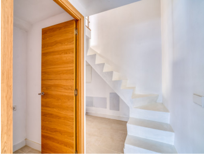
Treppe führt in die obere Etage