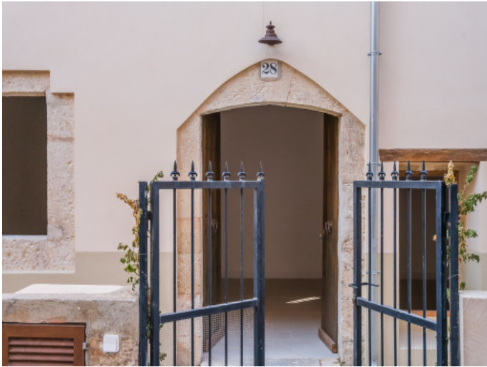
Eingang zum Stadthaus