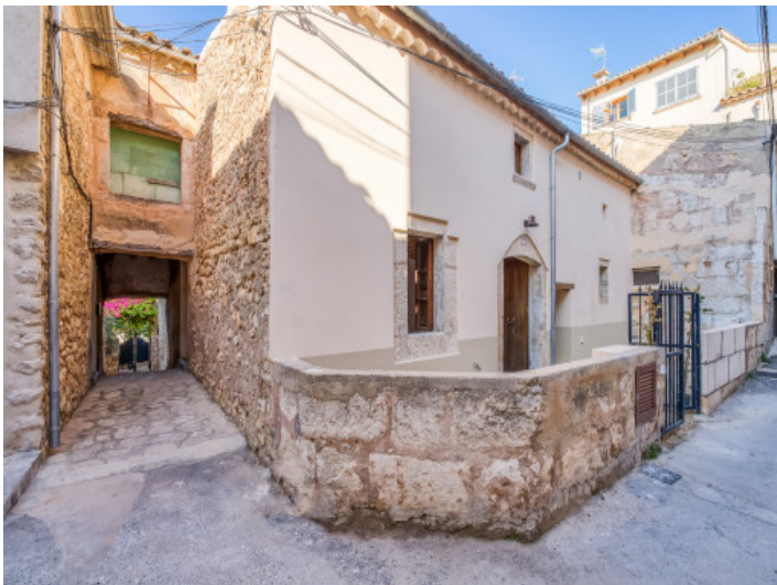
Blick von der Straße zum Stadthaus

Alle Angaben nach bestem Wissen. Irrtum und Zwischenverkauf vorbehalten. Dieses Exposé ist eine Vorinformation, als Rechtsgrundlage gilt allein der notariell abgeschlossene Kaufvertrag.