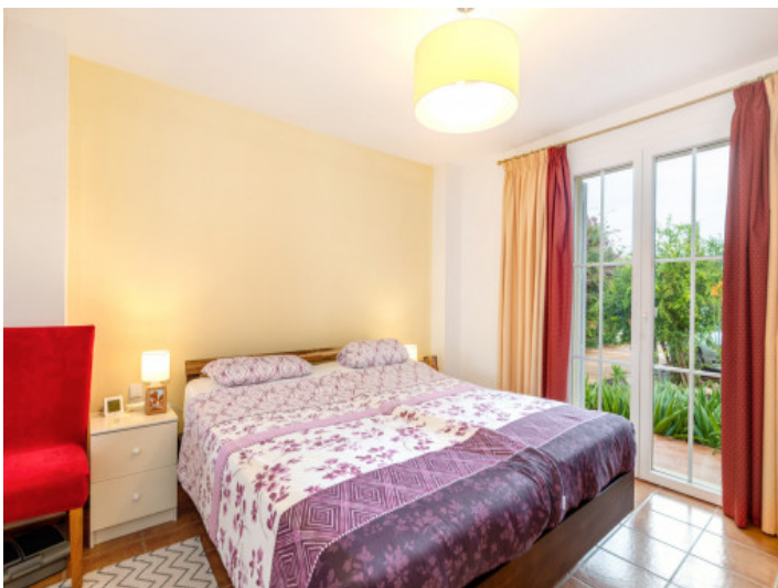
Schlafzimmer mit bodentiefen Fenstern