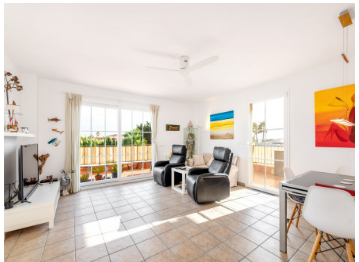
Lichtdurchfluteter Wohnbereich in der oberen Etage

Alle Angaben nach bestem Wissen. Irrtum und Zwischenverkauf vorbehalten. Dieses Exposé ist eine Vorinformation, als Rechtsgrundlage gilt allein der notariell abgeschlossene Kaufvertrag.