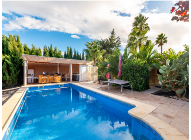
Blick vom Pool auf die Sommerküche