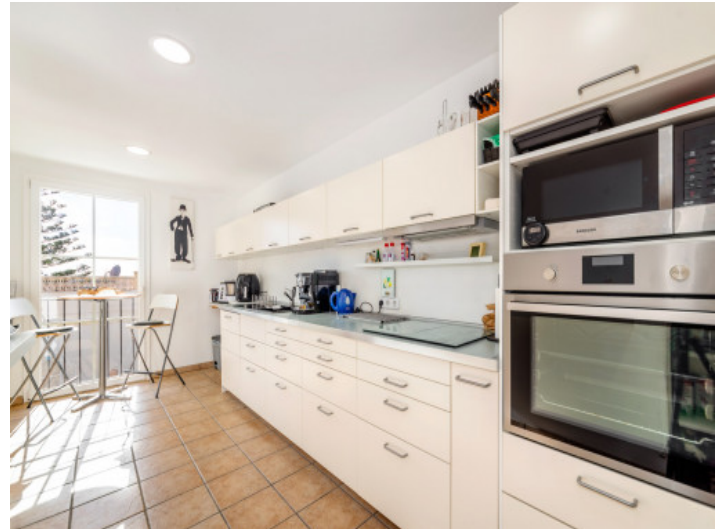
Küche in der oberen Etage