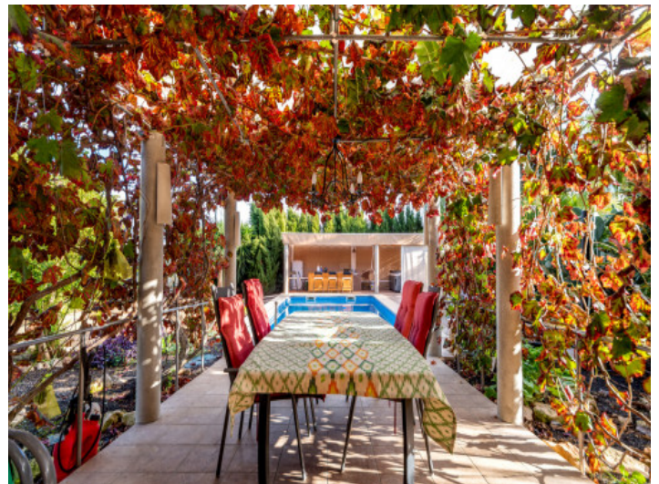
Idyllischer Essbereich im Garten