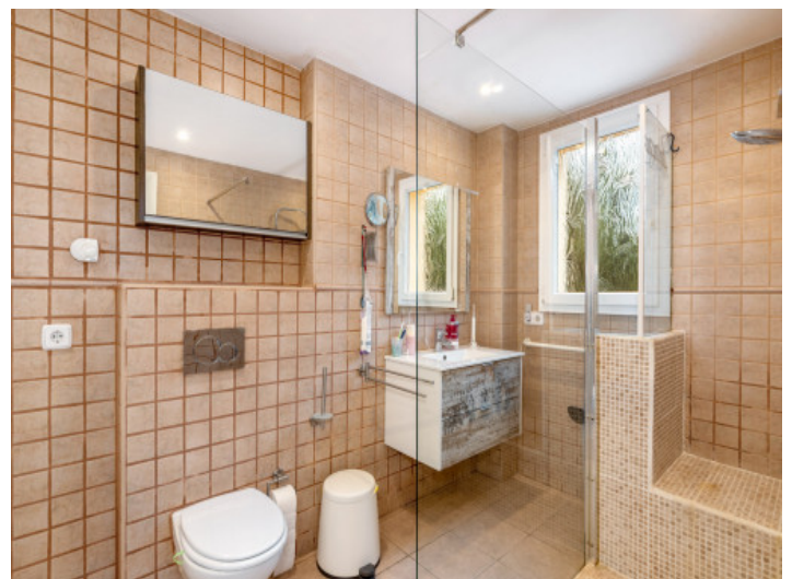
Badezimmer mit Tageslicht

Alle Angaben nach bestem Wissen. Irrtum und Zwischenverkauf vorbehalten. Dieses Exposé ist eine Vorinformation, als Rechtsgrundlage gilt allein der notariell abgeschlossene Kaufvertrag.