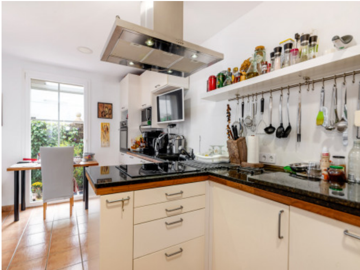
Voll ausgestattete Küche im Erdgeschoss