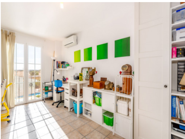
Büro oder Kinderzimmer