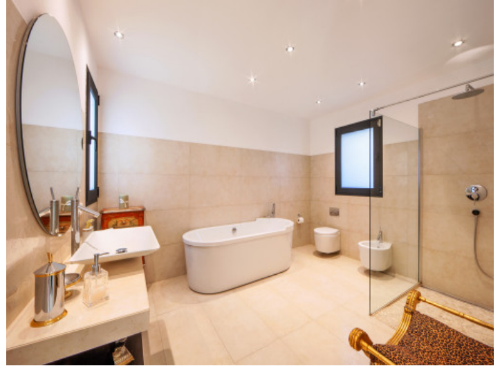
Badezimmer mit Badewanne und Dusche