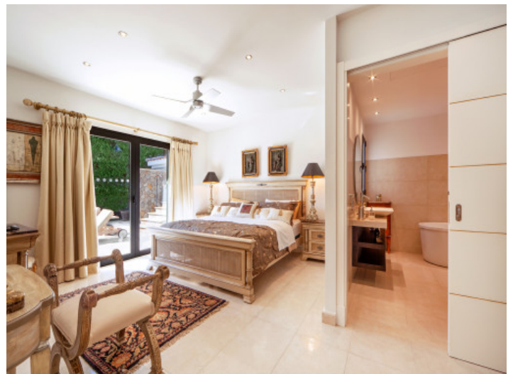
Schlafzimmer mit Badezimmer en Suite

Alle Angaben nach bestem Wissen. Irrtum und Zwischenverkauf vorbehalten. Dieses Exposé ist eine Vorinformation, als Rechtsgrundlage gilt allein der notariell abgeschlossene Kaufvertrag.