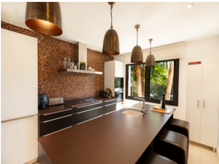
Küche mit Bar