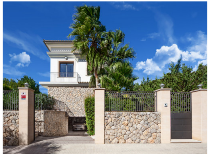
Blick von der Straße zur Villa