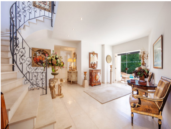
Eingangsbereich der Villa