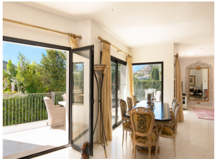
Essbereich mit Balkonzugang