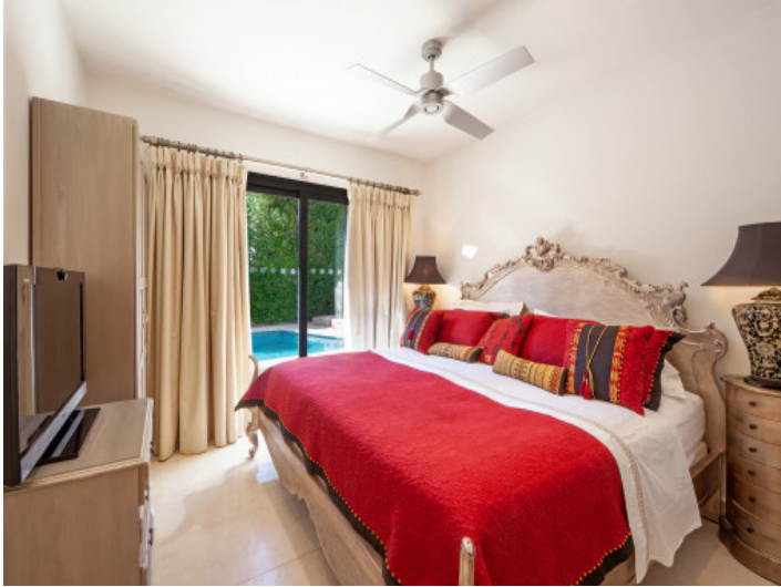
Schlafzimmer mit Doppelbett und Poolblick