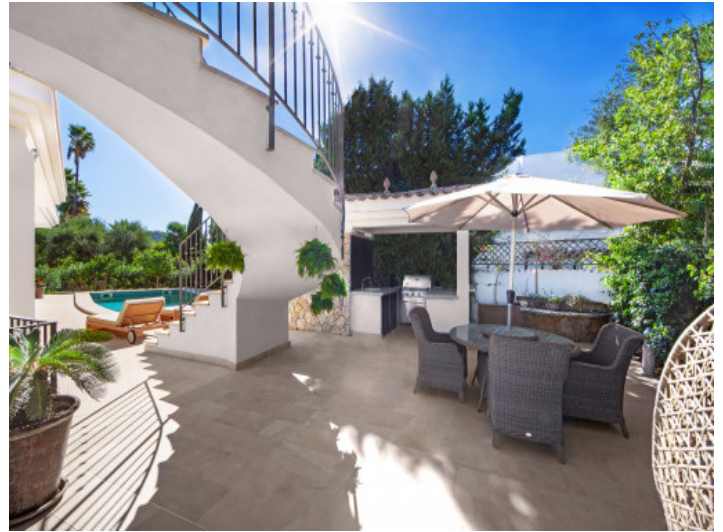
Herrliche Terrasse mit Sommerküche