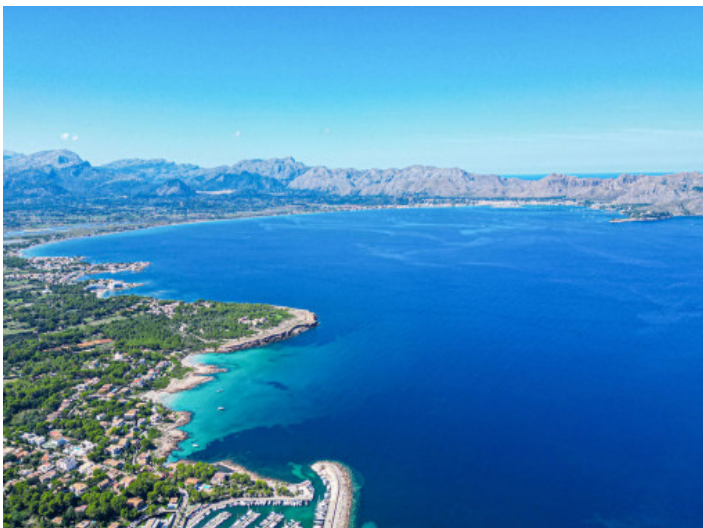
Der Sporthafen von Boniare

Alle Angaben nach bestem Wissen. Irrtum und Zwischenverkauf vorbehalten. Dieses Exposé ist eine Vorinformation, als Rechtsgrundlage gilt allein der notariell abgeschlossene Kaufvertrag.