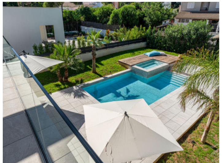
Der Pool eingebettet in einem gepflegten Garten

Alle Angaben nach bestem Wissen. Irrtum und Zwischenverkauf vorbehalten. Dieses Exposé ist eine Vorinformation, als Rechtsgrundlage gilt allein der notariell abgeschlossene Kaufvertrag.