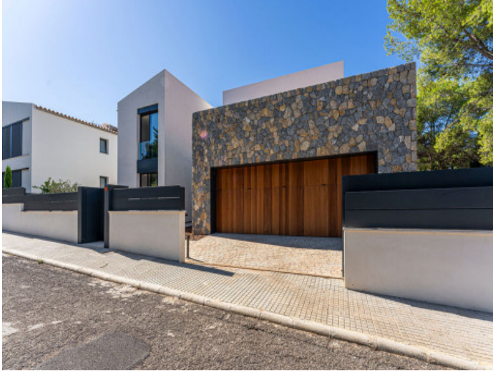
Straßenansicht der modernen Villa