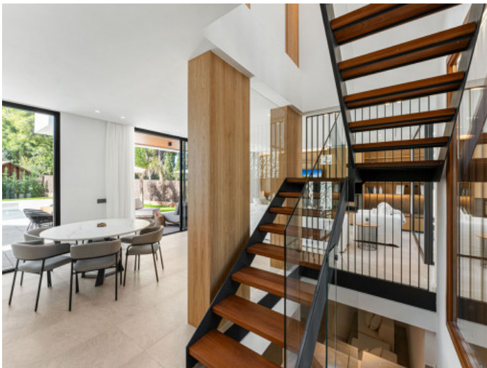
Luftige Treppe im Wohnbereich