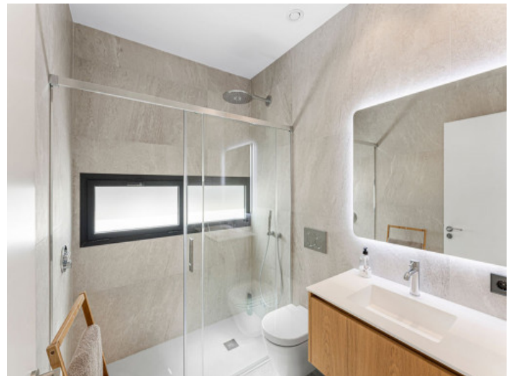
Voll ausgestattetes Badezimmer