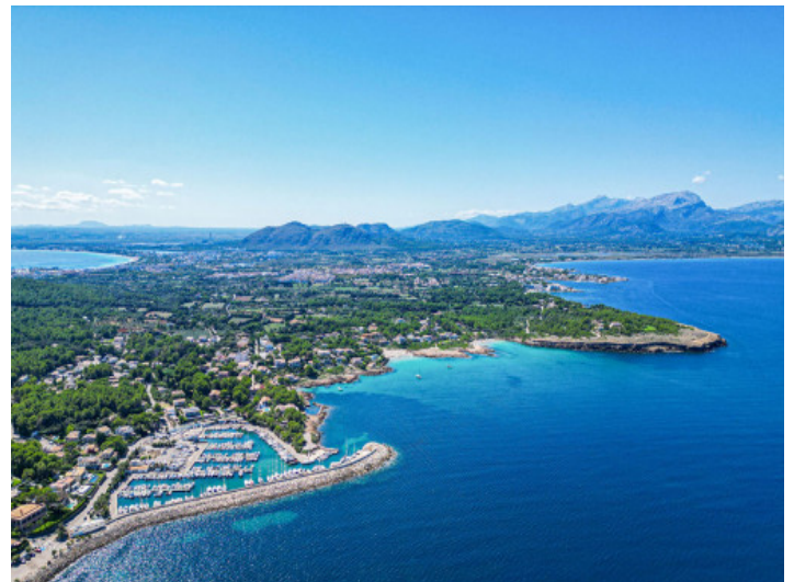
Die Bucht von Pollens