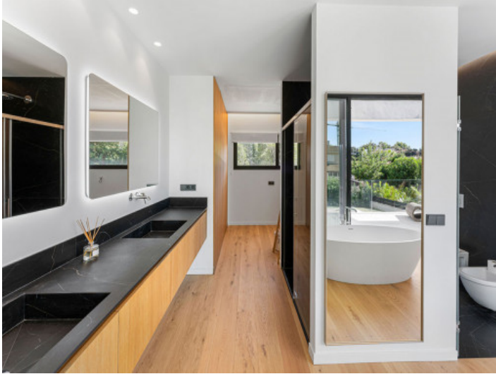
Badezimmer des Hauptschlafzimmers