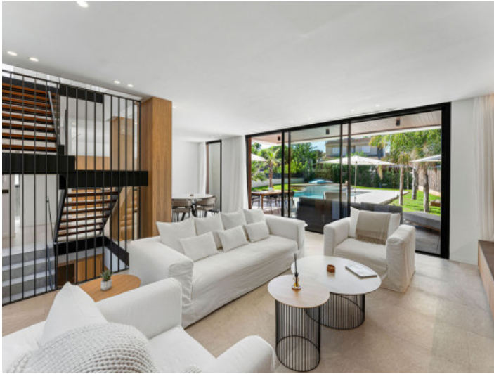
Wohn-Essbereich mit Terrassenzugang