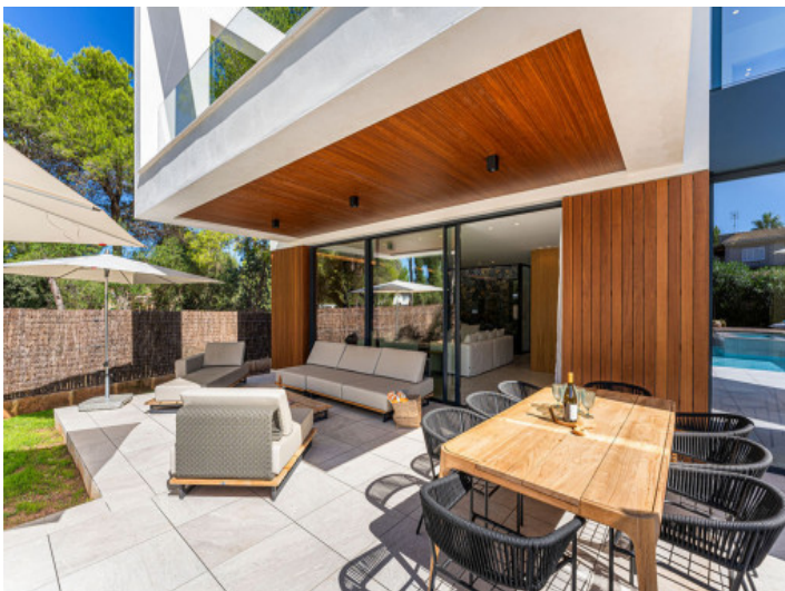
Direkter Zugang vom Wohnzimmer auf die Terrasse