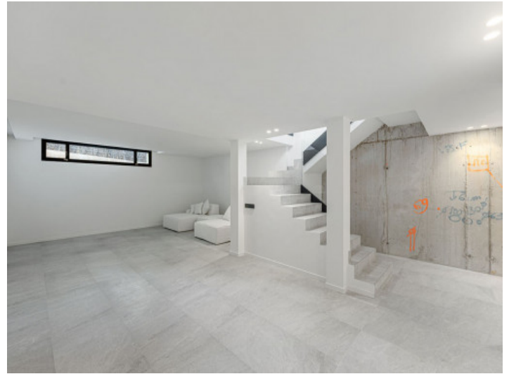
Kellergeschoss mit universellen Nutzungsmöglichkeiten