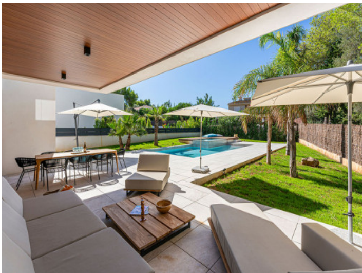
Zugang von der Terrasse in den Garten