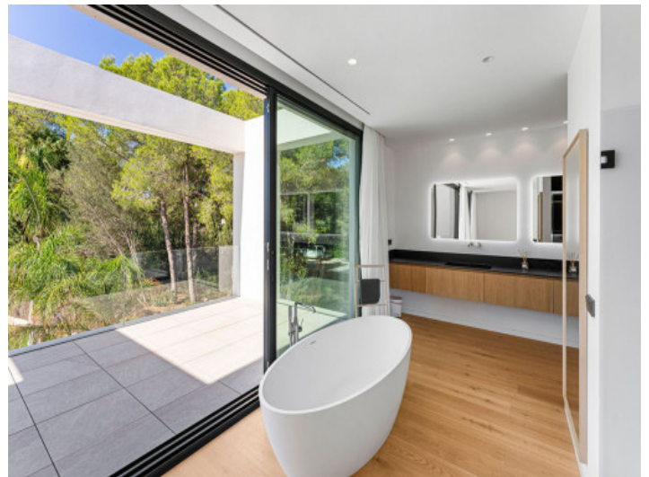
Freistehende Badewanne des Hauptschlafzimmers