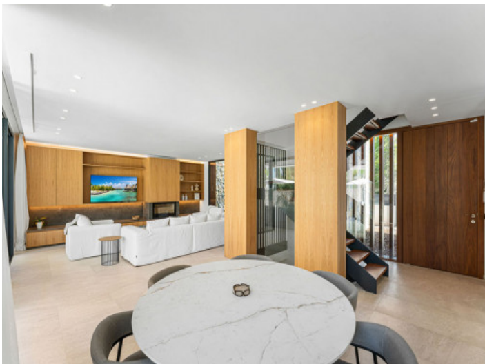
Essbereich und offene Küche im Hintergrund