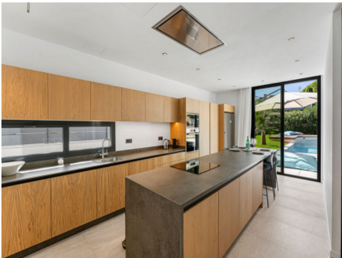
Komplett eingerichtete Küche