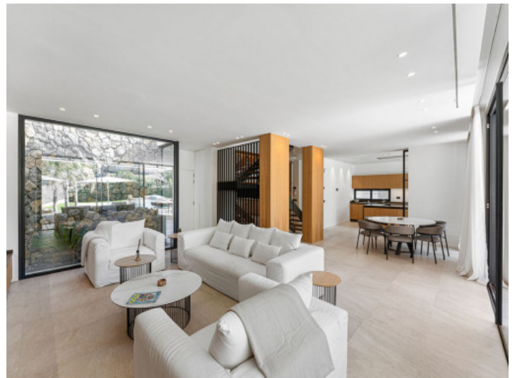
Der stylische Wohnbereich