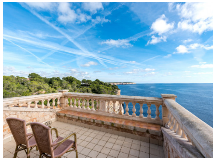
Traumhafte Dachterrasse mit Meerblick

Alle Angaben nach bestem Wissen. Irrtum und Zwischenverkauf vorbehalten. Dieses Exposé ist eine Vorinformation, als Rechtsgrundlage gilt allein der notariell abgeschlossene Kaufvertrag.