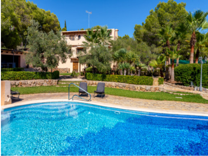
Pool mit Blick zur Finca