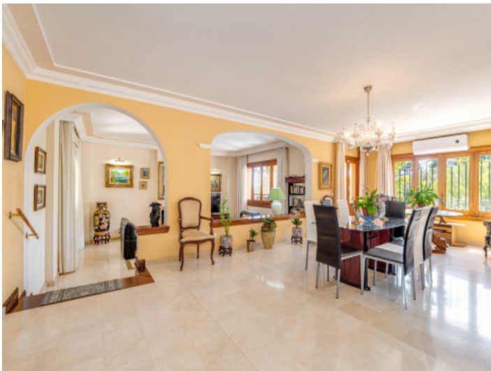
Essbereich mit Blick zum Wohnbereich