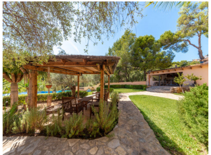
Garten mit überdachter Terrasse und Poolblick