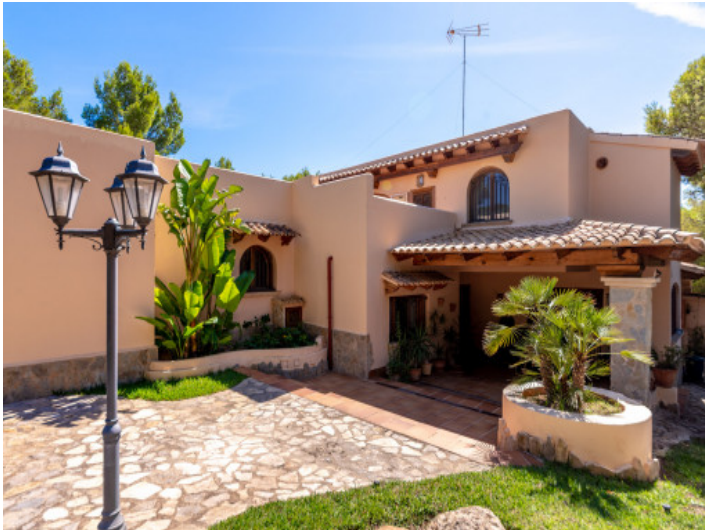
Frontansicht der Finca