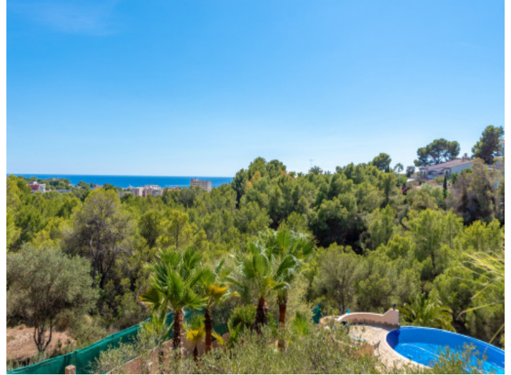
Meerblick vom Balkon aus