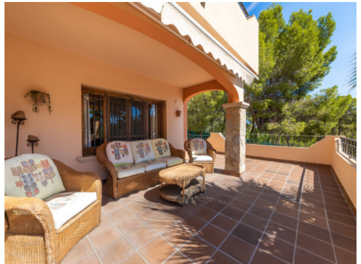
Überdachte Terrasse mit Loungebereich

Alle Angaben nach bestem Wissen. Irrtum und Zwischenverkauf vorbehalten. Dieses Exposé ist eine Vorinformation, als Rechtsgrundlage gilt allein der notariell abgeschlossene Kaufvertrag.