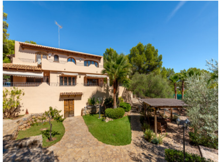
Blick vom Garten zur Finca