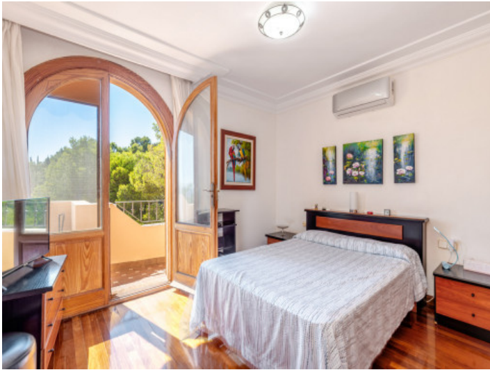
Schlafzimmer mit Balkonzugang