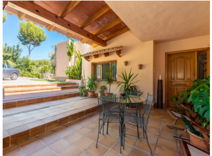
Vordere Terrasse am Eingangsbereich