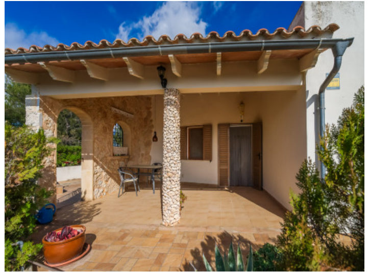
Terrasse und Eingang