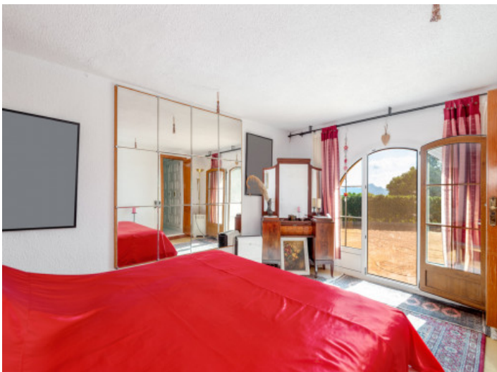
Schlafzimmer mit Terrassenzugang