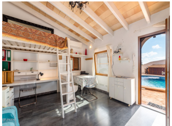
Studio mit Poolzugang

Alle Angaben nach bestem Wissen. Irrtum und Zwischenverkauf vorbehalten. Dieses Exposé ist eine Vorinformation, als Rechtsgrundlage gilt allein der notariell abgeschlossene Kaufvertrag.