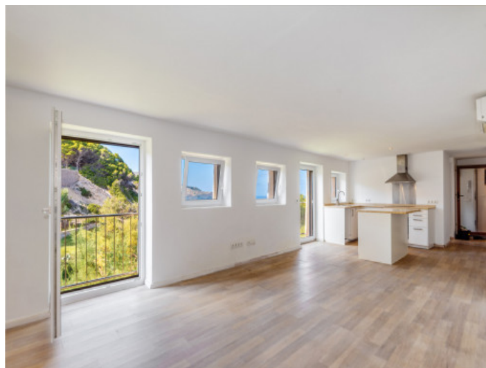
Apartment mit Küche