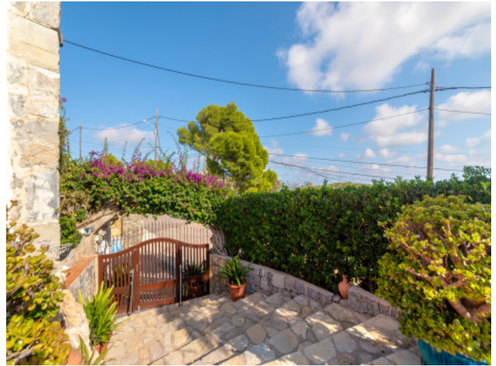
Eingang zur Villa