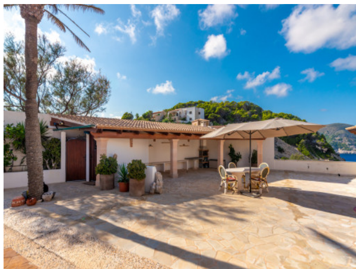
Terrasse mit Blick auf das Mittelmeer

Alle Angaben nach bestem Wissen. Irrtum und Zwischenverkauf vorbehalten. Dieses Exposé ist eine Vorinformation, als Rechtsgrundlage gilt allein der notariell abgeschlossene Kaufvertrag.