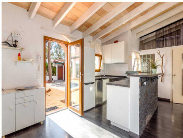
Küche 2 mit Bar