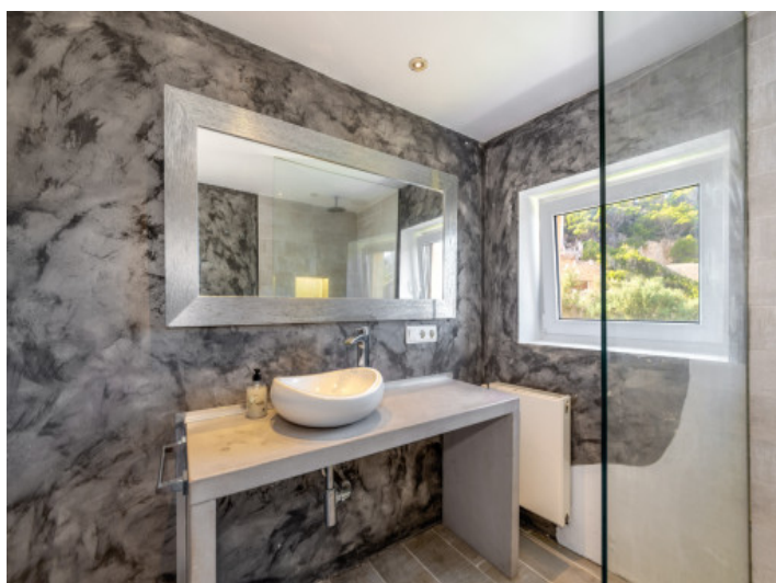
Badezimmer mit Tageslicht