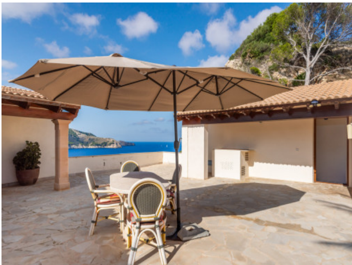
Terrasse mit Blick auf das Mittelmeer