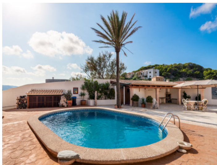
Der Poolbereich ist von einer Terrasse umgeben