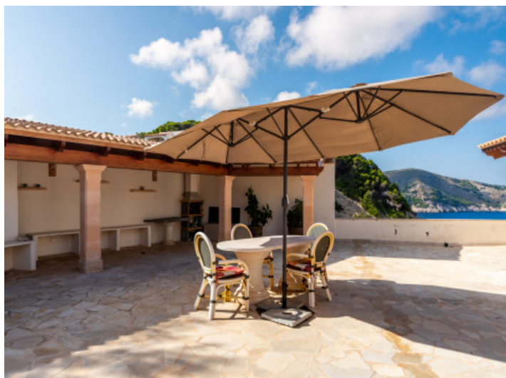
Terrasse mit Sommerküche