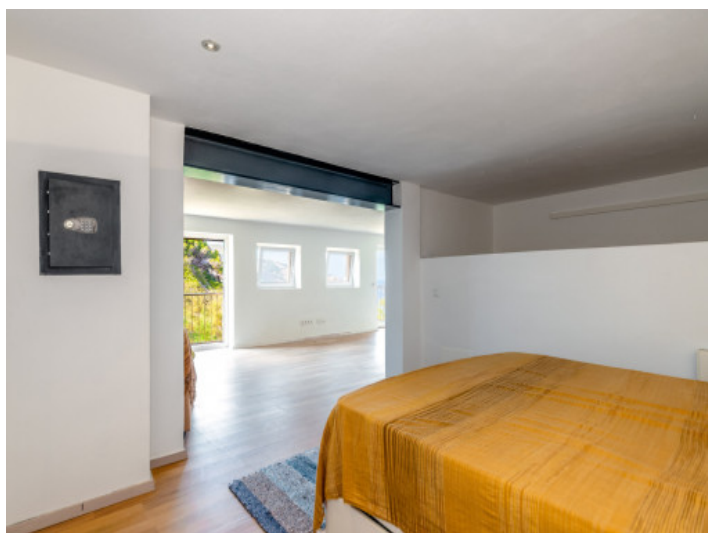
Apartment mit Schlafzimmer