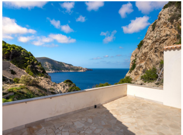
Meerblick von der Terrasse aus