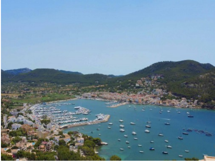
Fantastischer Blick auf Port Andratx