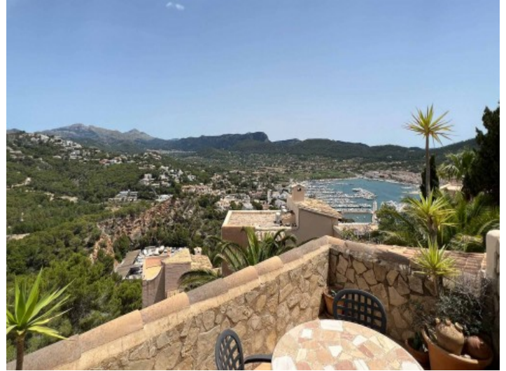
Meer- und Bergblick