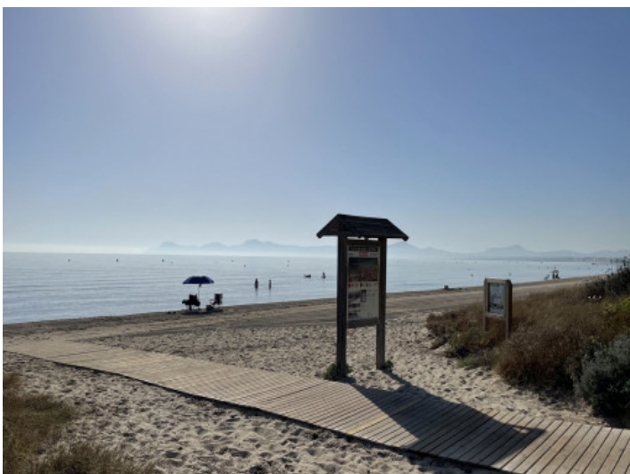
Playa de Muro