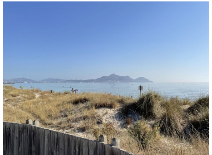
Playa de Muro