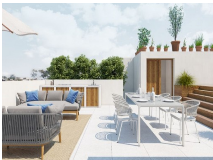
Lounge Terrasse und Essbereich