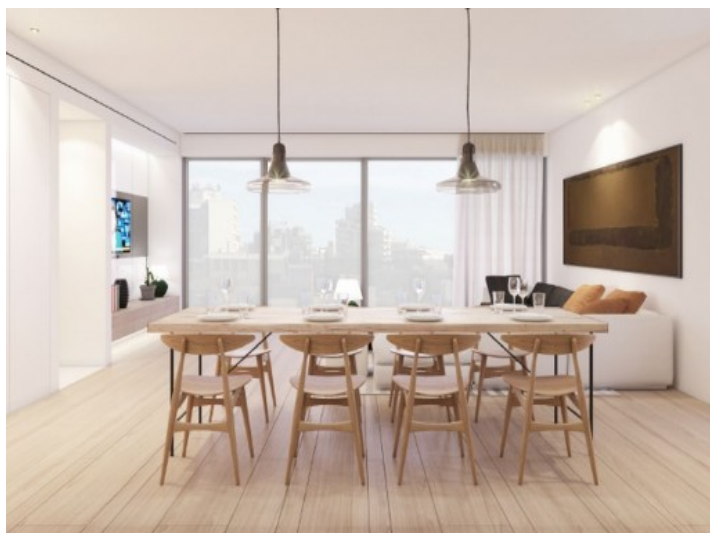
Wohn- und Essbereich