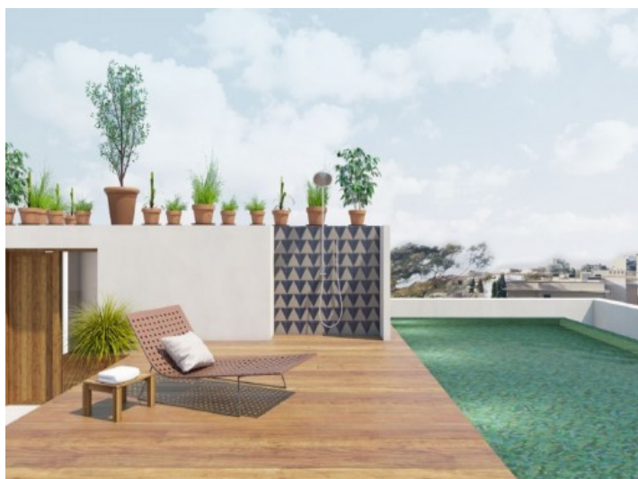
Pool und Sonnenterrasse