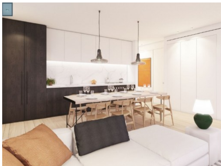
Wohn- und Essbereich

Alle Angaben nach bestem Wissen. Irrtum und Zwischenverkauf vorbehalten. Dieses Exposé ist eine Vorinformation, als Rechtsgrundlage gilt allein der notariell abgeschlossene Kaufvertrag.