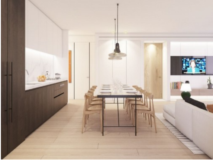
Essbereich und Küche