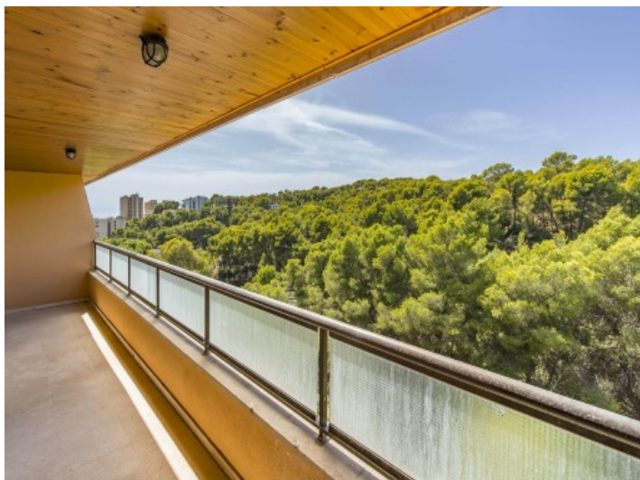
Balkon mit Ausblick in Grüne