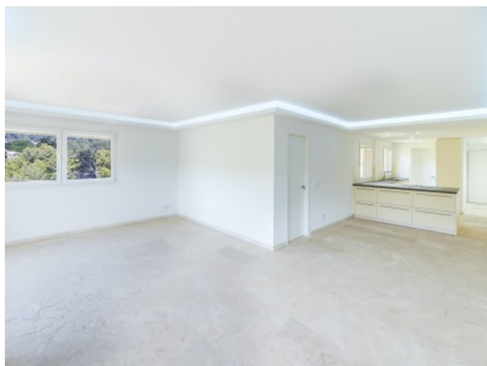
Blick zur Küche