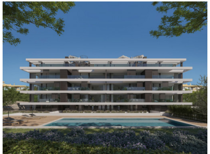
Blick auf das Wohnhaus