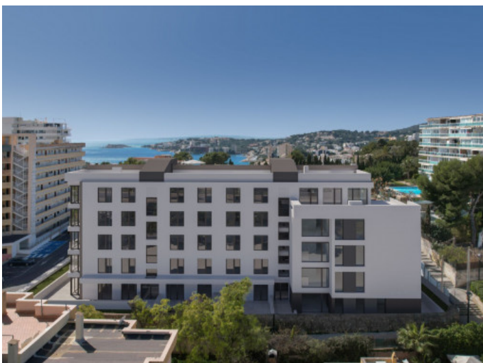
Blick aus der Vogelperspektive auf das Haus