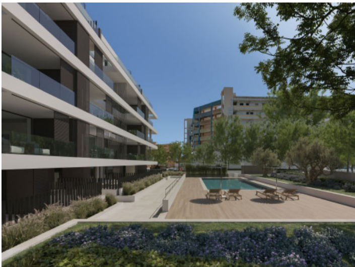
Gemeinschaftsterrasse mit Pool