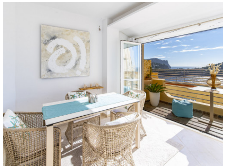
Essbereich mit Balkonzugang

Alle Angaben nach bestem Wissen. Irrtum und Zwischenverkauf vorbehalten. Dieses Exposé ist eine Vorinformation, als Rechtsgrundlage gilt allein der notariell abgeschlossene Kaufvertrag.