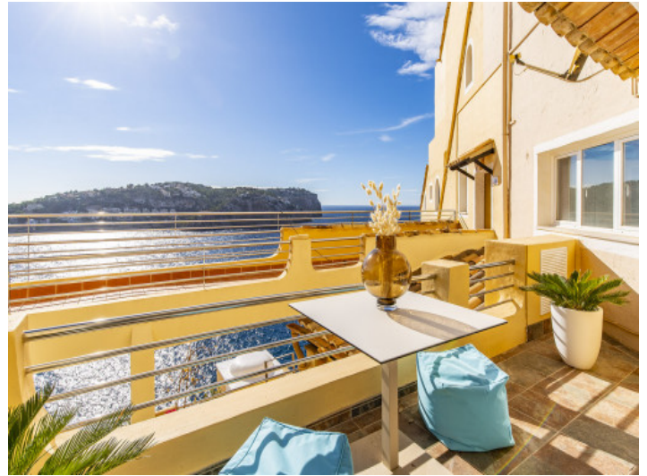
Herrlicher Meerblick vom Balkon aus