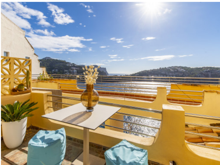
Blick über das Mittelmeer vom Balkon aus