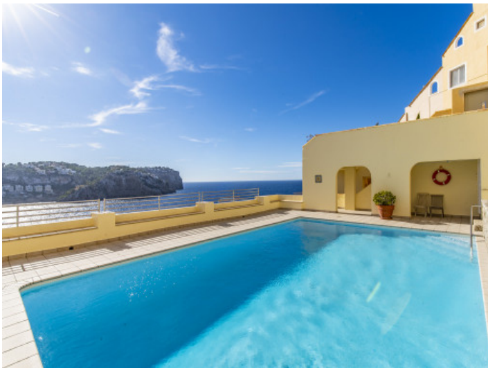
Gemeinschaftspool mit Meerblick