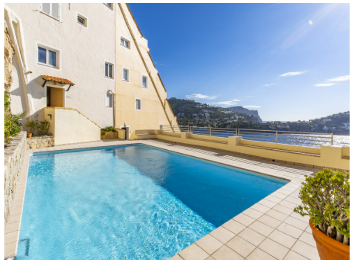
Der Gemeinschaftspool ist von einer Terrasse umgeben

Alle Angaben nach bestem Wissen. Irrtum und Zwischenverkauf vorbehalten. Dieses Exposé ist eine Vorinformation, als Rechtsgrundlage gilt allein der notariell abgeschlossene Kaufvertrag.