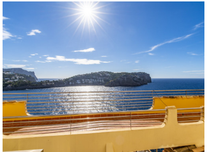
Wohnung mit privatem Meerzugang