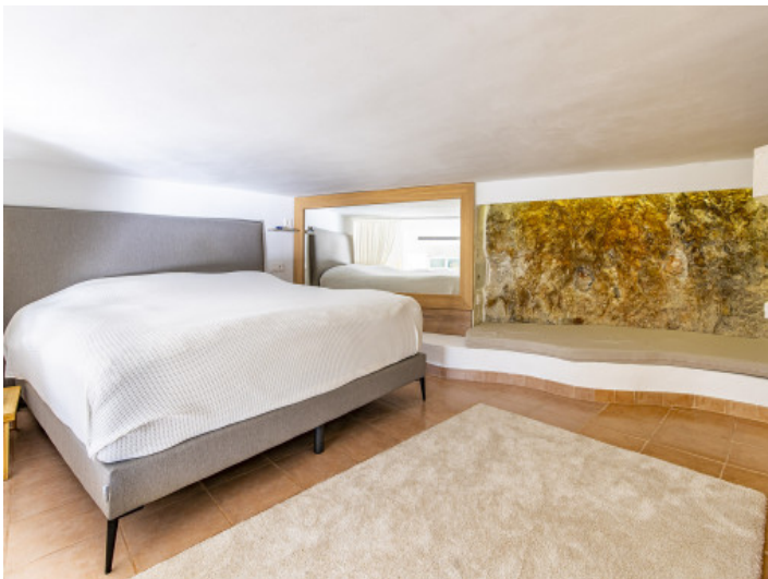
Blick auf das Mittelmeer vom Schlafzimmer aus