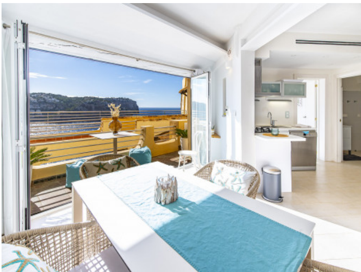
Essbereich mit Blick auf das Mittelmeer