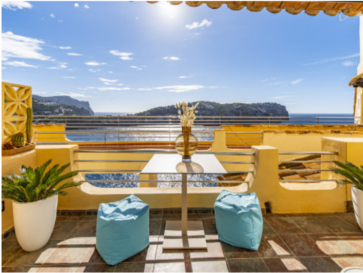
Toller Meer- und Bergblick