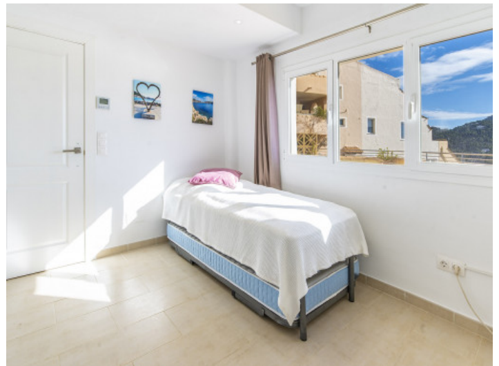
Eines von zwei Schlafzimmern