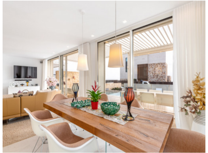
Viel Platz im Essbereich