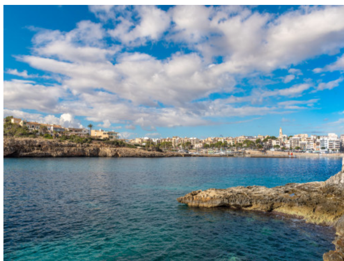
Hafen von Porto Cristo und Strand

Alle Angaben nach bestem Wissen. Irrtum und Zwischenverkauf vorbehalten. Dieses Exposé ist eine Vorinformation, als Rechtsgrundlage gilt allein der notariell abgeschlossene Kaufvertrag.