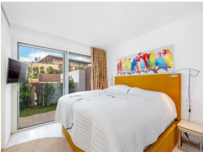
Großes Schlafzimmer mit Badezimmer en Suite