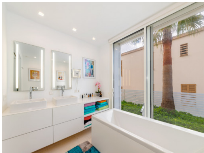
Komplettes Badezimmer mit Badewanne