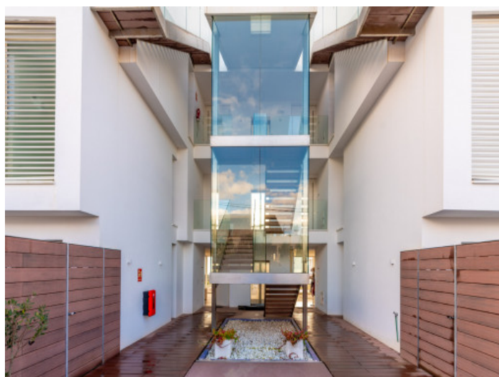
Haupteingang zum Gebäude