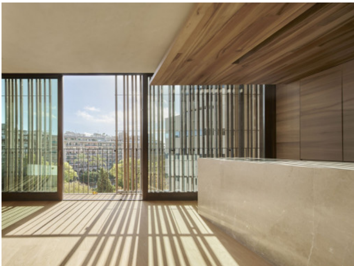
Essbereich mit offener Küche