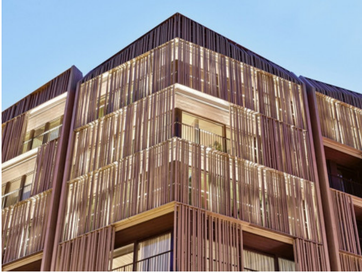
Außenansicht des Wohnhauses