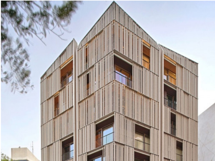
Außenansicht des Wohnhauses

Alle Angaben nach bestem Wissen. Irrtum und Zwischenverkauf vorbehalten. Dieses Exposé ist eine Vorinformation, als Rechtsgrundlage gilt allein der notariell abgeschlossene Kaufvertrag.