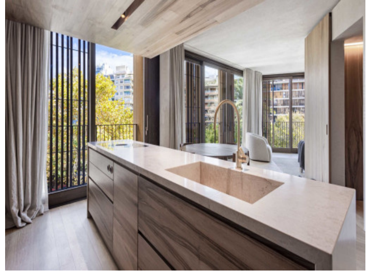
Offene Küche mit Kücheninsel