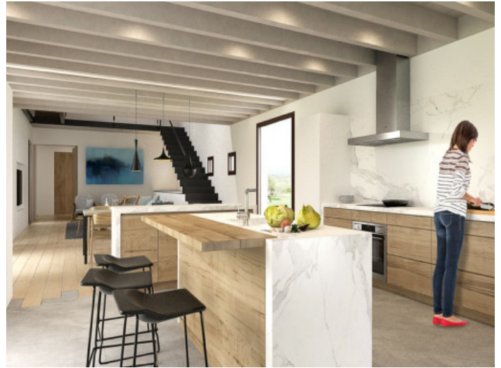
Vollausgestattete Küche mit Kochinsel