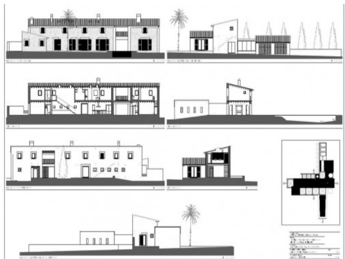
Bauzeichnung der Finca II

Alle Angaben nach bestem Wissen. Irrtum und Zwischenverkauf vorbehalten. Dieses Exposé ist eine Vorinformation, als Rechtsgrundlage gilt allein der notariell abgeschlossene Kaufvertrag.