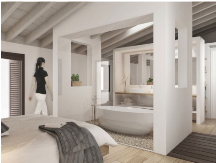
Schlafzimmer mit offenem Badezimmer en Suite