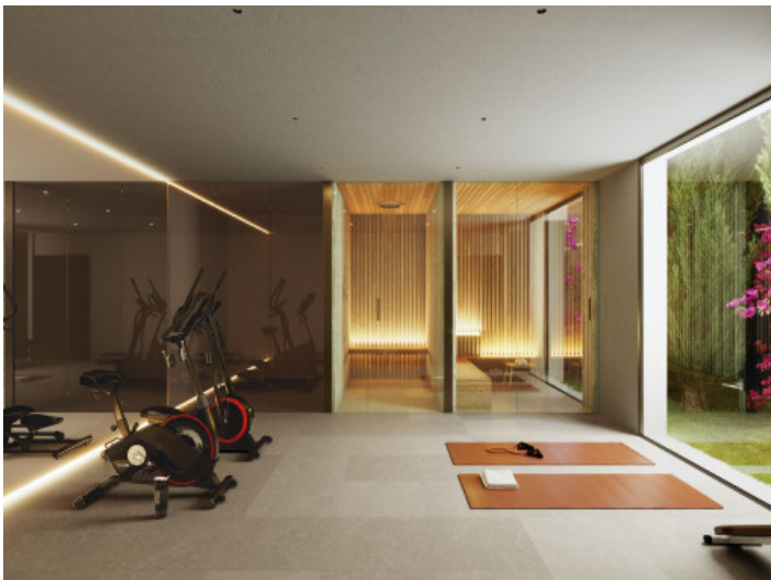
Eleganter Fitness- und Spa Bereich