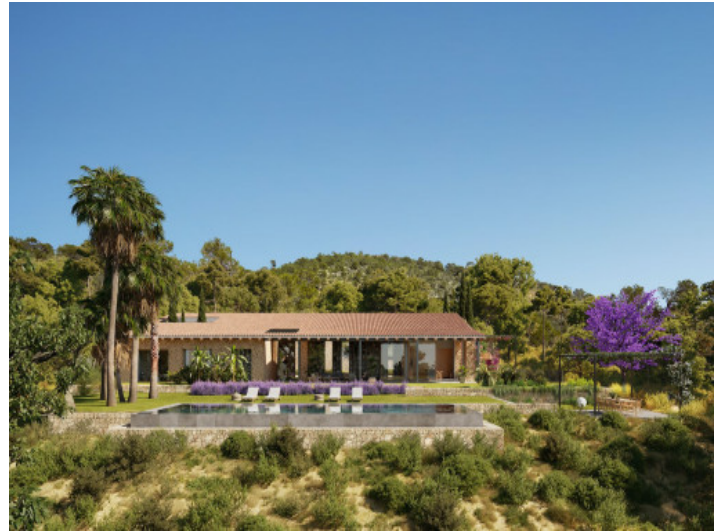
Großer Garten mit Poolbereich