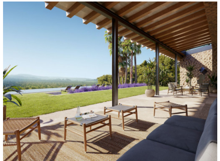
Überdachte Terrasse und Garten