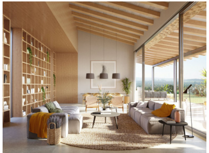
Offener Wohnbereich mit hoher Decke