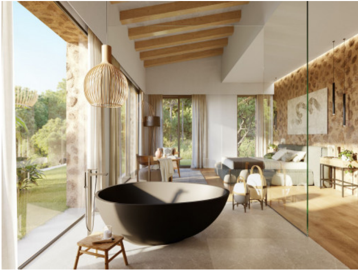
Stylisches Badezimmer mit Ausblick