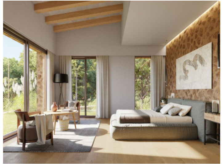
Weiteres gemütliches Doppelschlafzimmer