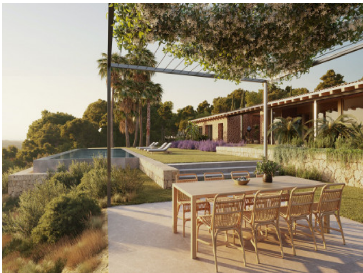
Essbereich im Garten