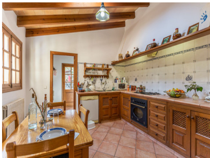
Schöne Küche im Landhausstil

Alle Angaben nach bestem Wissen. Irrtum und Zwischenverkauf vorbehalten. Dieses Exposé ist eine Vorinformation, als Rechtsgrundlage gilt allein der notariell abgeschlossene Kaufvertrag.