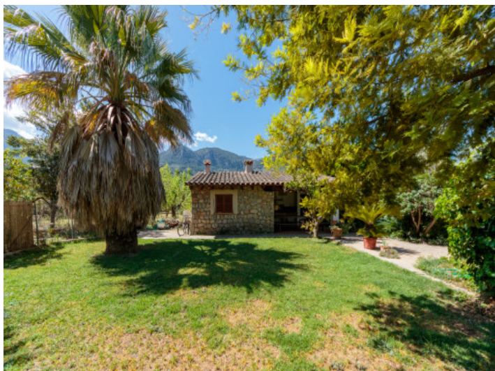
Schöner mediterraner Garten