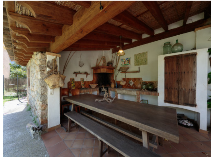
Fantastischer Grillbereich im Freien