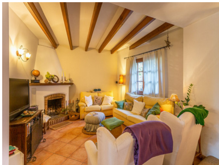
Gemütlicher Wohnbereich mit Kamin