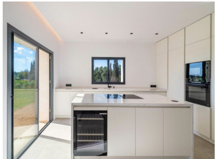
Küche mit Kochinsel