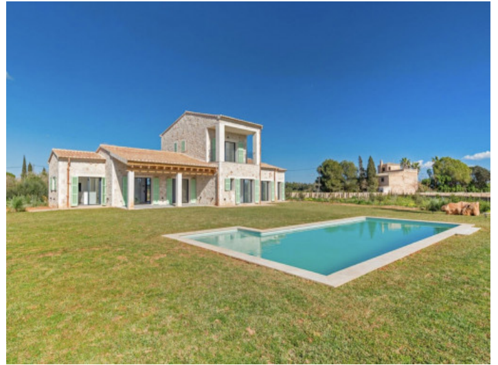
Garten und Poolansicht