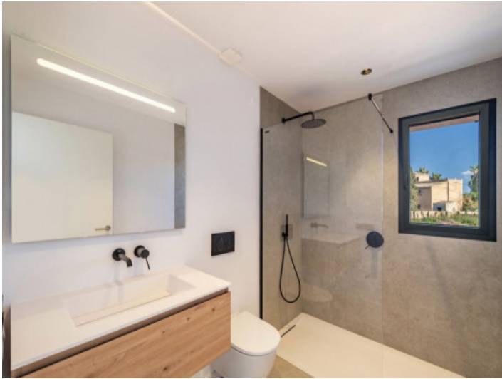
Bad en Suite 3. Schlafzimmer