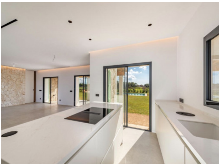
Küche mit Blick ins Wohn- und Esszimmer