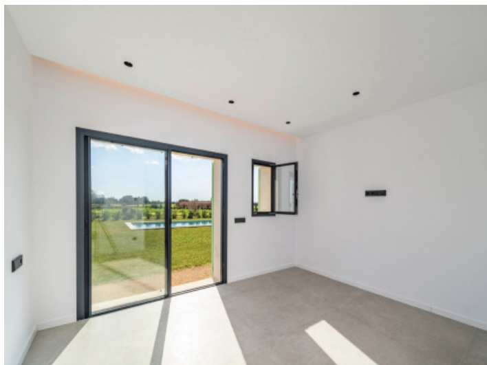
1. Schlafzimmer EG