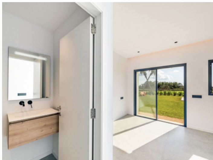
Bad en Suite 1. Schlzimmer