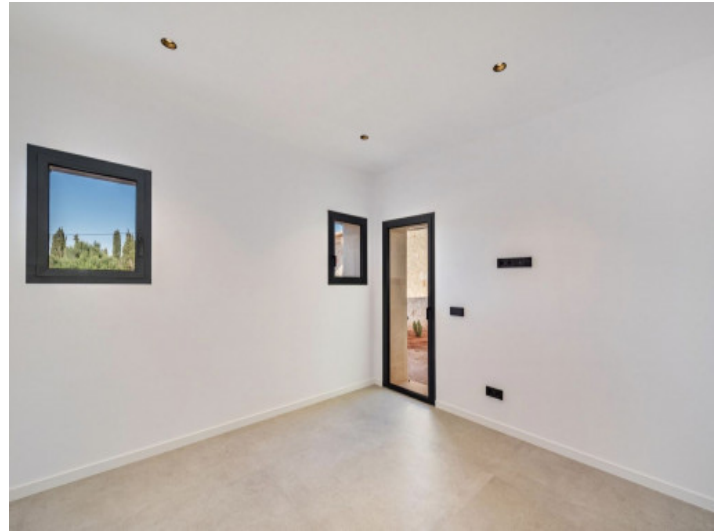
Büro / 5. Schlafzimmer EG mit Ausgang zum Hof