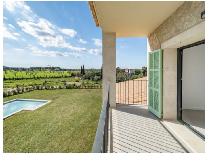
Terrasse von Masterbedroom 1.OG