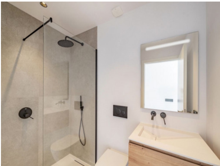
5. Badezimmer EG