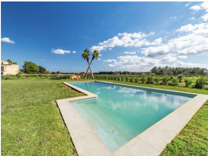
64 m 2 Pool mit Treppe