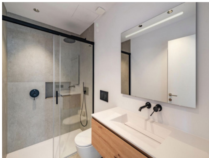
Bad en Suite Masterbedroom