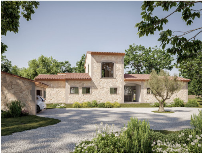
Finca in Campos