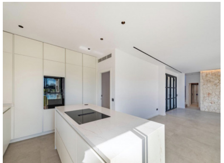
Küche mit Blick zum Abstellraum links und Eingangstür rechts

Alle Angaben nach bestem Wissen. Irrtum und Zwischenverkauf vorbehalten. Dieses Exposé ist eine Vorinformation, als Rechtsgrundlage gilt allein der notariell abgeschlossene Kaufvertrag.