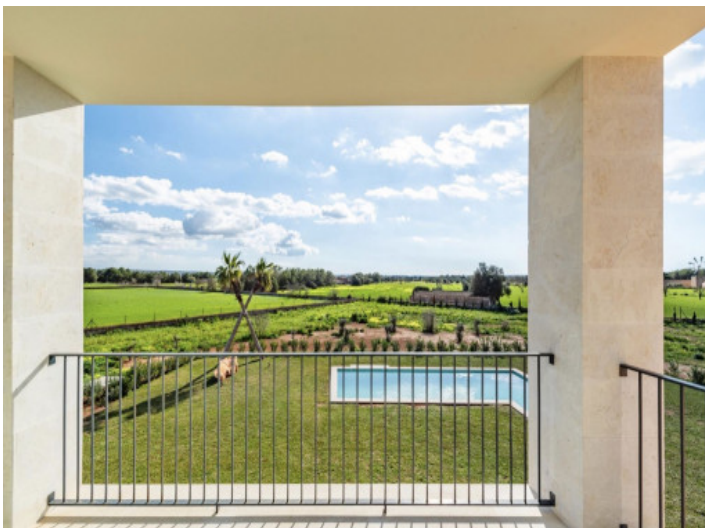
Terrasse von Masterbedroom 1.OG

Alle Angaben nach bestem Wissen. Irrtum und Zwischenverkauf vorbehalten. Dieses Exposé ist eine Vorinformation, als Rechtsgrundlage gilt allein der notariell abgeschlossene Kaufvertrag.