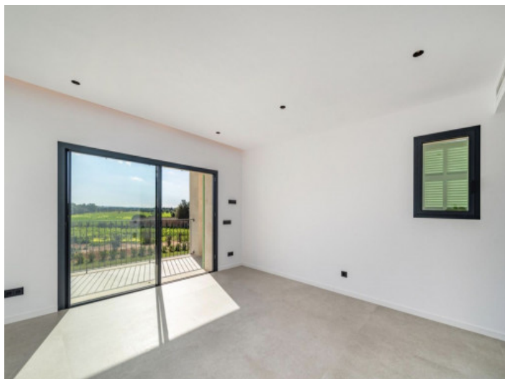
Masterbedroom 1.0Gim 1.0G

PORTA MALLORQUINA® Your home. Our passion.