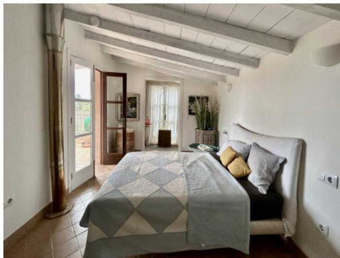
Schlafzimmer im Obergeschoss