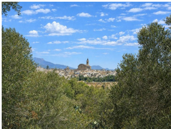
Aussicht nach Santanyi

Alle Angaben nach bestem Wissen. Irrtum und Zwischenverkauf vorbehalten. Dieses Exposé ist eine Vorinformation, als Rechtsgrundlage gilt allein der notariell abgeschlossene Kaufvertrag.