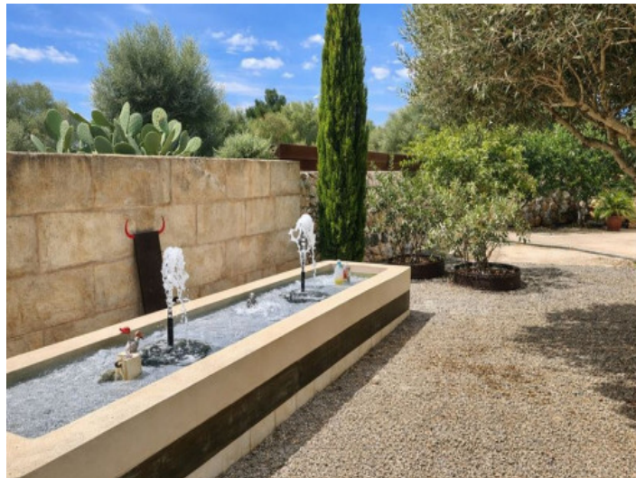
Brunnen im Garten