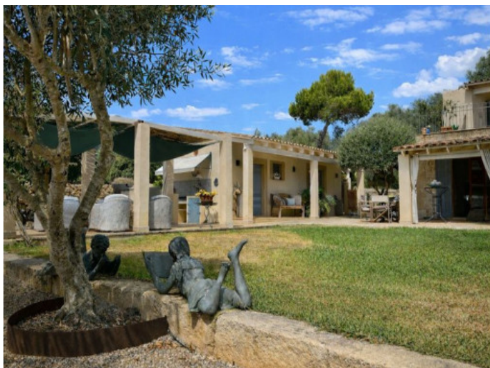
Blick auf das Gästehaus