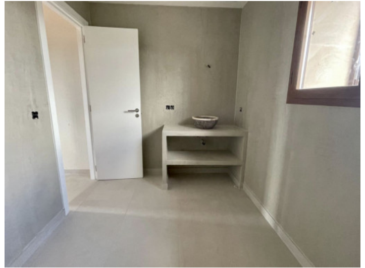
Bad en suite zweites Schlafzimmer