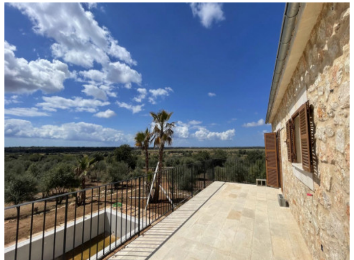
Aussicht von der Terrasse