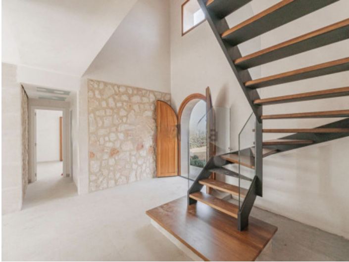
Eingangsbereich und Treppenhaus