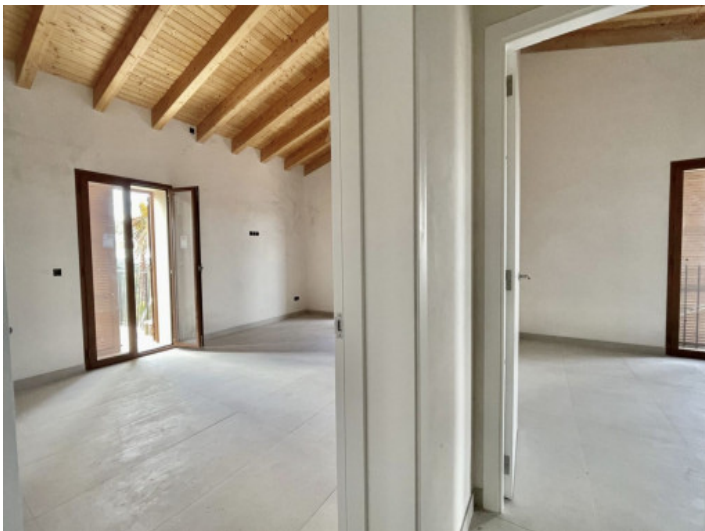
Links Masterbedroom und rechts drittes Schlafzimmer