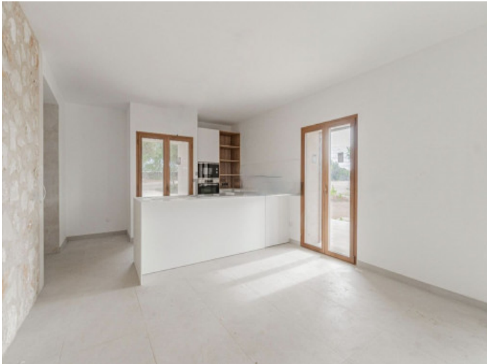
Küche mit Kücheninsel