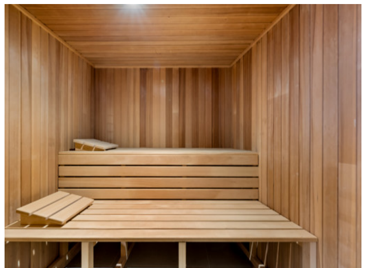
Wellnessbereich mit Sauna

Alle Angaben nach bestem Wissen. Irrtum und Zwischenverkauf vorbehalten. Dieses Exposé ist eine Vorinformation, als Rechtsgrundlage gilt allein der notariell abgeschlossene Kaufvertrag.