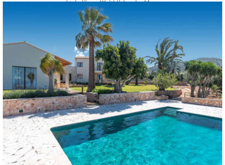
Großzügiger Salzwasserpool mit Sonnenterrasse