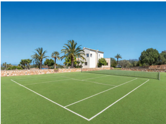
Finca mit Tennisplatz und Meerblick zwischen Manacor und Colònia de

San Pedro Alle Angaben nach bestem Wissen und Zwischenverkauf vorbehalten. Dieses Exposé ist eine Vorinformation, als Rechtsgrundlage gilt allein der notariell abgeschlossene Kaufvertrag.