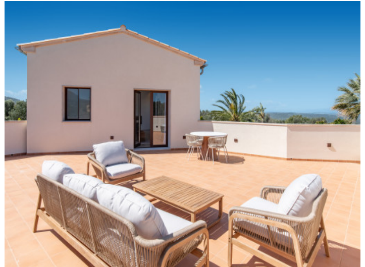
Private Terrasse der Master-Suite