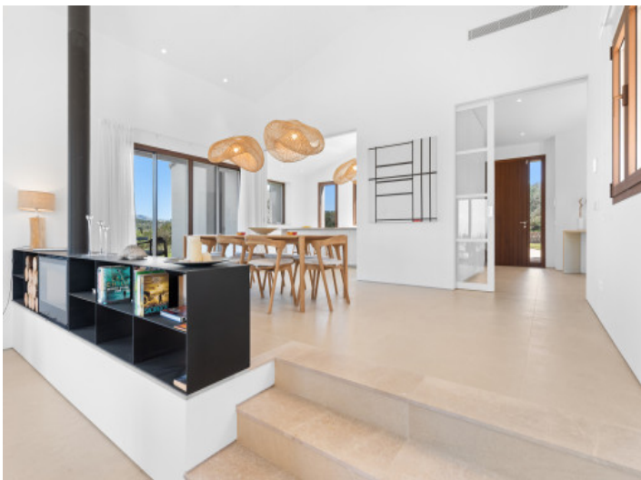
Hochwertige Ausstattung und ruhige Atmosphäre