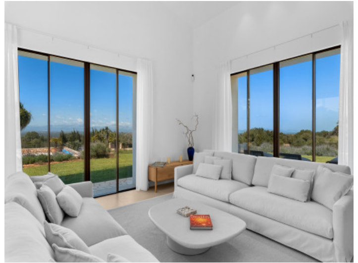
Hochwertige Architektur eingebettet in die Natur