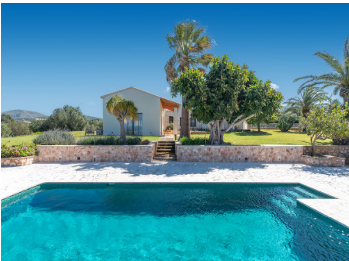
Großzügiger Salzwasserpool mit Sonnenterrasse