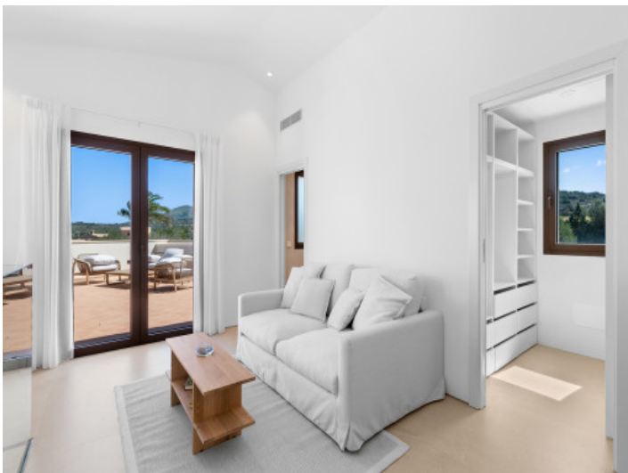
... mit privatem Wohnbereich, Ankleide...