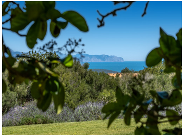
Natur und Blick