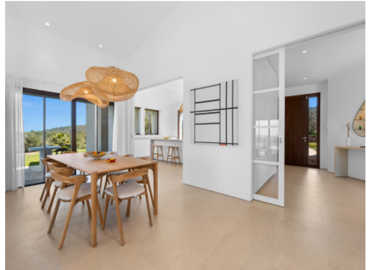
Essbereich mit direktem Zugang zur Terrasse