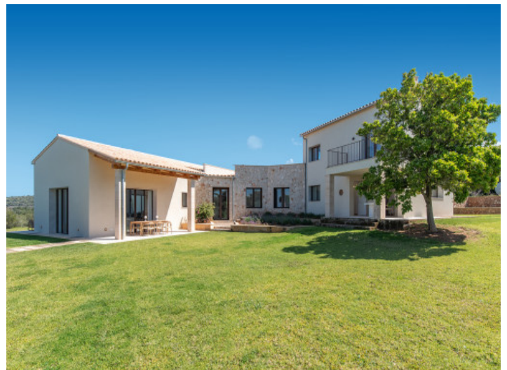
Außenbereiche ideal für Entspannung und gesellige Abende

Alle Angaben nach bestem Wissen. Irrtum und Zwischenverkauf vorbehalten. Dieses Exposé ist eine Vorinformation, als Rechtsgrundlage gilt allein der notariell abgeschlossene Kaufvertrag.