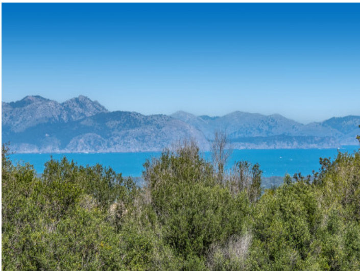
Weitblick bishin zum Meer