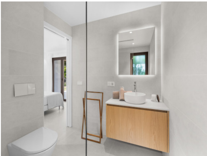
Modernes Badezimmer en Suite