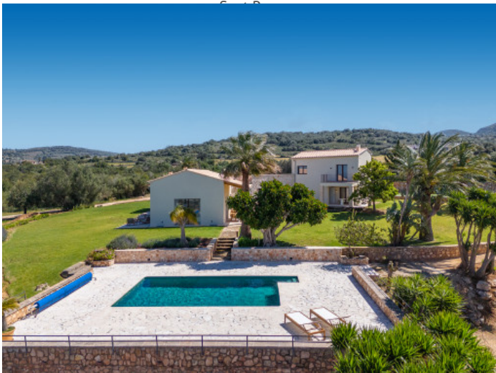
Luxusfinca mit Tennisplatz, Meerblick und absoluter Privatsphäre in Colònia de San Pedro