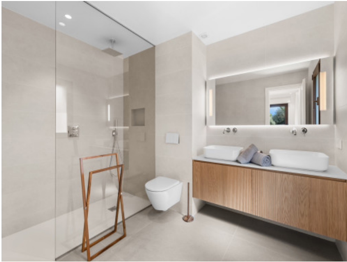
Modernes Badezimmer en Suite