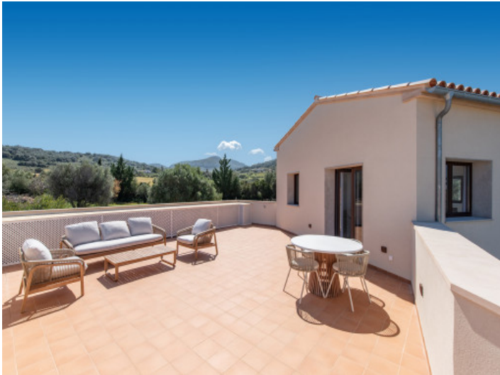
... und privater Terrasse mit Rundumblick