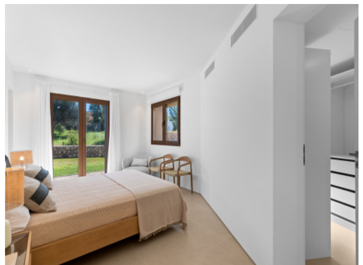
Eines der 4 Schlafzimmer mit Bad en Suite und Ankleide

Alle Angaben nach bestem Wissen. Irrtum und Zwischenverkauf vorbehalten. Dieses Exposé ist eine Vorinformation, als Rechtsgrundlage gilt allein der notariell abgeschlossene Kaufvertrag.