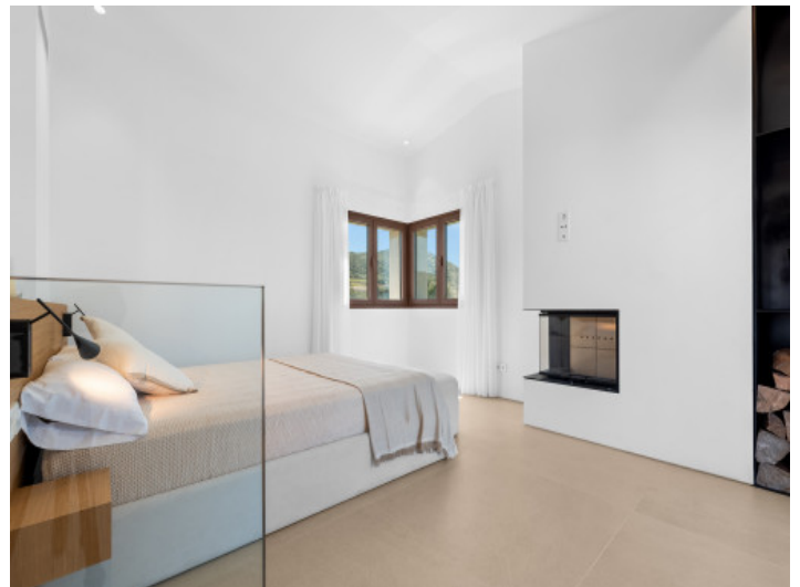
Master-Suite im Obergeschoss...