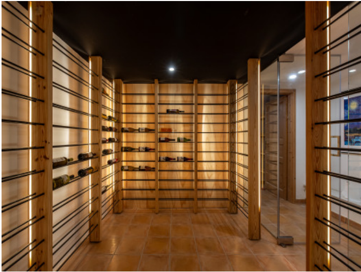
Exklusive Weinbodega mit kontrollierter Temperatur und Luftfeuchtigkeit