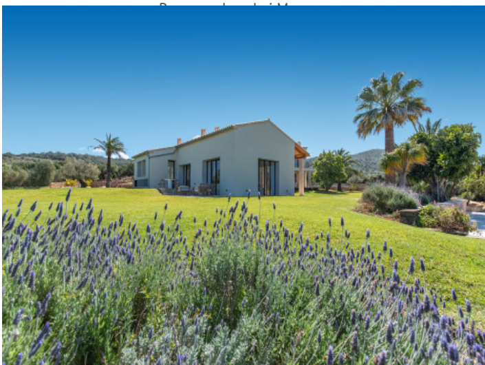
Mediterraner Garten mit absoluter Privatsphäre