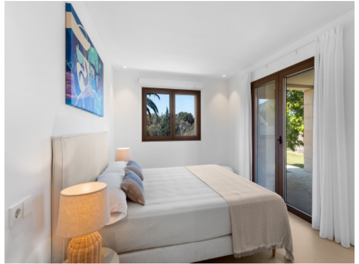
Eines der 4 Schlafzimmer mit Bad en Suite und Ankleide