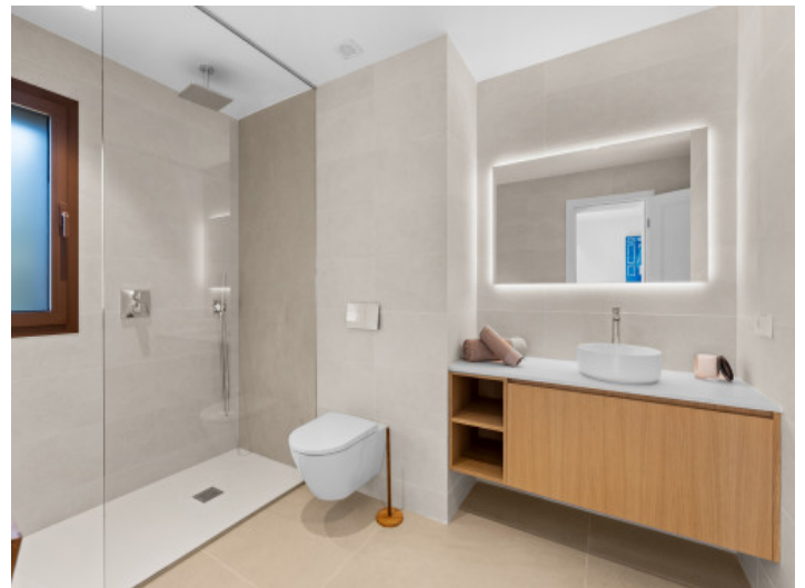
Modernes Badezimmer en Suite