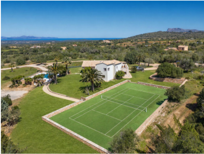
Finca mit Tennisplatz und Meerblick zwischen Manacor und Colònia de San Pedro