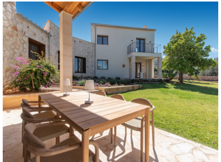
Außenbereiche ideal für Entspannung und gesellige Abende