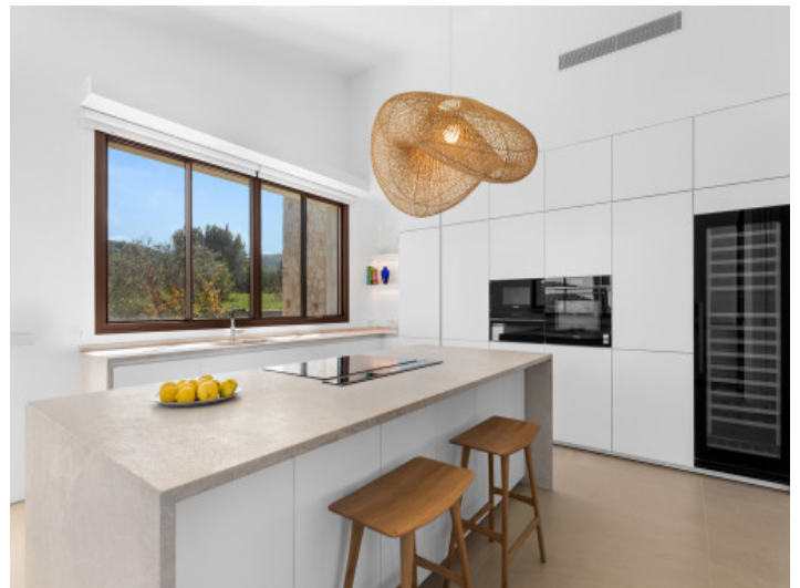
Designküche mit hochwertigen Materialien und moderner Ausstattung