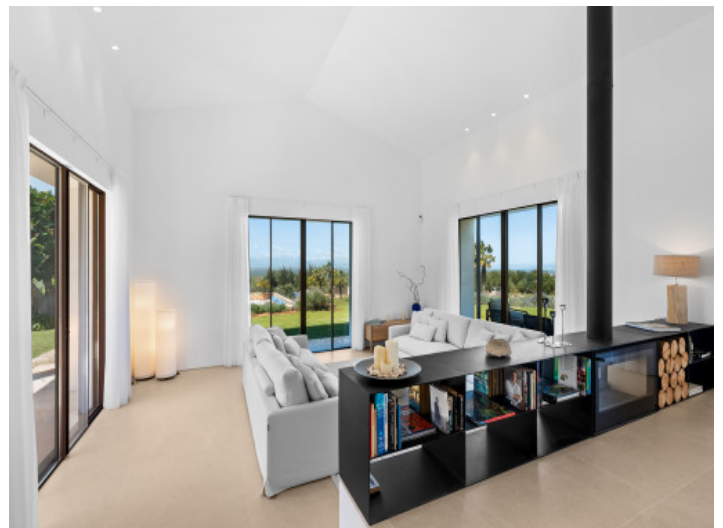
Offener Wohnbereich mit viel Tageslicht und Blick ins Grüne bis hin zum Meer

Alle Angaben nach bestem Wissen. Irrtum und Zwischenverkauf vorbehalten. Dieses Exposé ist eine Vorinformation, als Rechtsgrundlage gilt allein der individuell abgeschlossene Kaufvertrag.