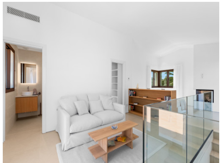
...Badezimmer en Suite

Alle Angaben nach bestem Wissen. Irrtum und Zwischenverkauf vorbehalten. Dieses Exposé ist eine Vorinformation, als Rechtsgrundlage gilt allein der notariell abgeschlossene Kaufvertrag.