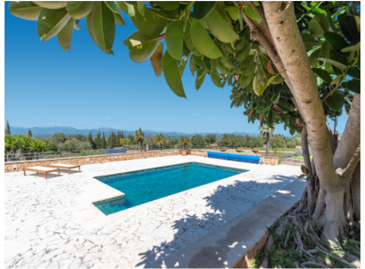
Mediterrane Luxusfinca mit Tennisplatz, Wellnessbereich und herrlichem Meerblick