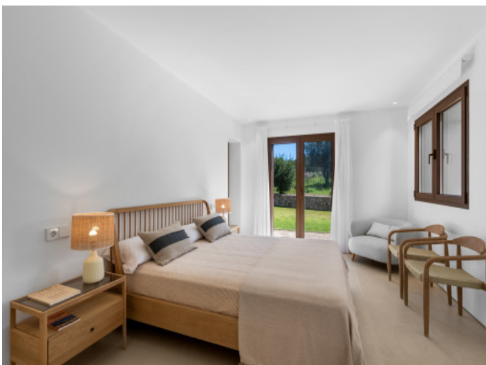
Eines der 4 Schlafzimmer mit Bad en Suite und Gartenzugang