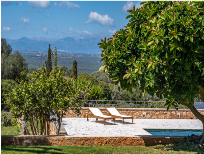
Mediterraner Garten mit absoluter Privatsphäre