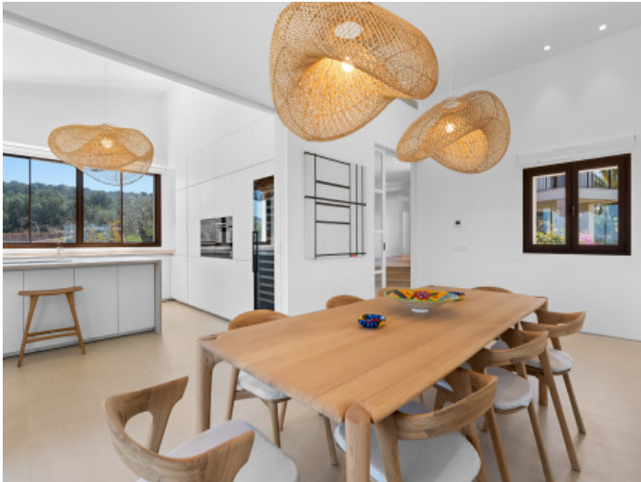
Hochwertige, separat verschließbare Küche für maximale Diskretion und