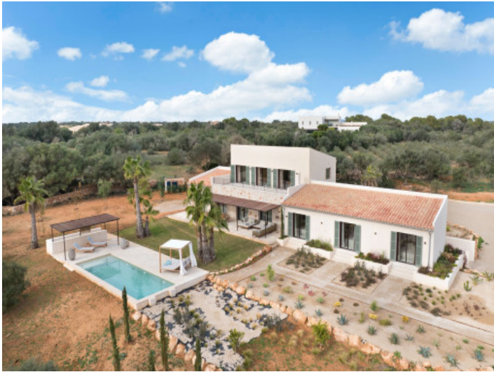
Ansicht auf Anwesen