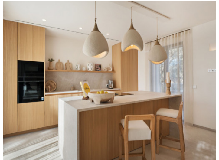
Küche mit Kochinsel