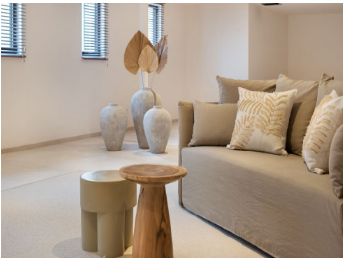
Untergeschoss mit Fussbodenheizung