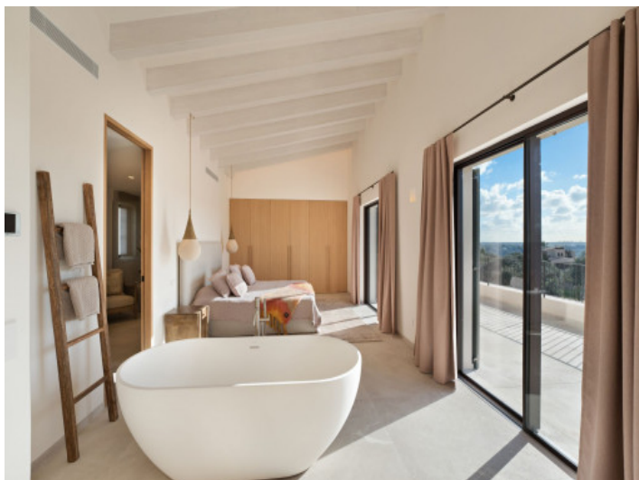
Aussicht vom Masterschlafzimmer