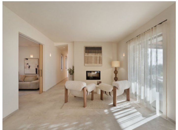
Sitzbereich mit Kamin