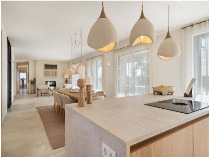
Essbereich mit Kochinsel