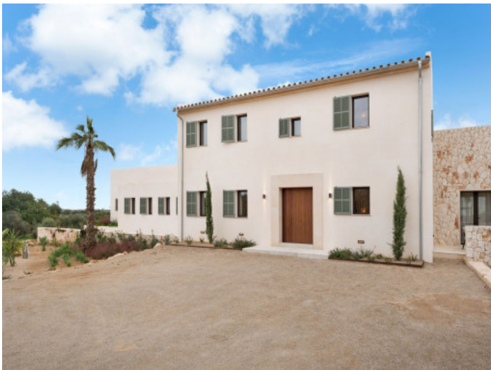
Frontansicht der Finca