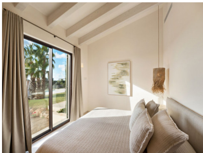
Schlafzimmer mit Zugang zum Poolbereich

Alle Angaben nach bestem Wissen. Irrtum und Zwischenverkauf vorbehalten. Dieses Exposé ist eine Vorinformation, als Rechtsgrundlage gilt allein der notariell abgeschlossene Kaufvertrag.