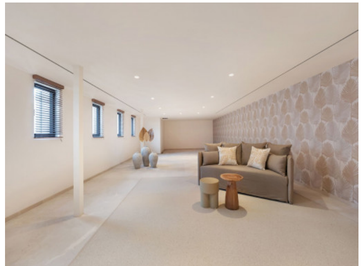
Untergeschoss Bereich für GYM und Sauna