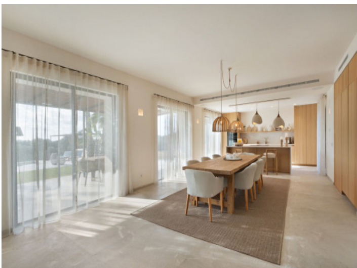
Essbereich mit offener Küche