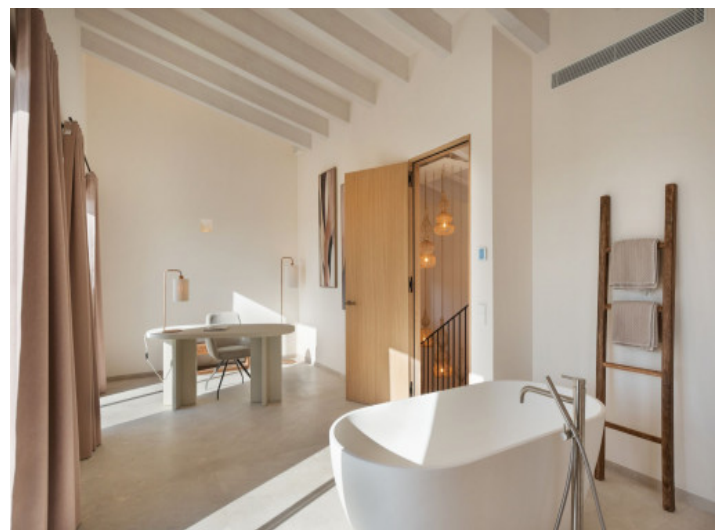
Masterschlafzimmer mit Badewanne

Alle Angaben nach bestem Wissen. Irrtum und Zwischenverkauf vorbehalten. Dieses Exposé ist eine Vorinformation, als Rechtsgrundlage gilt allein der notariell abgeschlossene Kaufvertrag.