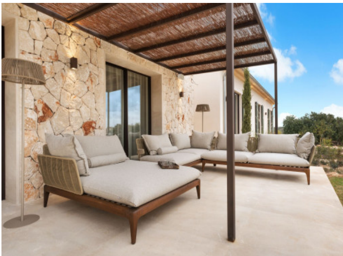
Terrasse zum Genießen der Natur