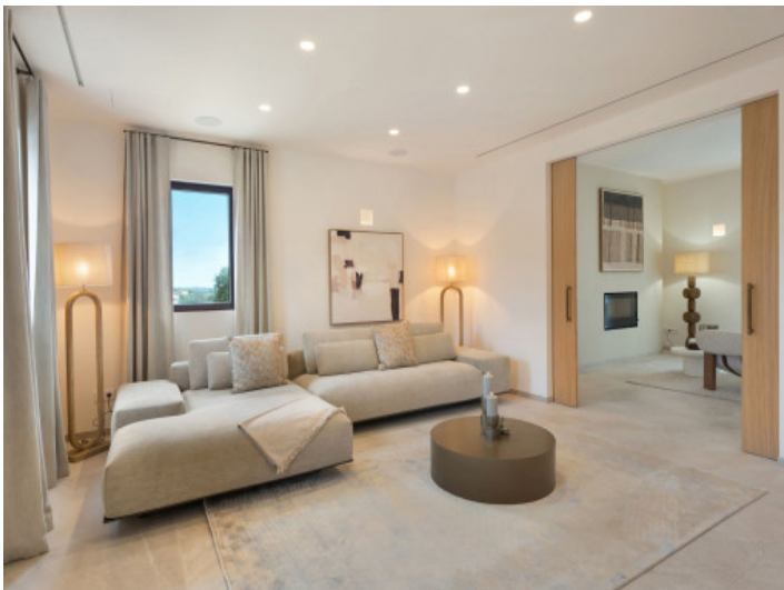
Wohnzimmer mit Übergang zum Kaminbereich