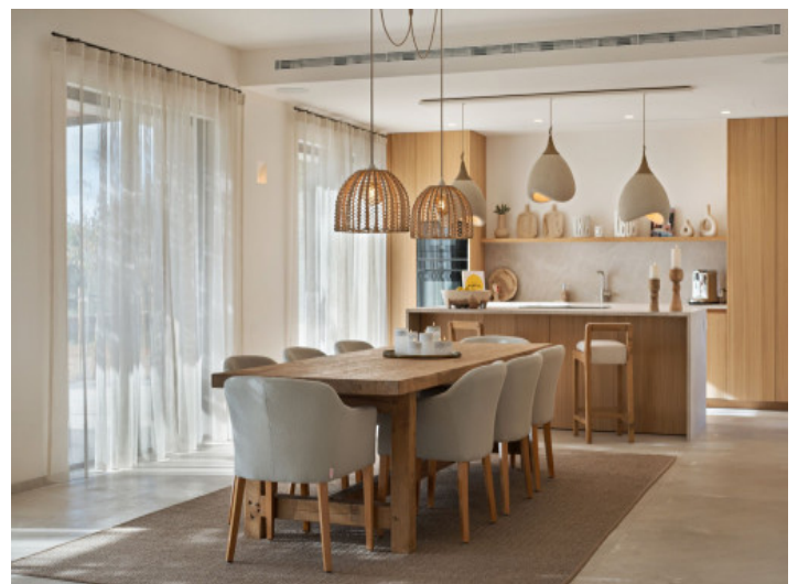
Essbereich mit Küche

Alle Angaben nach bestem Wissen. Irrtum und Zwischenverkauf vorbehalten. Dieses Exposé ist eine Vorinformation, als Rechtsgrundlage gilt allein der notariell abgeschlossene Kaufvertrag.