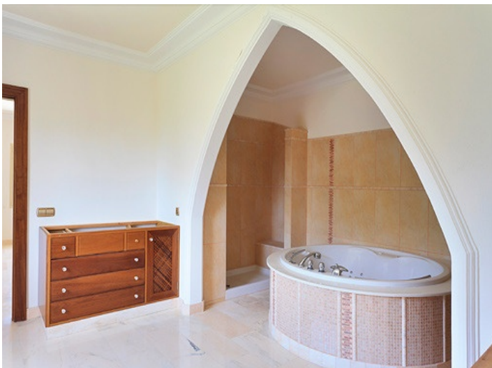
Weitläufiger Küchen- und Essbereich