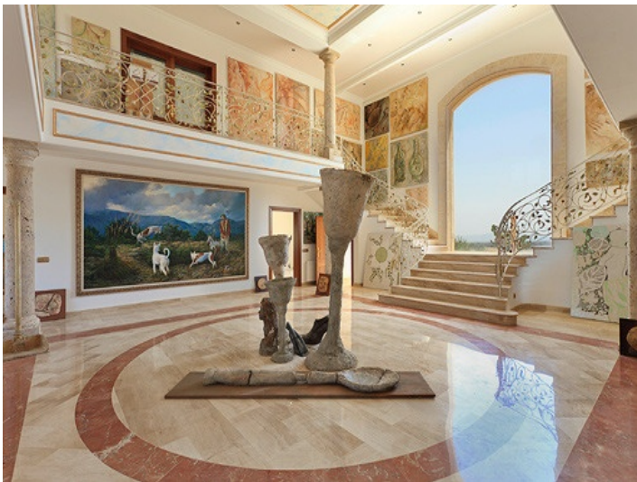
Panoramablick aus der Eingangshalle