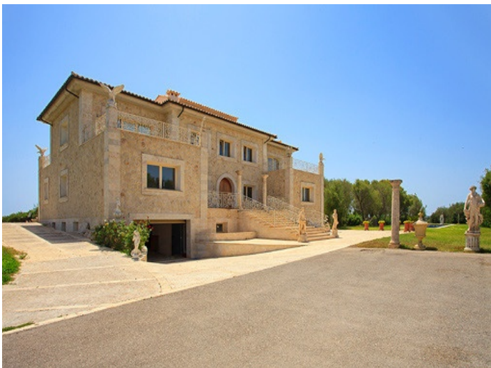
Repräsentative Auffahrt zur Villa

Alle Angaben nach bestem Wissen. Irrtum und Zwischenverkauf vorbehalten. Dieses Exposé ist eine Vorinformation, als Rechtsgrundlage gilt allein der notariell abgeschlossene Kaufvertrag.