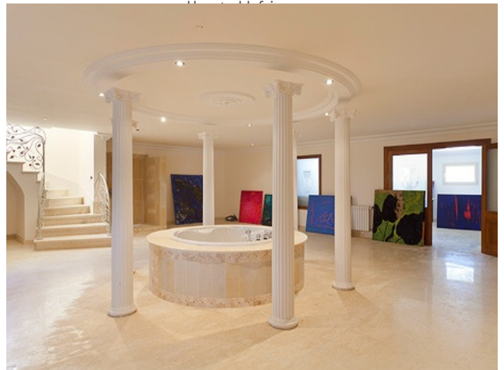
Eine dreiläufige U-Treppe führt zur Galerie