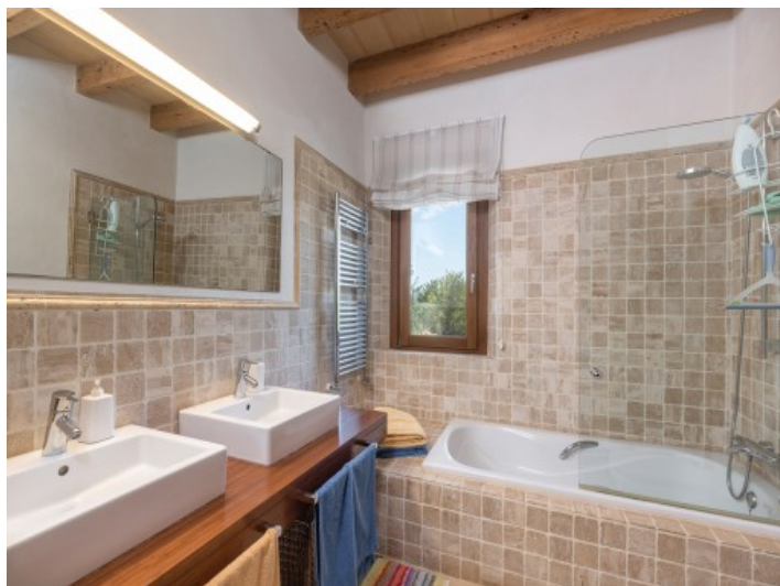
Charmantes Badezimmer mit Doppelwaschbecken und Badewanne