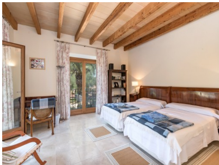
Schlafzimmer mit Zugang zum Außenbereich