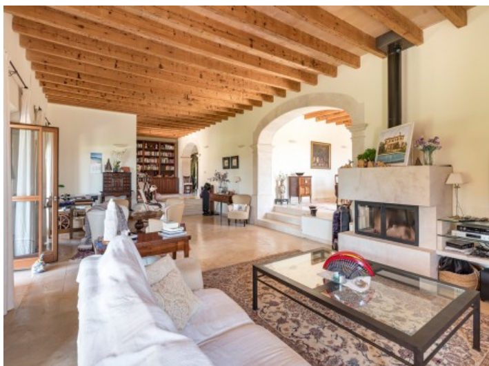
Alternative Ansicht des Wohnbereiches