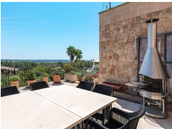
Sonnterrasse mit Grillbereich