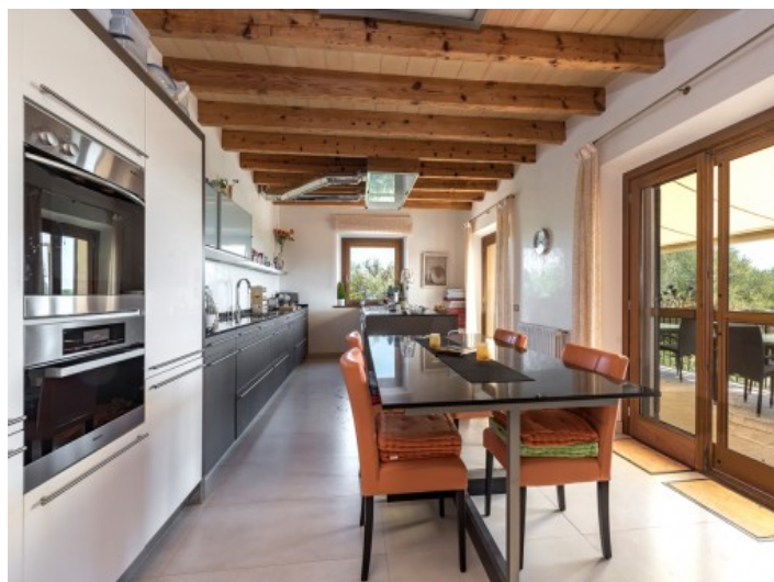
Moderne und voll ausgestattete Küche

Alle Angaben nach bestem Wissen. Irrtum und Zwischenverkauf vorbehalten. Dieses Exposé ist eine Vorinformation, als Rechtsgrundlage gilt allein der notariell abgeschlossene Kaufvertrag.