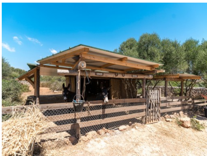
Stall für Pferde oder Esel