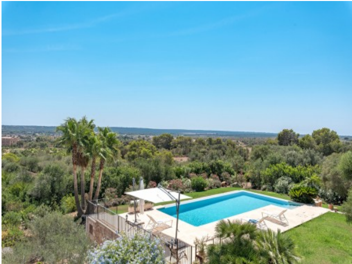
Blick von der Terrasse auf den gepflegten Poolbereich