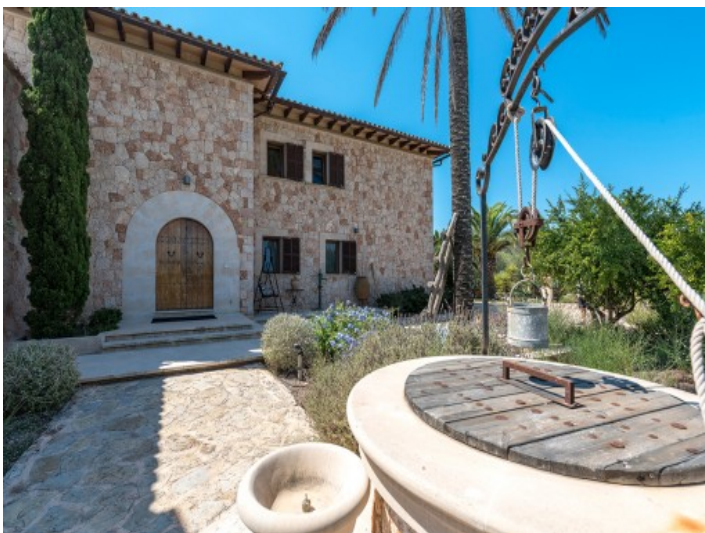
Einladender Eingangsbereich mit Brunnen