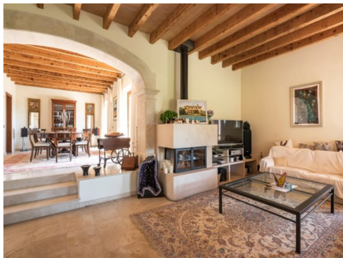
Rustikales Wohnzimmer mit Kamin für kältere Tage