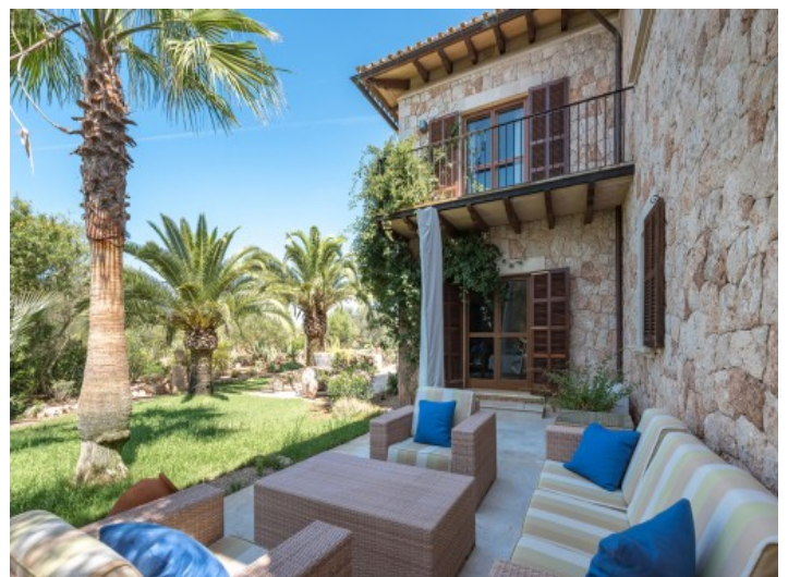
Weitere Terrasse der Finca mit Loungemöbeln

Alle Angaben nach bestem Wissen. Irrtum und Zwischenverkauf vorbehalten. Dieses Exposé ist eine Vorinformation, als Rechtsgrundlage gilt allein der notariell abgeschlossene Kaufvertrag.