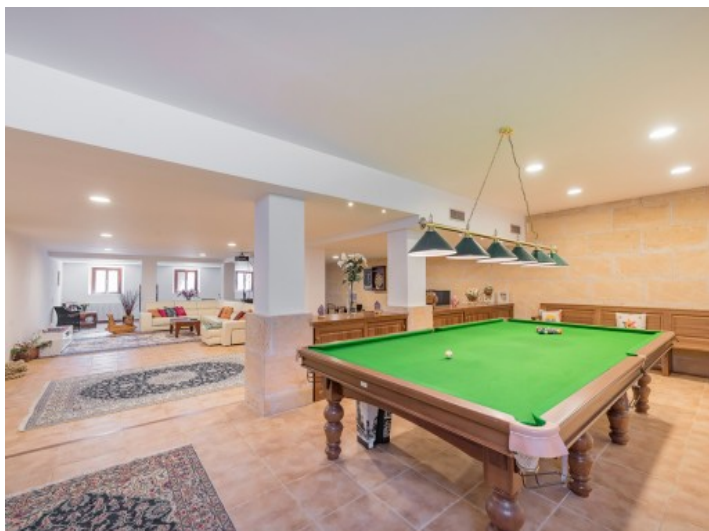
Großes Billardzimmer mit Loungebereich