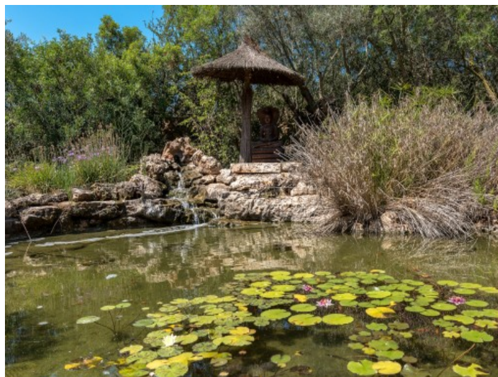
Dieser künstlich angelegte Teich ist Teil des Außenbereiches