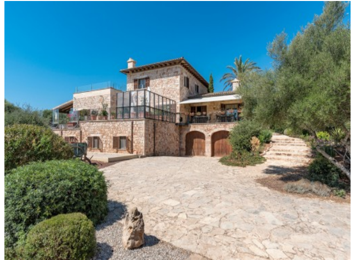
Frontansicht der Finca mit zahlreichen Terrassen