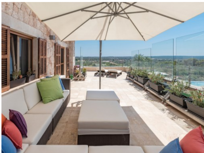
Loungebereich mit herrlichem Blick auf den Pool