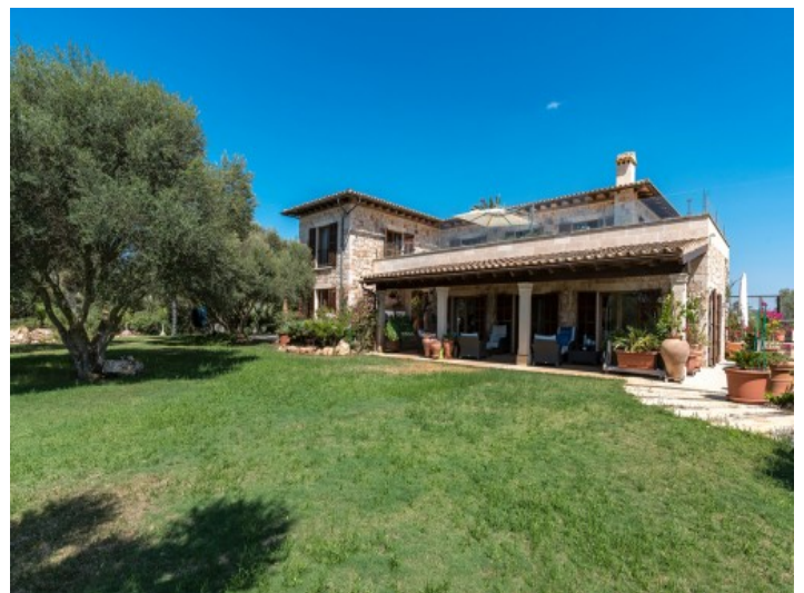
Traumhafter Garten des Anwesens