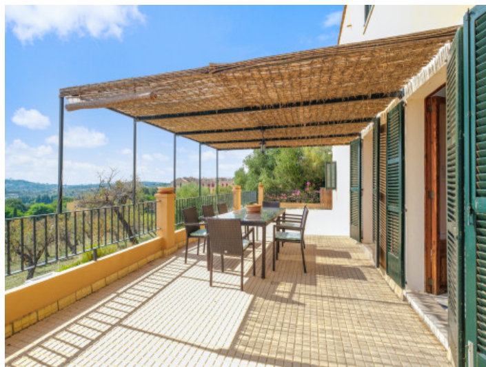
Schöne, überdachte Terrasse