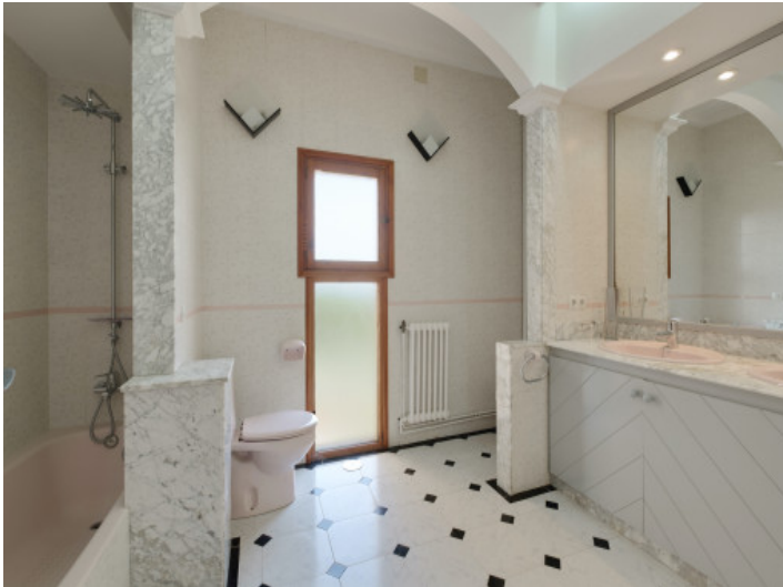
Eines von 3 Bädern