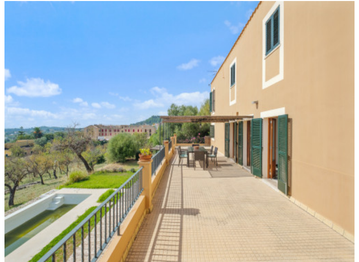
Großer Terrasse mit Gartenblick