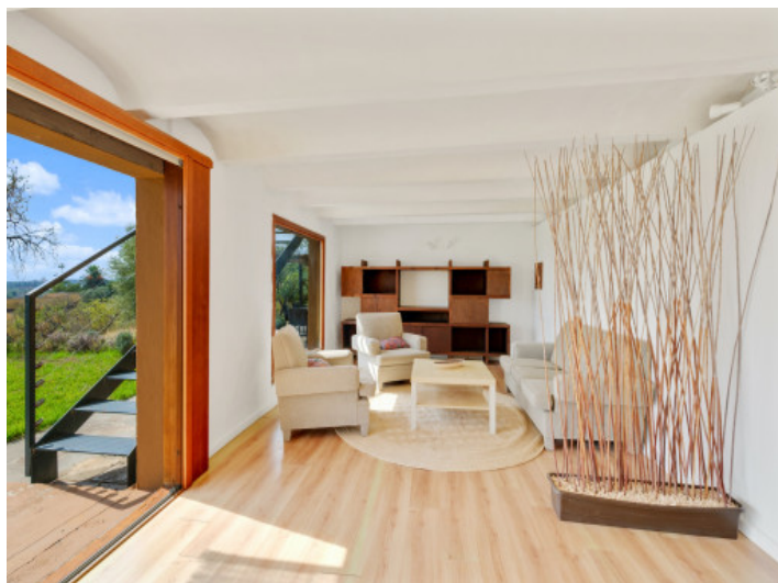
Chill-out Bereich im Untergeschoss