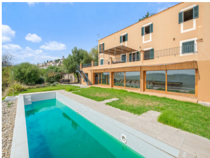
Außenansicht und Pool