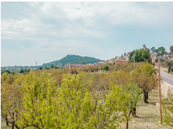
Blick auf die Umgebung

Alle Angaben nach bestem Wissen. Irrtum und Zwischenverkauf vorbehalten. Dieses Exposé ist eine Vorinformation, als Rechtsgrundlage gilt allein der notariell abgeschlossene Kaufvertrag.