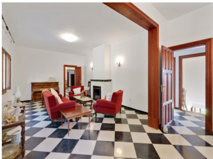
Wohnbereich im Obergeschoss