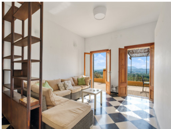
Separter Wohnbereich mit Terrassenzugang