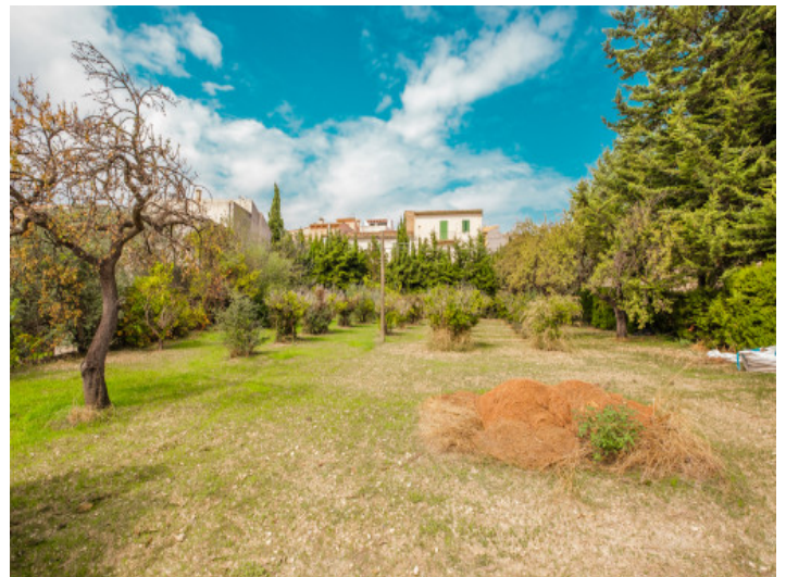
Ansicht des Grundstückes