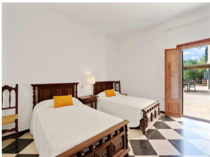
Schlafzimmer mit Terrassenzugang