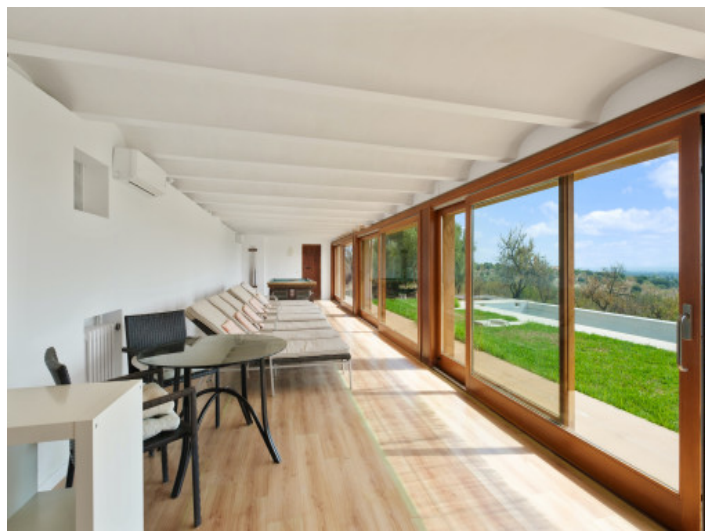
Spabereich mit Ausblick