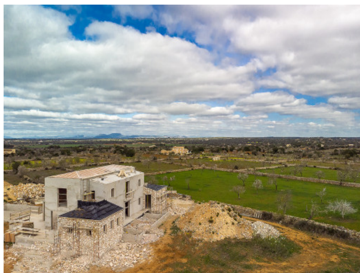
Finca von oben