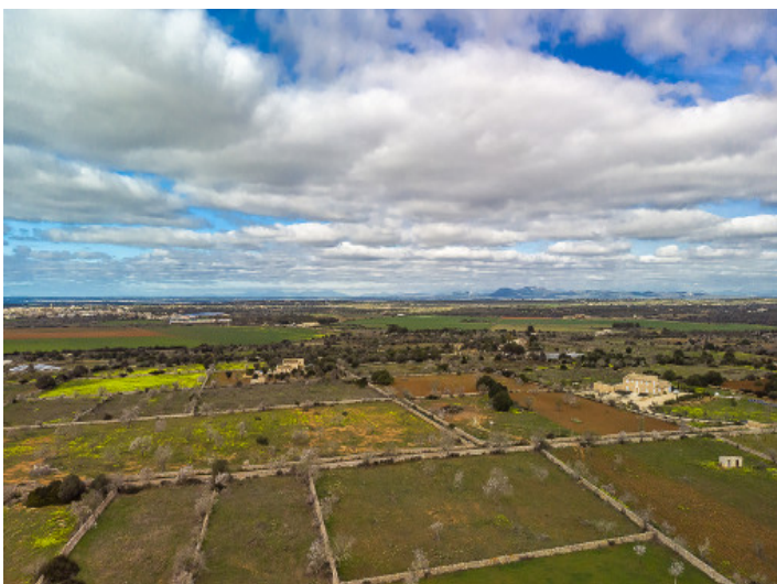
Blick bis zum Tramuntanagebirge