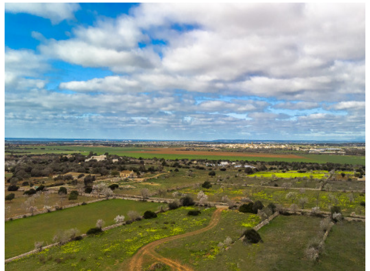
Weitblick über die Landschaft