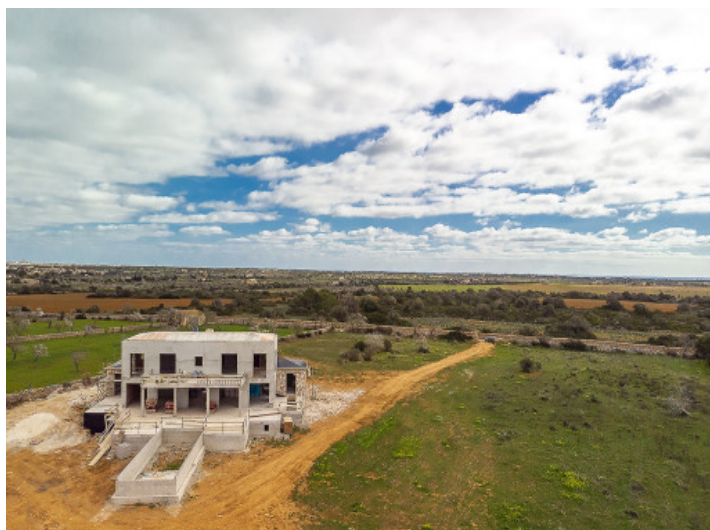
Finca von oben