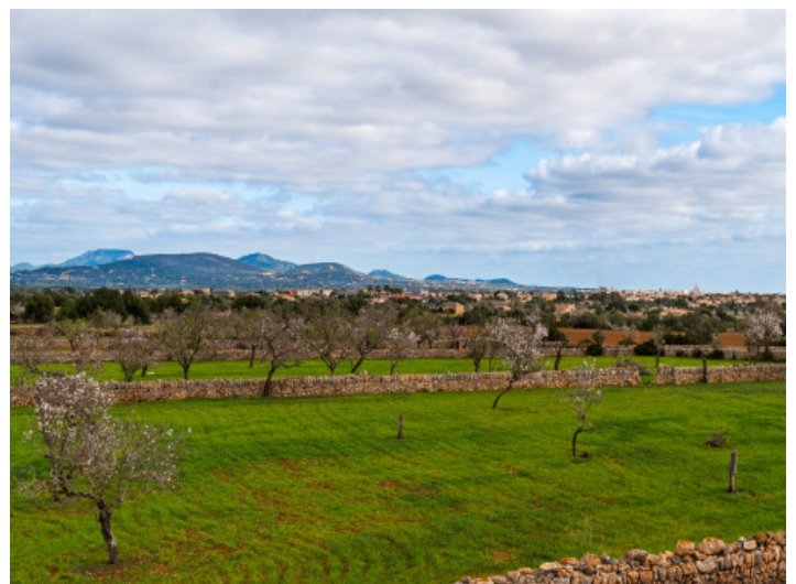
Grundstück mit Mandelbäumen

Alle Angaben nach bestem Wissen. Irrtum und Zwischenverkauf vorbehalten. Dieses Exposé ist eine Vorinformation, als Rechtsgrundlage gilt allein der notariell abgeschlossene Kaufvertrag.