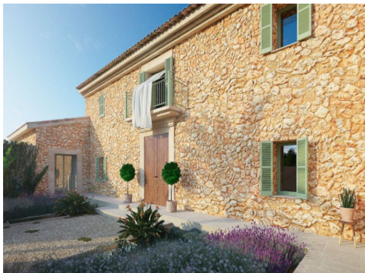
Außenansicht der Finca