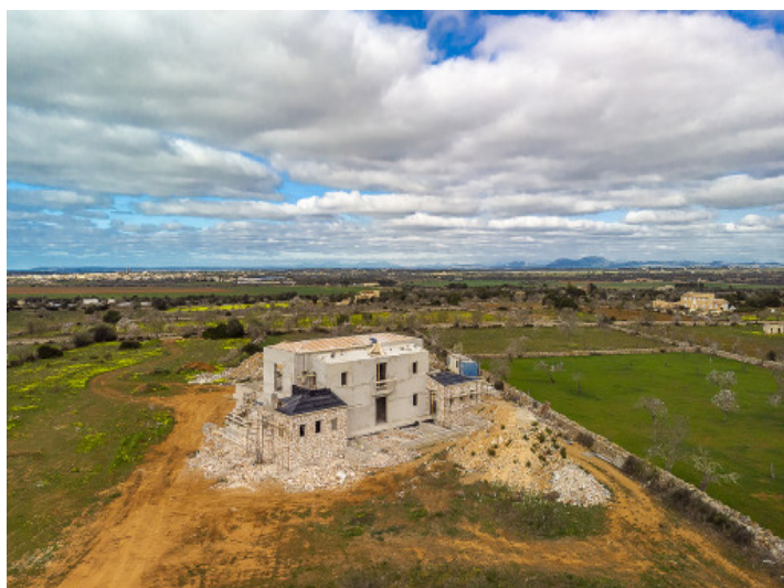
Finca von oben