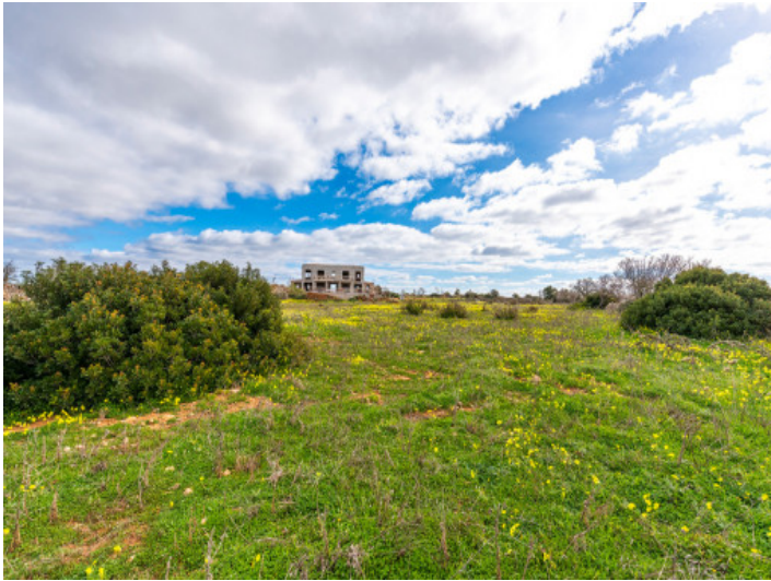
Grundstück und Finca