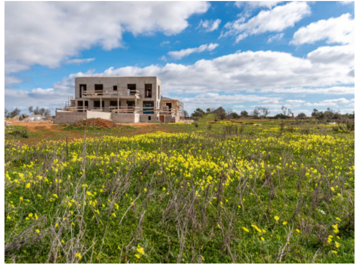
Grundstück und Finca