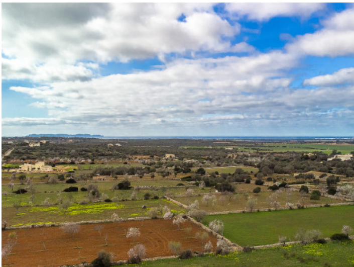
Blick bis Cabrera