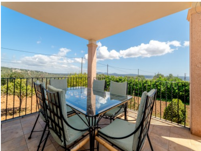
Entspannter Essbereich im Freien