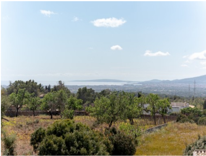
Panoramablick auf die Bucht von Palma