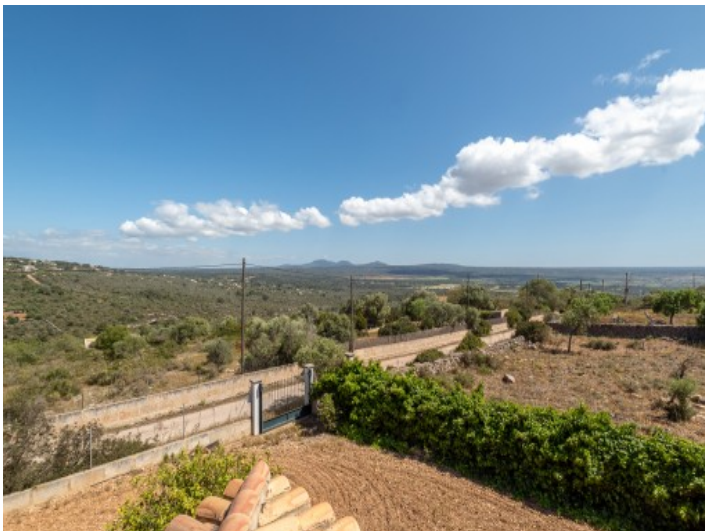
Blick auf die umliegende Landschaft