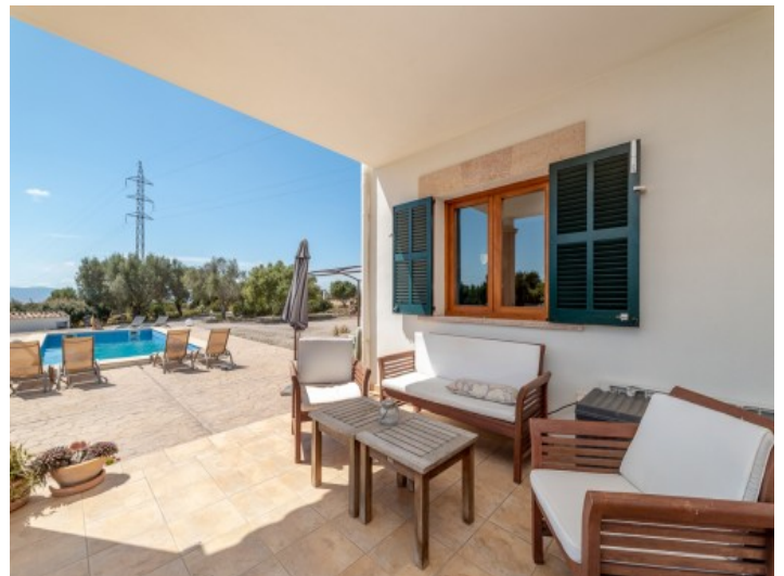
Überdachter Sitzbereich auf der Terrasse