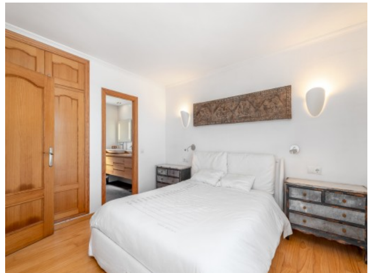
Hauptschlafzimmer mit Bad en Suite