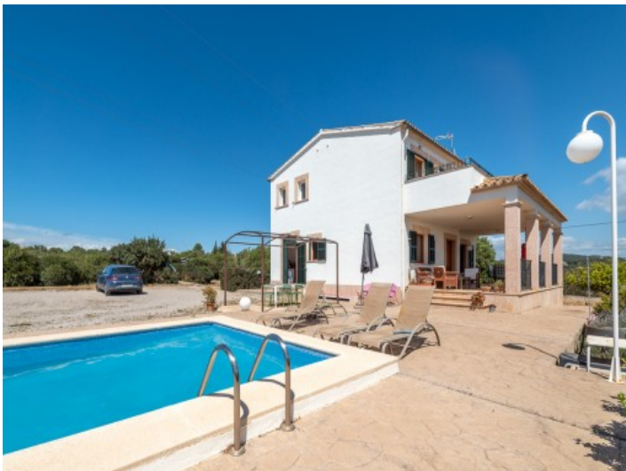
Großer Pool- und Außenbereich