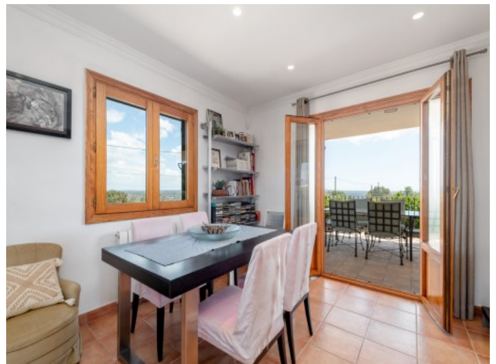
Essbereich mit Terrassenzugang

Alle Angaben nach bestem Wissen. Irrtum und Zwischenverkauf vorbehalten. Dieses Exposé ist eine Vorinformation, als Rechtsgrundlage gilt allein der notariell abgeschlossene Kaufvertrag.