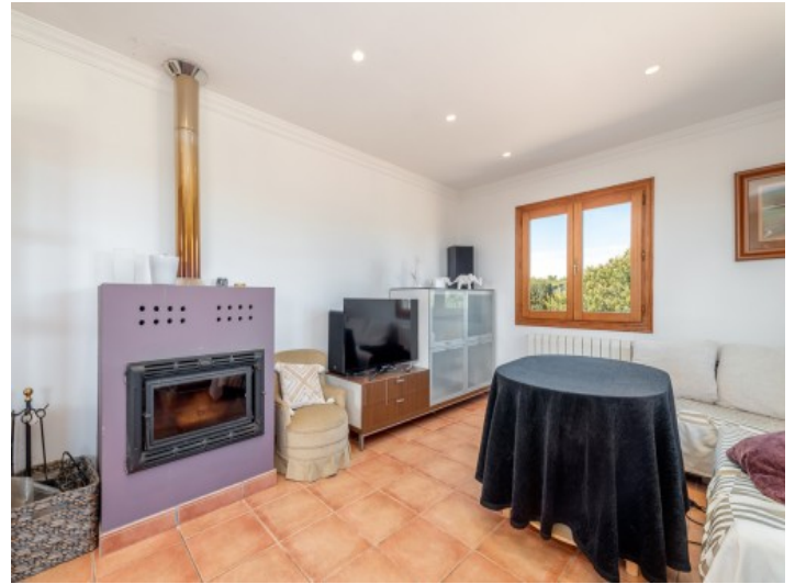
Kamin für Wintertage