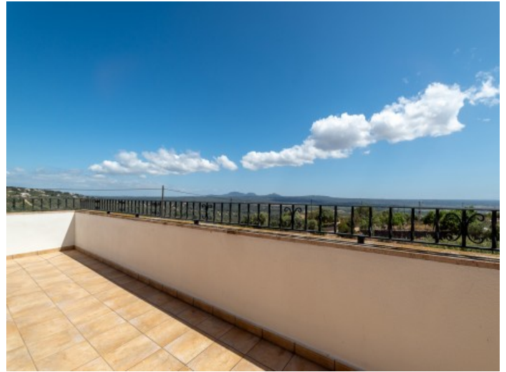
Obere Terrasse mit Weitblick