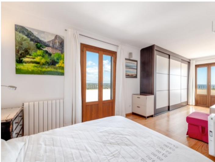
Hauptschlafzimmer mit Terrassenzugang