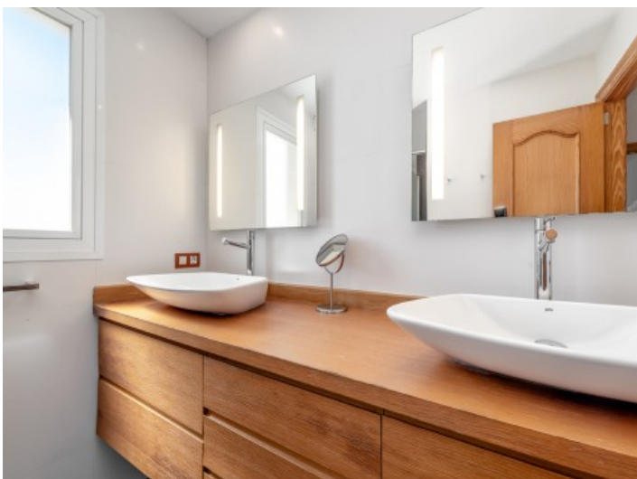
Modernes en Suite Badezimmer