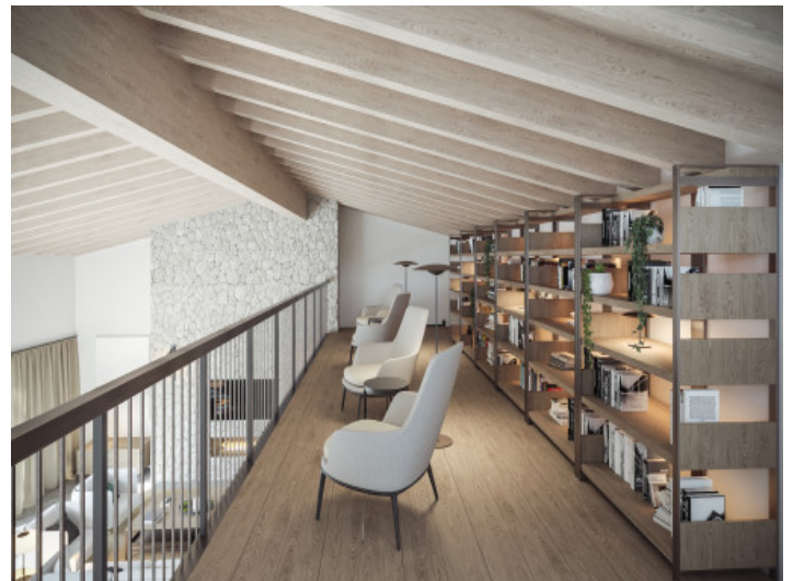
Galerie mit Bibliothek