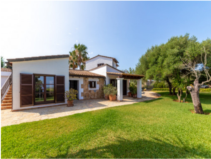
Gartenbereich und Außenansicht