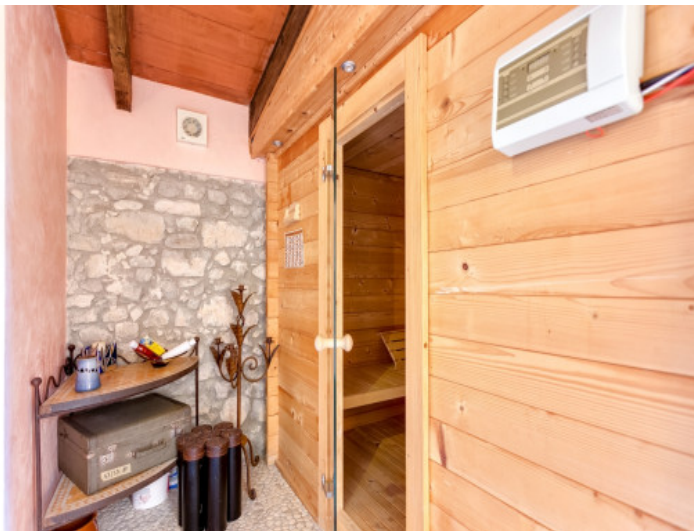
Spa mit Sauna