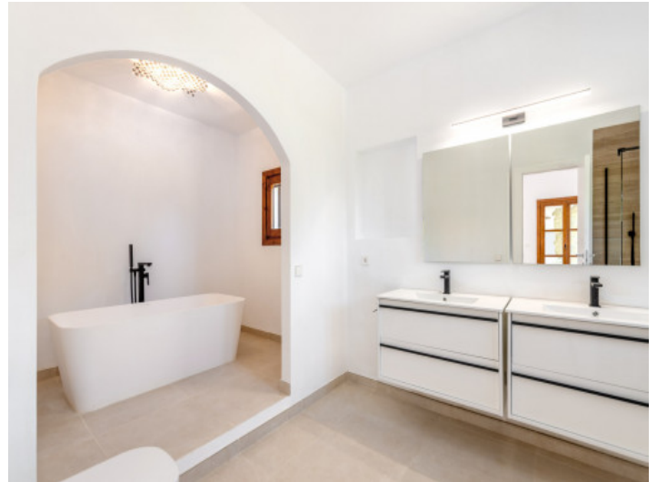
Badezimmer en Suite mit Badewanne