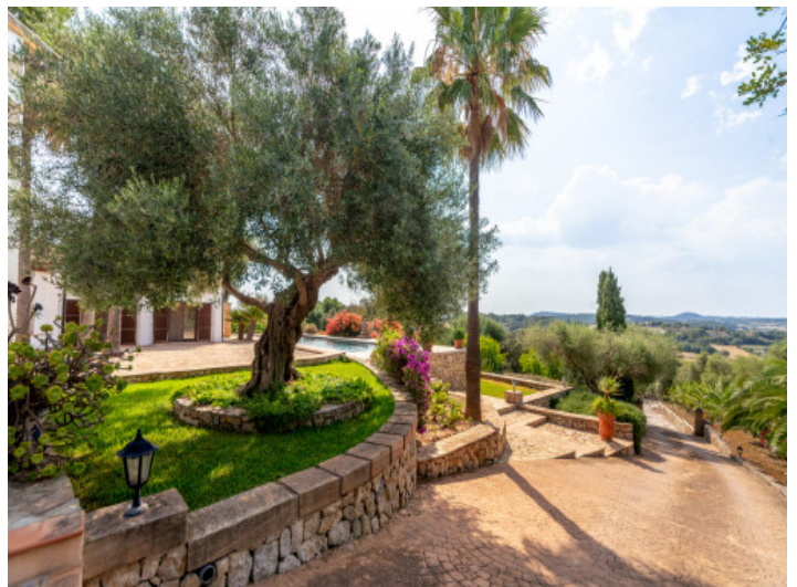
Zufahrt zur Finca

Alle Angaben nach bestem Wissen. Irrtum und Zwischenverkauf vorbehalten. Dieses Exposé ist eine Vorinformation, als Rechtsgrundlage gilt allein der notariell abgeschlossene Kaufvertrag.