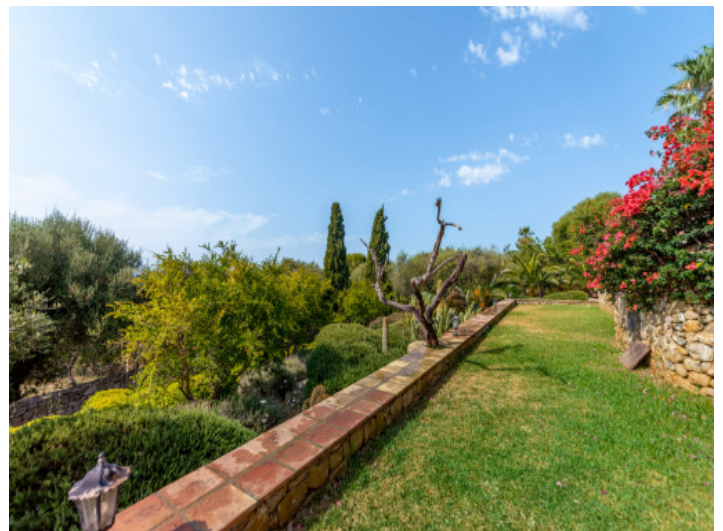
Gartenbereich und Weitblick

Alle Angaben nach bestem Wissen. Irrtum und Zwischenverkauf vorbehalten. Dieses Exposé ist eine Vorinformation, als Rechtsgrundlage gilt allein der notariell abgeschlossene Kaufvertrag.