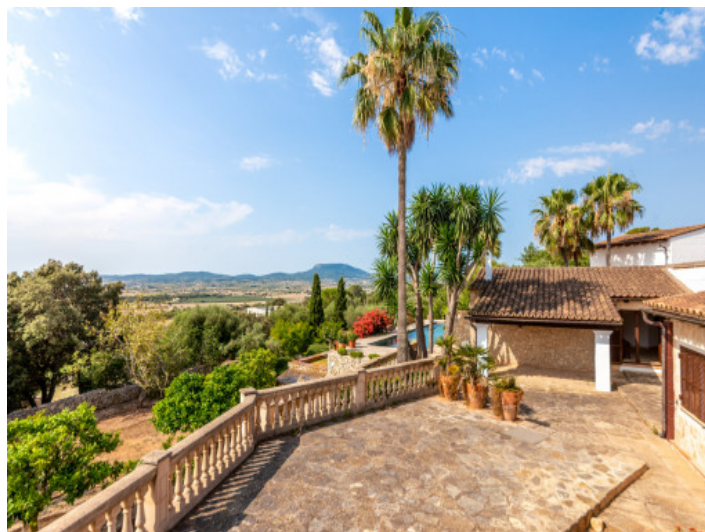
Blick über die Terrasse