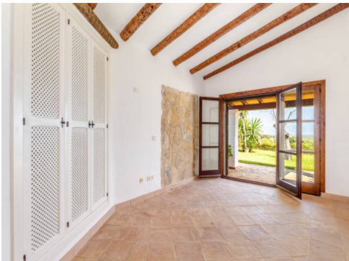
Weiteres Schlafzimmer mit Einbauschränk