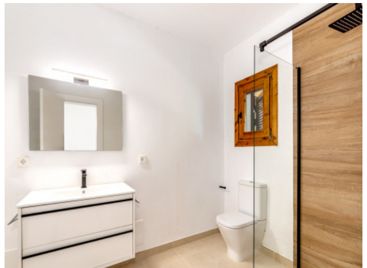
Badezimmer en Suite mit ebenerdiger Duscher

Alle Angaben nach bestem Wissen. Irrtum und Zwischenverkauf vorbehalten. Dieses Exposé ist eine Vorinformation, als Rechtsgrundlage gilt allein der notariell abgeschlossene Kaufvertrag.