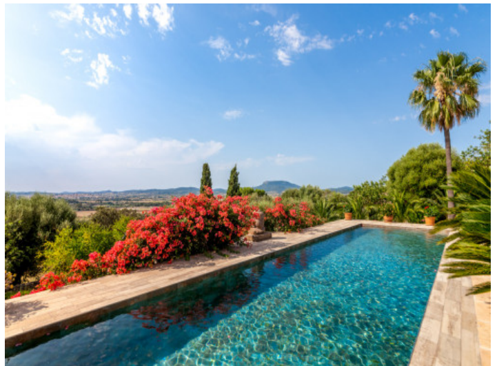
Fantastischer Pool mit Weitblick