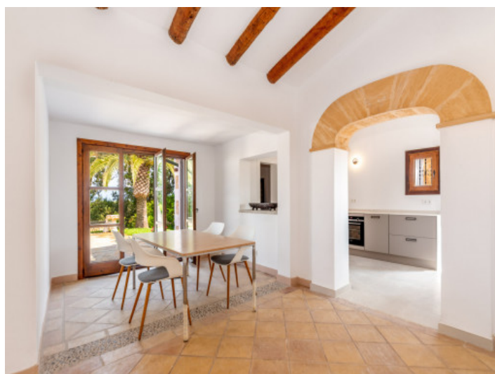
Essbereich und Zugang zur Küche

Alle Angaben nach bestem Wissen. Irrtum und Zwischenverkauf vorbehalten. Dieses Exposé ist eine Vorinformation, als Rechtsgrundlage gilt allein der notariell abgeschlossene Kaufvertrag.