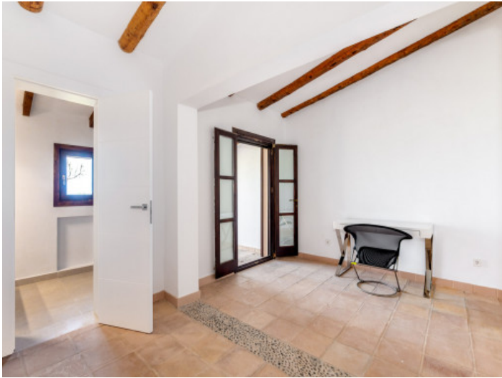
Eines von 6 Schlafzimmern mit Badezimmer und Sütie