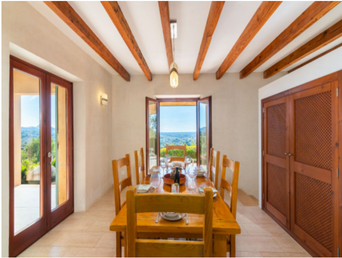
Essbereich mit Terrassenzugang