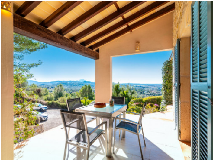
Herrlicher Landschaftsblick von der Terrasse