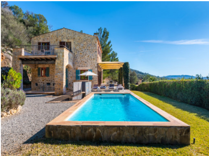
Finca und Pool