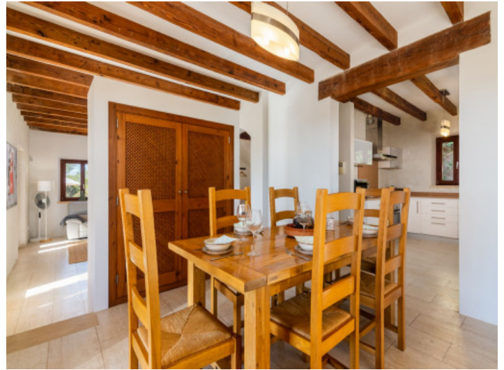
Offene Küche und Essbereich