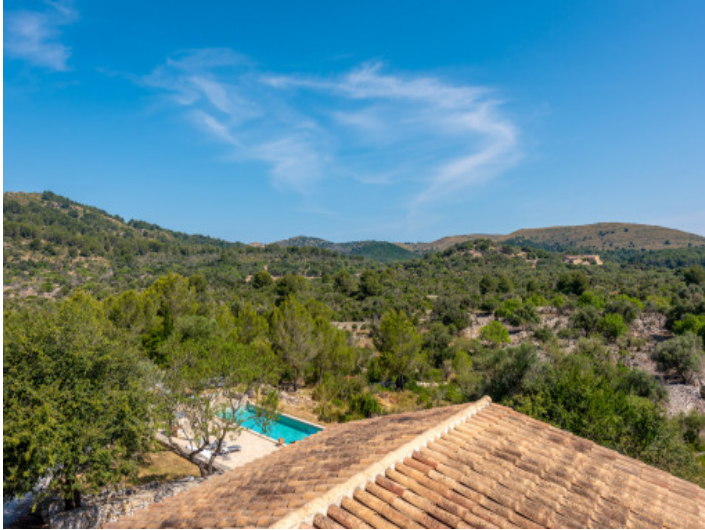
Blick von Schlafzimmer