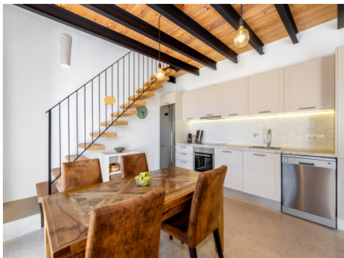
Essbereich und Küche