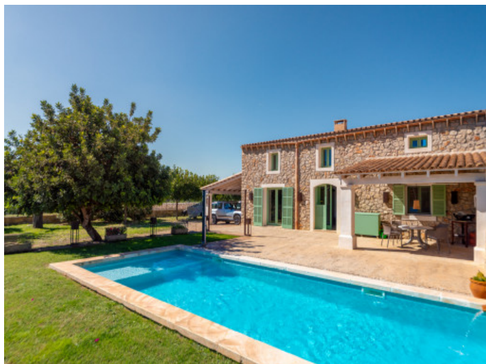
Garten und Pool