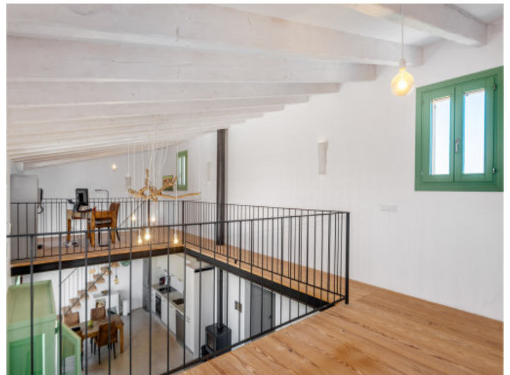
Arbeitsbereich 1. Etage