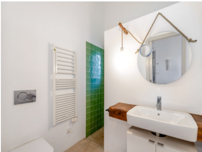
Finca mit 2 Badezimmern