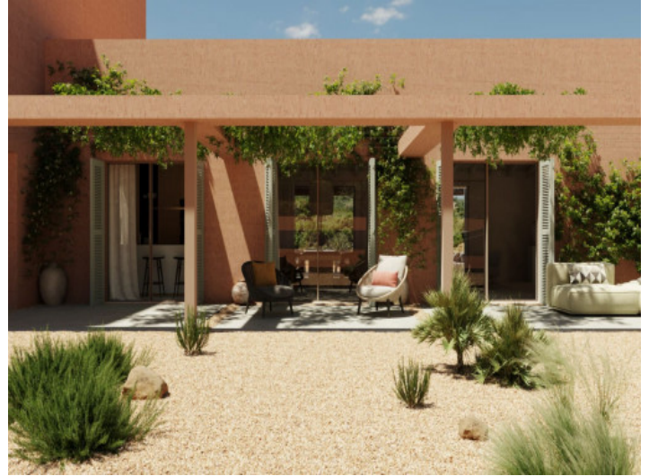
Lebensqualität auf Mallorca