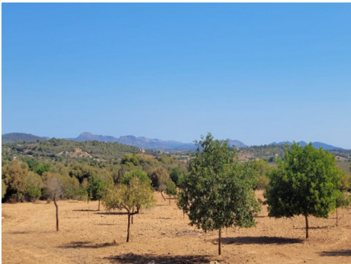
Grundstück mit Weitblick