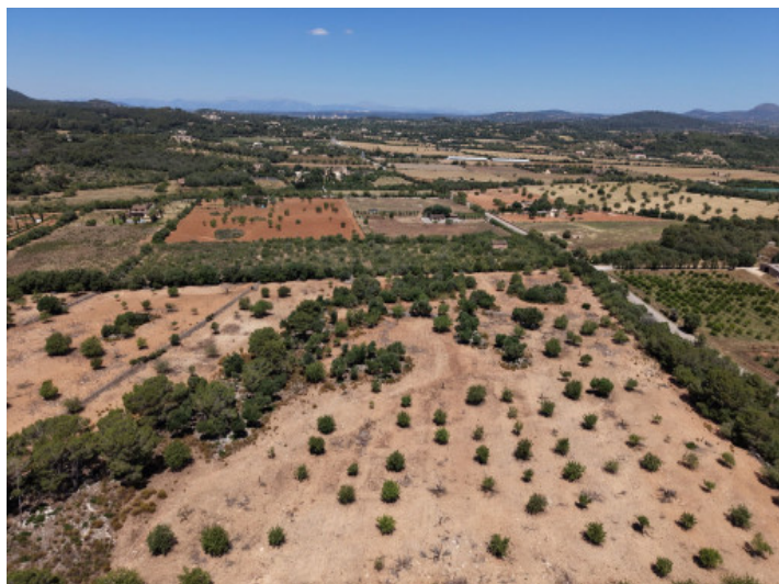
Weitblick über die ganze Insel