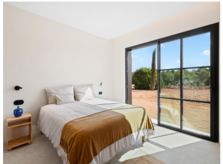
Schlafzimmer im Untergeschoss mit Zugang zum Garten