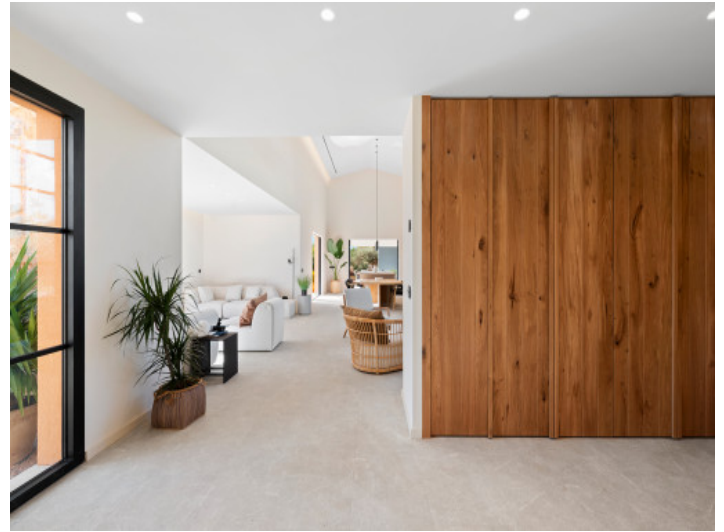
Untergeschoss mit architektonischem Anspruch