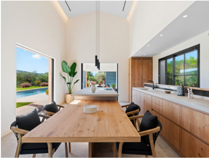
Hochwertige Küche im Landhausstil