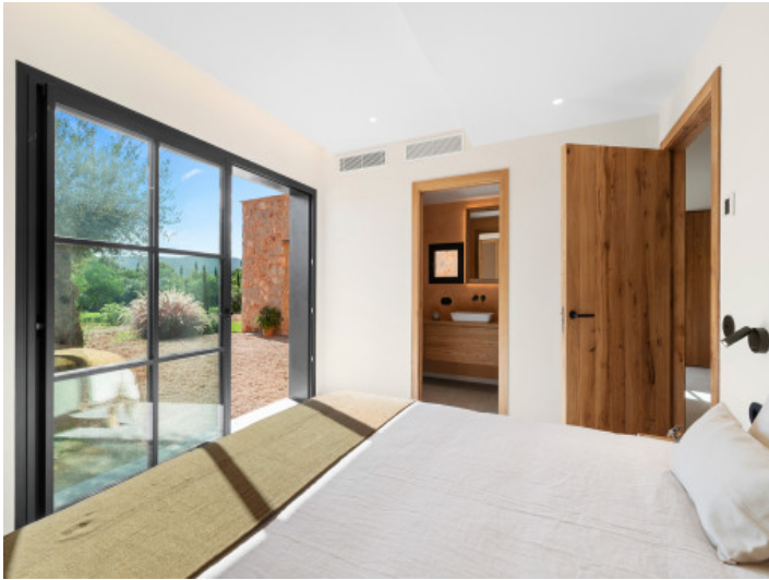
Schlafzimmer im Untergeschoss mit Zugang zum Garten