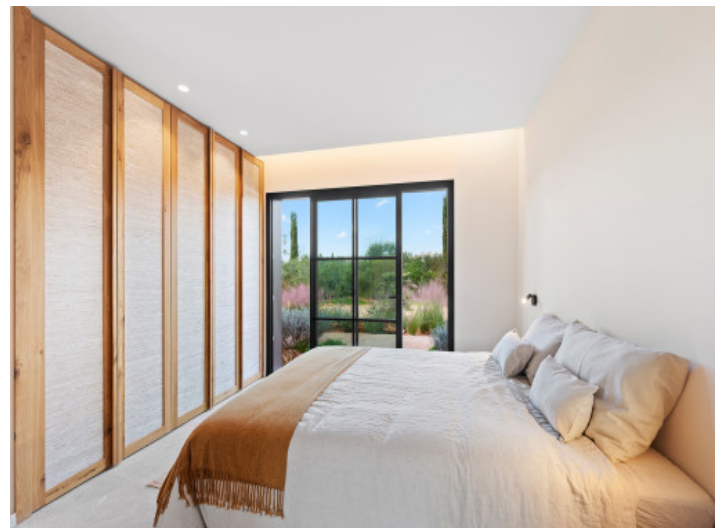
Schlafzimmer im Untergeschoss mit Zugang zum Garten

Alle Angaben nach bestem Wissen. Irrtum und Zwischenverkauf vorbehalten. Dieses Exposé ist eine Vorinformation, als Rechtsgrundlage gilt allein der notariell abgeschlossene Kaufvertrag.