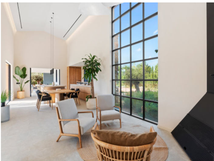
Lichtdurchfluteter Wohnraum mit modernem Design