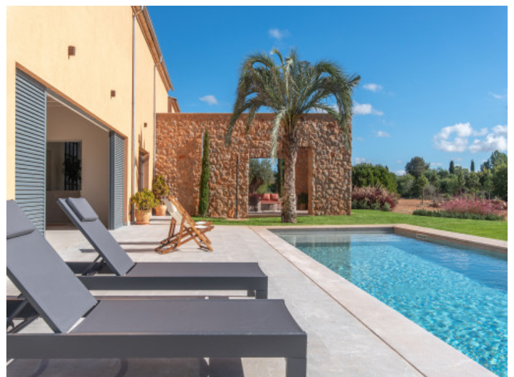
Weitläufiger Poolbereich für pure Entspannung

Alle Angaben nach bestem Wissen. Irrtum und Zwischenverkauf vorbehalten. Dieses Exposé ist eine Vorinformation, als Rechtsgrundlage gilt allein der notariell abgeschlossene Kaufvertrag.