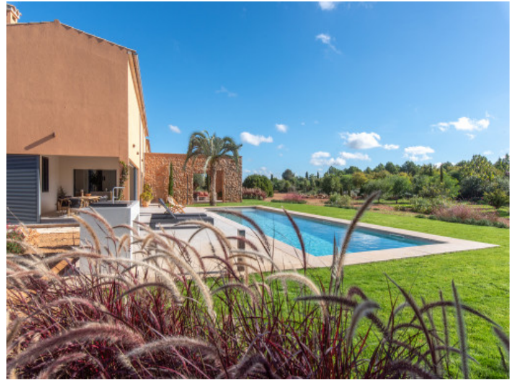
Naturnahe Gartenlandschaft im Inselstil