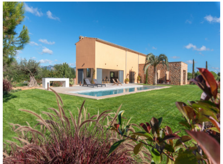
Grüne Ruheoase rund ums Haus