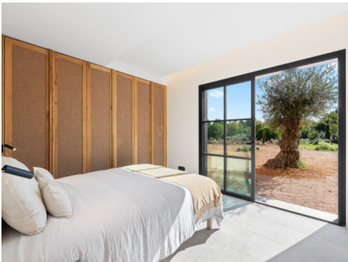
Schlafzimmer im Untergeschoss mit Zugang zum Garten