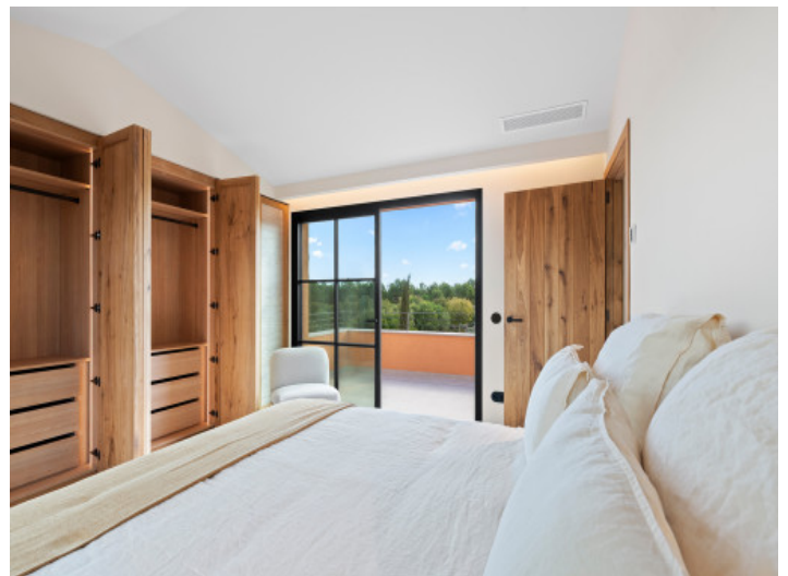
Schlafzimmer im Obergeschoss mit eigener privater Terrasse

Alle Angaben nach bestem Wissen. Irrtum und Zwischenverkauf vorbehalten. Dieses Exposé ist eine Vorinformation, als Rechtsgrundlage gilt allein der notariell abgeschlossene Kaufvertrag.