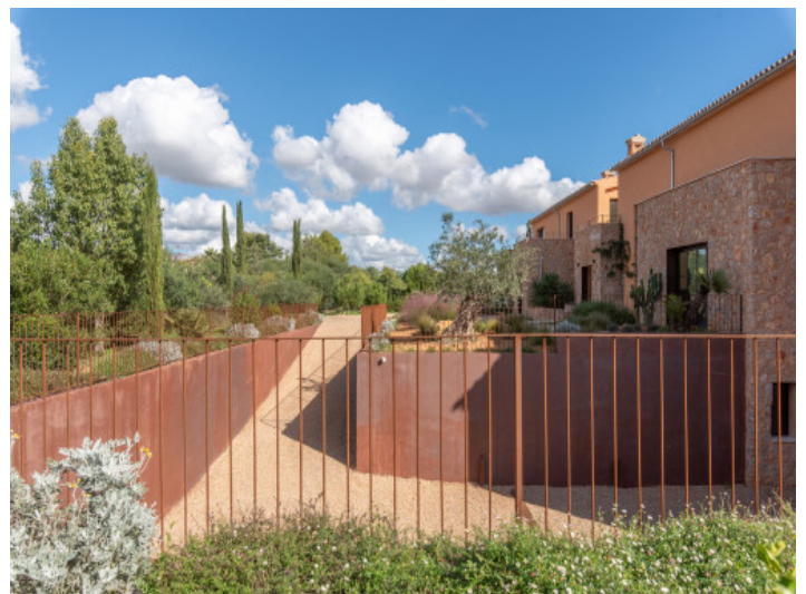
Zufahrt zur Tiefgarage