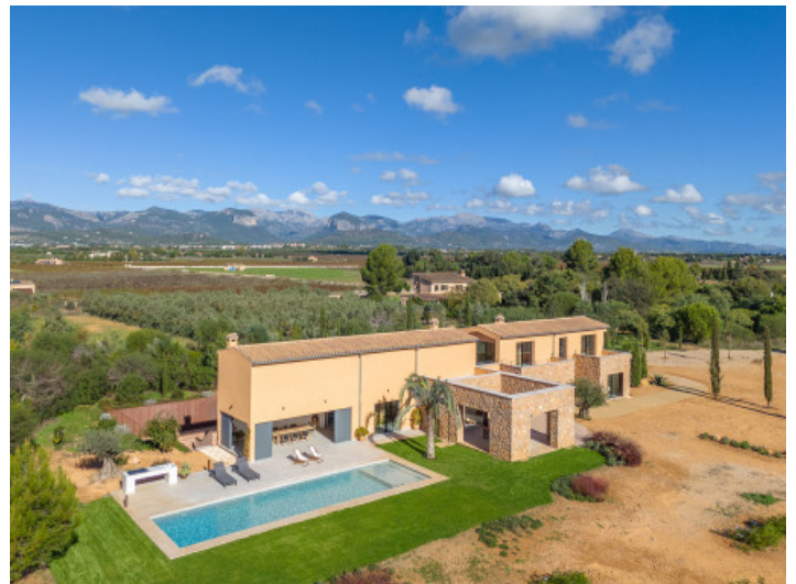
Finca mit großzügige Raumgestaltung auf zwei Ebenen