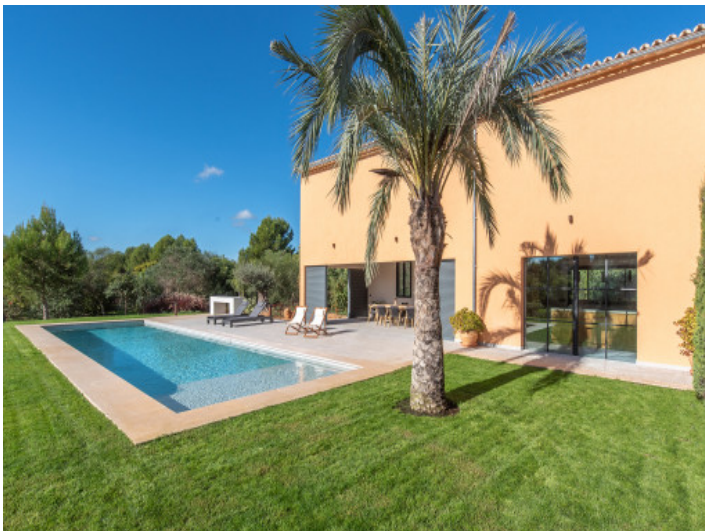
Weitläufiger Poolbereich für pure Entspannung