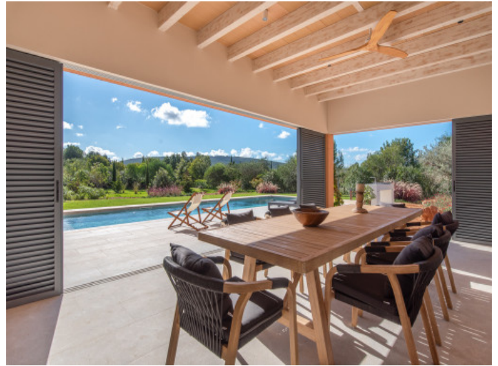
Terrassenbereich mit variabler Beschattung und Windschutz