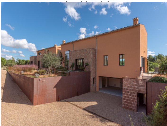
Einfahrt zur Tiefgarage