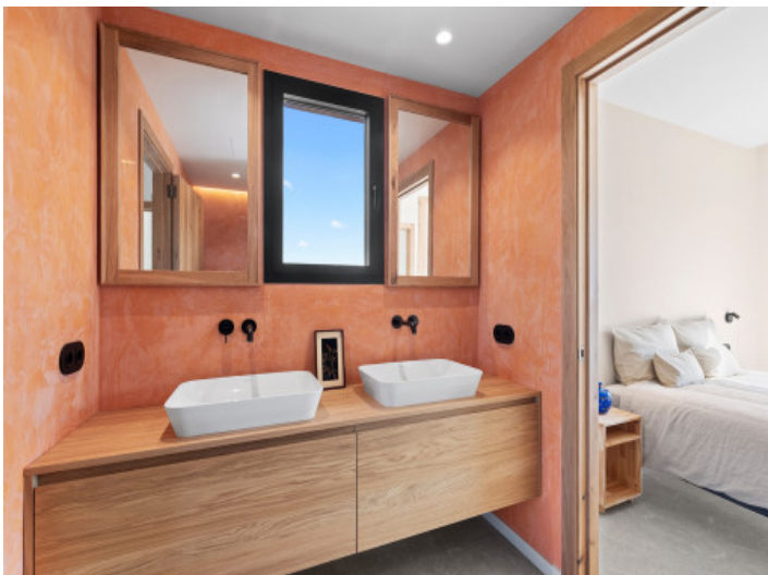
Modernes und zeitloses Badezimmer