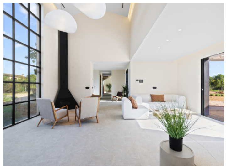
Lichtdurchfluteter Wohnraum mit Kamin

Alle Angaben nach bestem Wissen. Irrtum und Zwischenverkauf vorbehalten. Dieses Exposé ist eine Vorinformation, als Rechtsgrundlage gilt allein der notariell abgeschlossene Kaufvertrag.