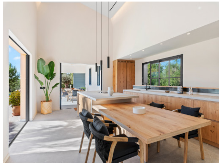
Offener Essbereich mit direktem Zugang nach draußen