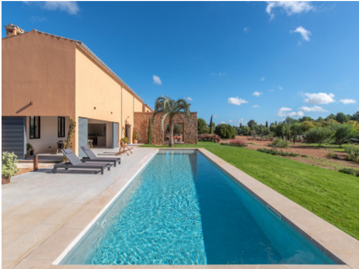
Designer-Neubaufinca in Santa Maria mit Blick auf Pool, Terrasse und