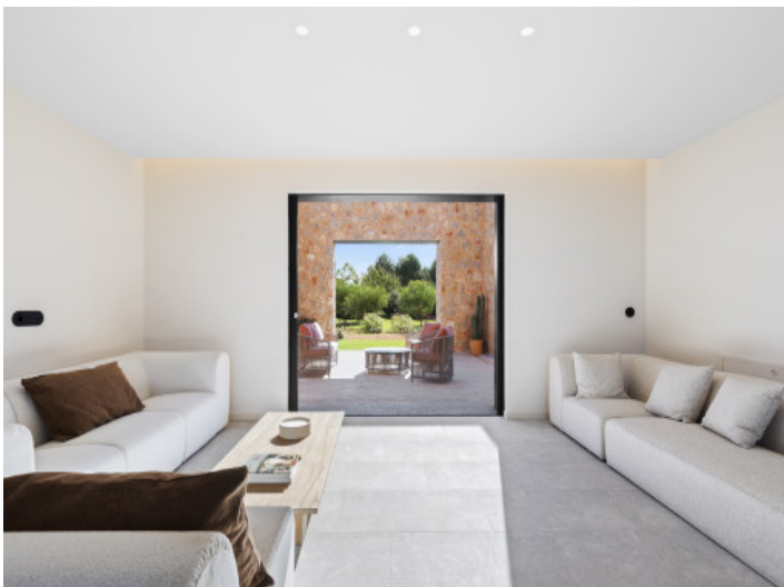
Offenes Wohnkonzept mit Blick ins Grüne