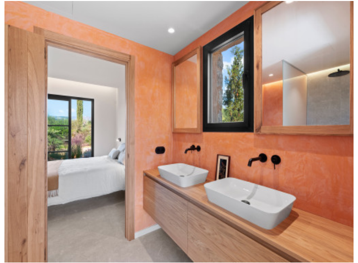
Badezimmer im Untergeschoss