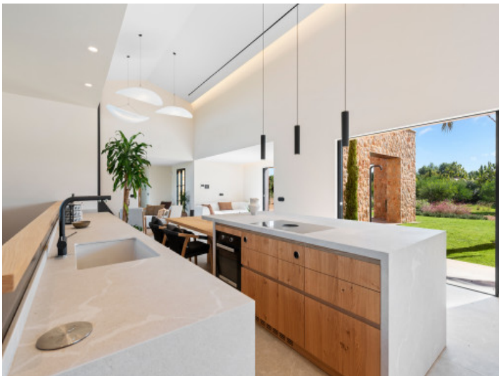
Küche mit Blick zur Terrasse