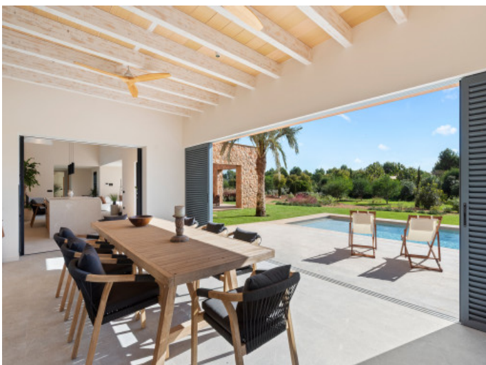
Indoor-Outdoor-Dining mit Blick ins Grüne