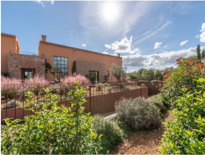
Grüne Ruheoase rund ums Haus