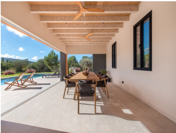
Terrasse mit vollständig schließbaren Persianas

Alle Angaben nach bestem Wissen. Irrtum und Zwischenverkauf vorbehalten. Dieses Exposé ist eine Vorinformation, als Rechtsgrundlage gilt allein der notariell abgeschlossene Kaufvertrag.