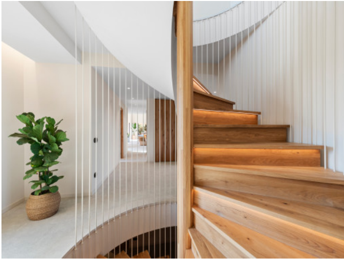
Designertreppe als architektonisches Highlight