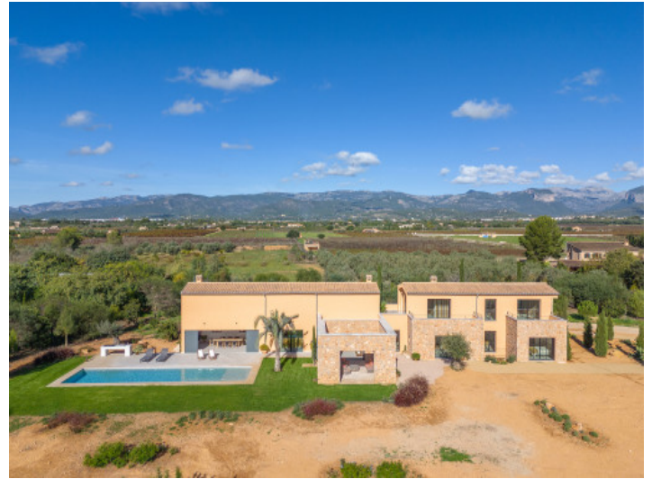
Vorderansicht der Designer-Neubaufinca in Santa Maria mit klarer Architektur und mediterranem Charakter