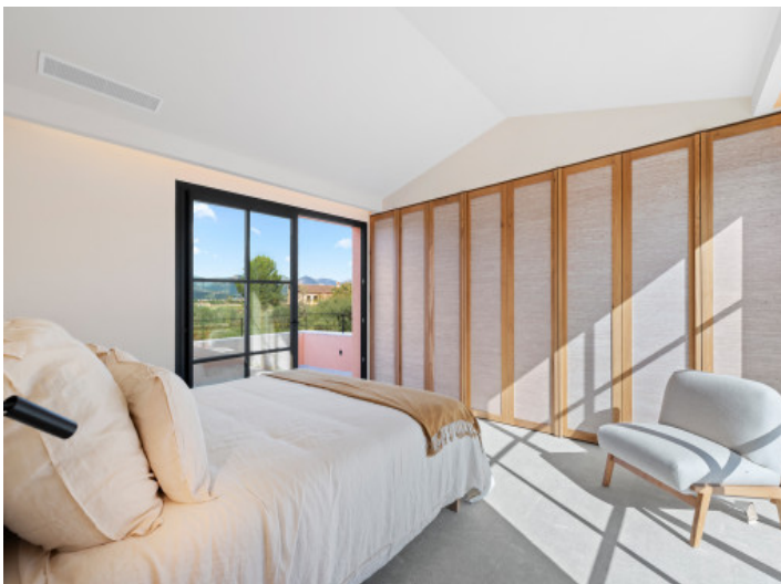
Schlafzimmer im Obergeschoss mit eigener privater Terrasse