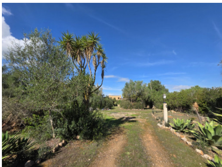
Zufahrt in die Finca