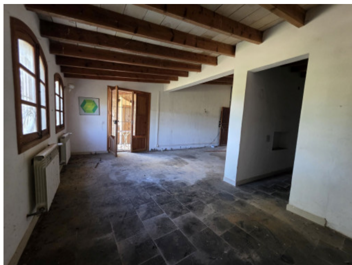
Großer Raum im Erdgeschoss

Alle Angaben nach bestem Wissen. Irrtum und Zwischenverkauf vorbehalten. Dieses Exposé ist eine Vorinformation, als Rechtsgrundlage gilt allein der notariell abgeschlossene Kaufvertrag.