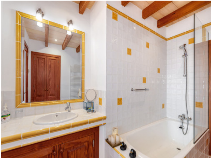
Zweites komplettes Bad