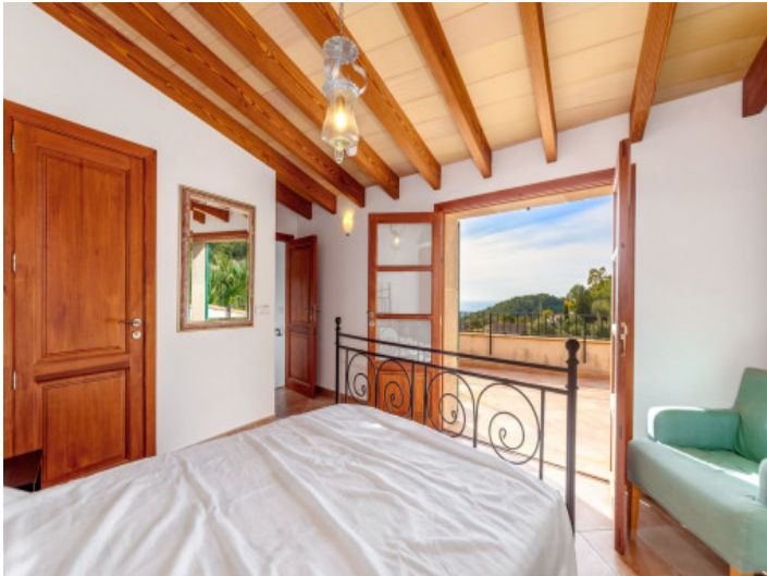
Schlafzimmer mit direktem Terrassenzugang

PORTA MALLORQUINA® Your home. Our passion.