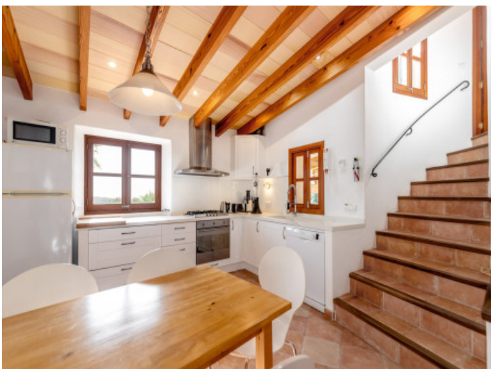
Helle und moderne 2. Küche