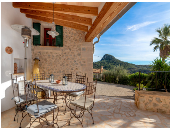
Gemütliche Essecke im Aussenbereich