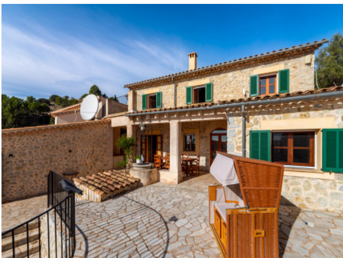
Naturstein Fassade ganz im mallorquinischem Stil