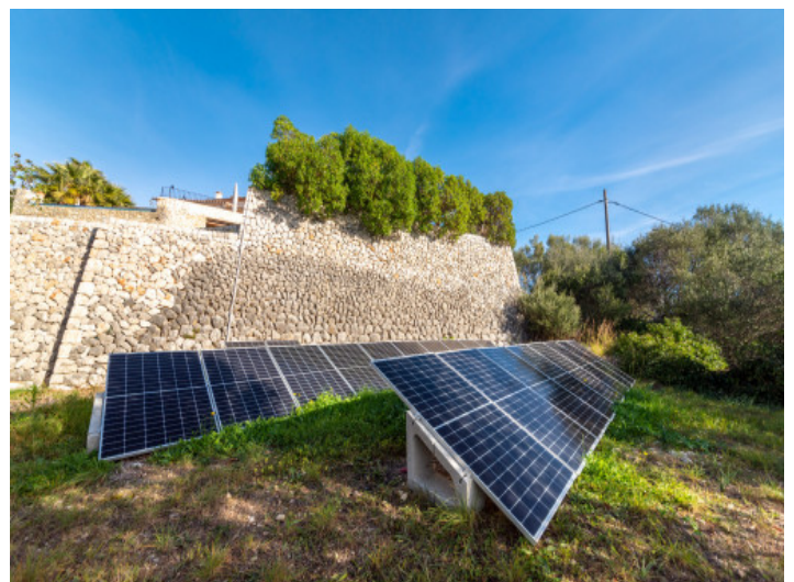
Solarenergie auf dem Grundstück

Alle Angaben nach bestem Wissen. Irrtum und Zwischenverkauf vorbehalten. Dieses Exposé ist eine Vorinformation, als Rechtsgrundlage gilt allein der notariell abgeschlossene Kaufvertrag.