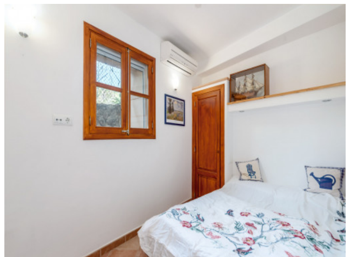
Schlafzimmer mit Klimaanlage

Alle Angaben nach bestem Wissen. Irrtum und Zwischenverkauf vorbehalten. Dieses Exposé ist eine Vorinformation, als Rechtsgrundlage gilt allein der notariell abgeschlossene Kaufvertrag.