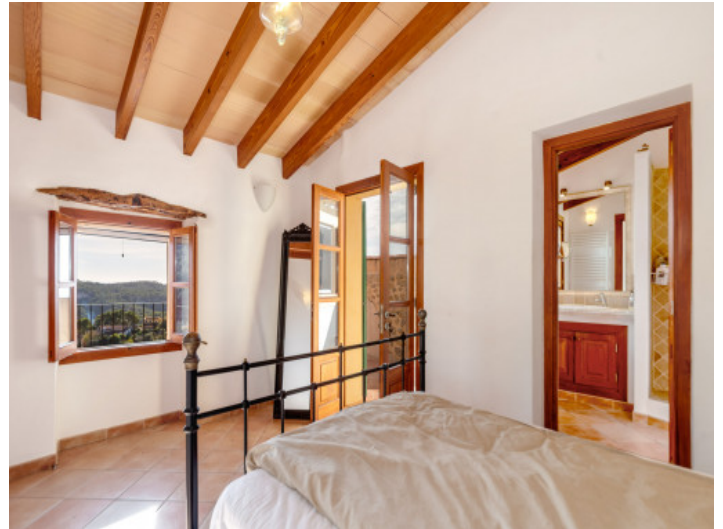
Schlafzimmer mit Holzbalkendecke