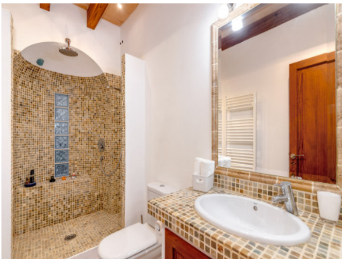
Duschbad im Landhausstil