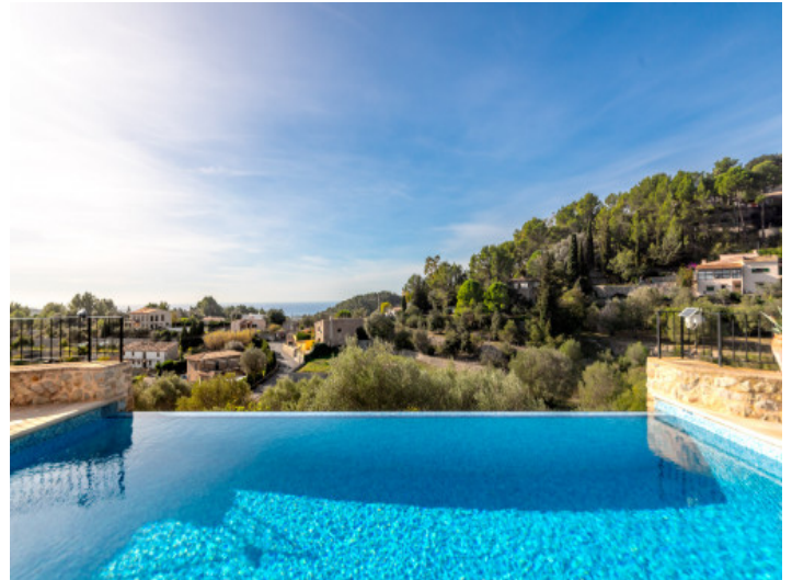
Schöner Infinity Pool