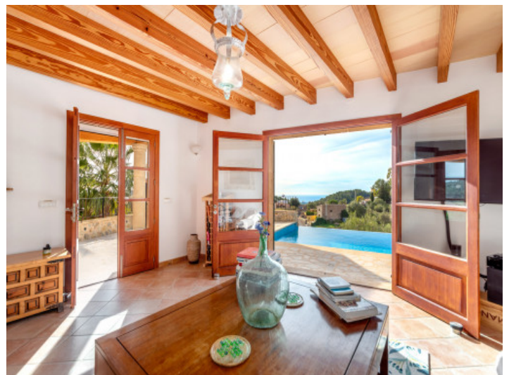
Helles Wohnzimmer mit Aussicht