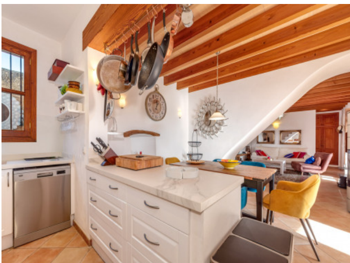
Moderne offene Küche