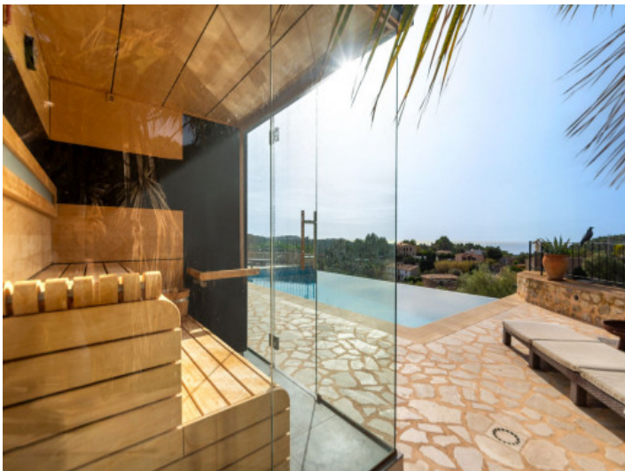
Sauna am Poolbereich