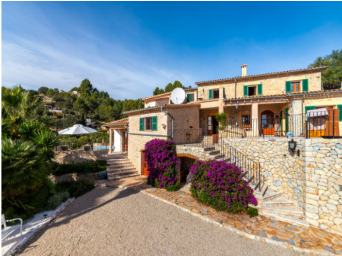
Charmantes Dorfhaus mit Pool in Galilea