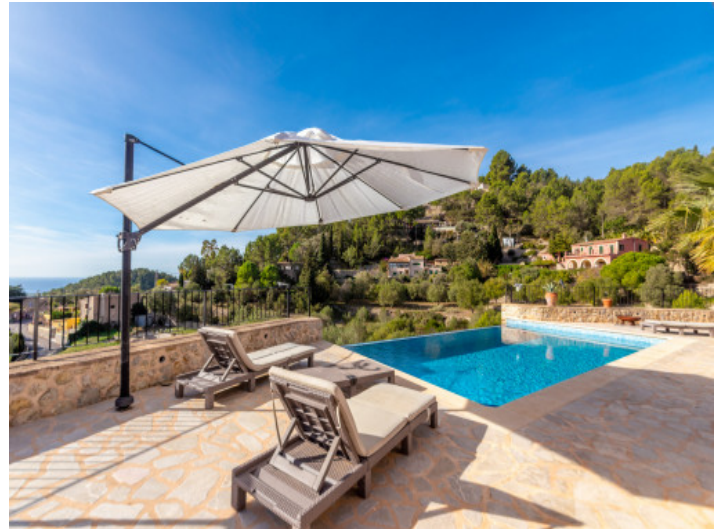
Große Naturstein Sonnenterrasse